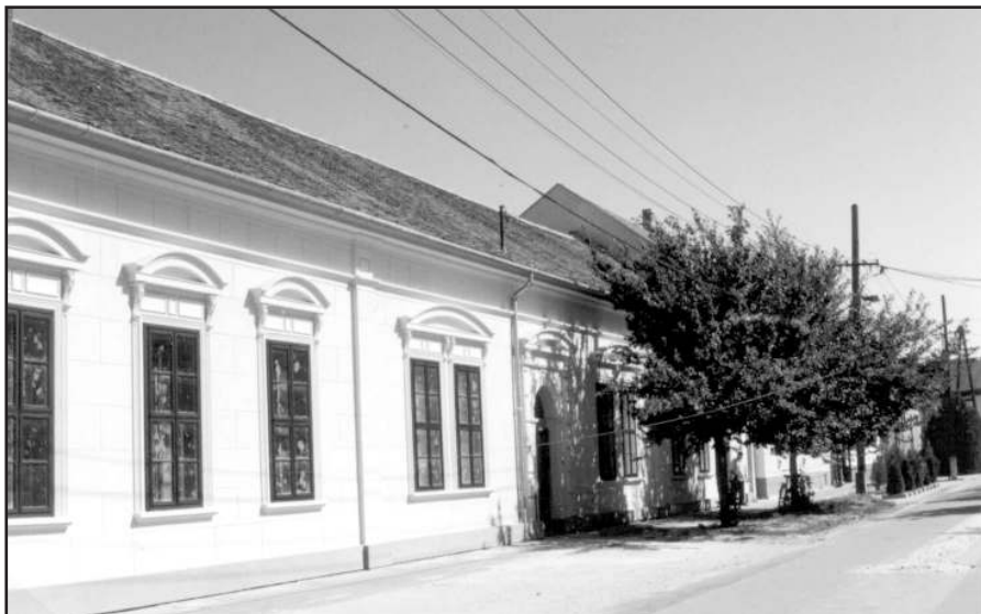
A Gyermekek Otthona a Szeremlei utcában