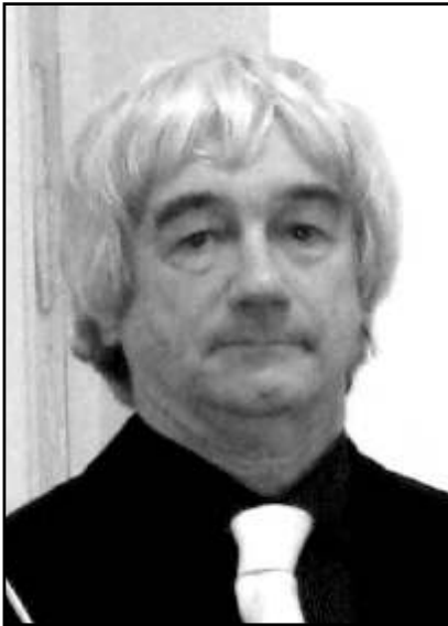
A „Signum Urbis Honorantis” kitüntetés díjazottja

Hódmezővásárhely Megyei Jogú Város Önkormányzatának elismeréseként 2010. március 15-én az Ünnepi Díszközgyűlésén kitüntetések adományozott. Kitüntetettjeinknek gratulálunk!