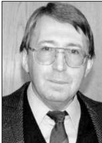
A „Pro Urbe” kitüntetés díjazottja

Egyéni alkotói munkásságával hazai és külföldi kiállításokon egyaránt megismerkedhetek az érdeklődők. Legutóbb a vásárhelyi galériában rendezett Szórtfényben kiállításán, ahol az eddigi legszebb műveit láthattuk.