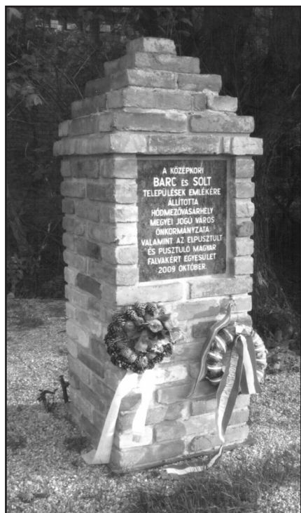
Emlékoszlop Barc és Solt emlékére

- 2006 szeptemberében a makói határban Igás falu helyét örökítettük