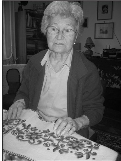
A „Signum Urbis Honorantis” kitüntetés díjazottja

Kutatási és szakmai érdeklődési területe főként a makrogazdaság teljesítményére ható tényezők vizsgálata, a gazdasági hatékonyságot befolyásoló módszerek tanulmányozása. 2000-től a hódmezővásárhelyi városi kamarai szervezet elnöke. A Magyar Kereskedelmi és Iparkamara védjegyszakértője, az Európai Felsőszintű Ingatlanszakmai Minősítés Szervezetének elnökségi tagja. 2002-től a Hódmezővásárhelyi Gazdasági Szenátus tagja.