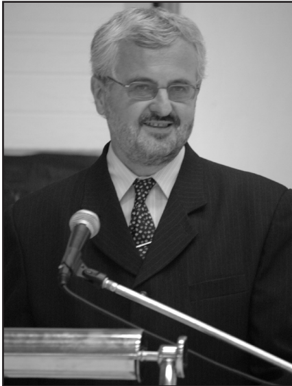
A „Pro Urbe” kitüntetés díjazottja

Hódmezővásárhely Megyei Jogú Város Önkormányzatának elismeréseként 2010. március 15-én az Ünnepi Díszközgyűlésén kitüntetések adományozott. Kitüntetettjeinknek gratulálunk!