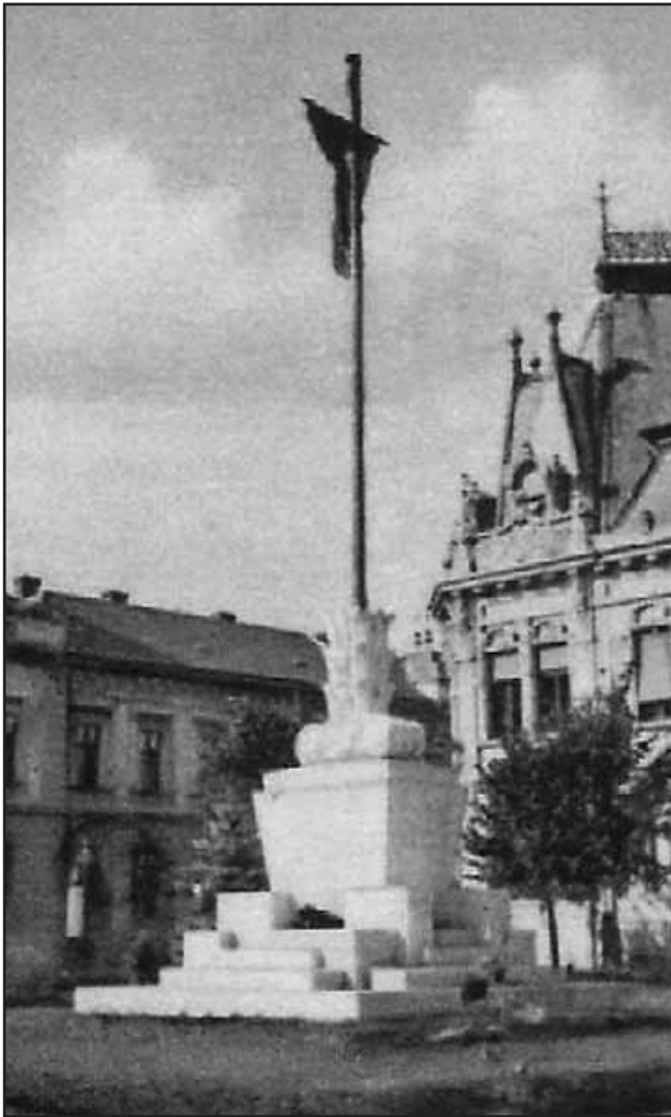
AZ ORSZÁGZÁSZLÓ A KOSSUTH TÉREN

Az 1920. június 4-i trianoni diktátumot követően Magyarországon a különböző szervezetek Trianon ellenes tüntetései mindennaposak voltak. Már 1920 közepén felvetődött a gondolat, hogy az elszakított területekre emlékeztető szoborcsoportot állítsanak fel Budapesten. Négy szobor készült el: a Nyugat Sidló Ferenc, az Észak Kisfaludi Strobl Zsigmond, a Kelet Pásztor János, a Dél Szentgyörgyi István alkotása. Felszentelésükre 1921. január 16-án került sor Budapesten, a Szabadság téren.