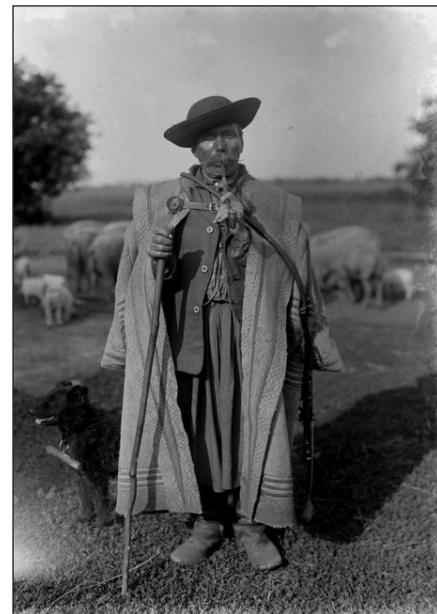
Juhász - korabeli fotó

>>Valamikor, az 1970-es évek elején volt a Magyar Televízióban egy vetélkedő, ahol az egyik feladat az volt, hogy egy karámból 15 darab juhot át kellett terelni egy ugyanolyan másik karámba. Sajnos a versenyzőknek ezt a feladatot nem sikerült megoldaniuk, pedig mindent elkö-