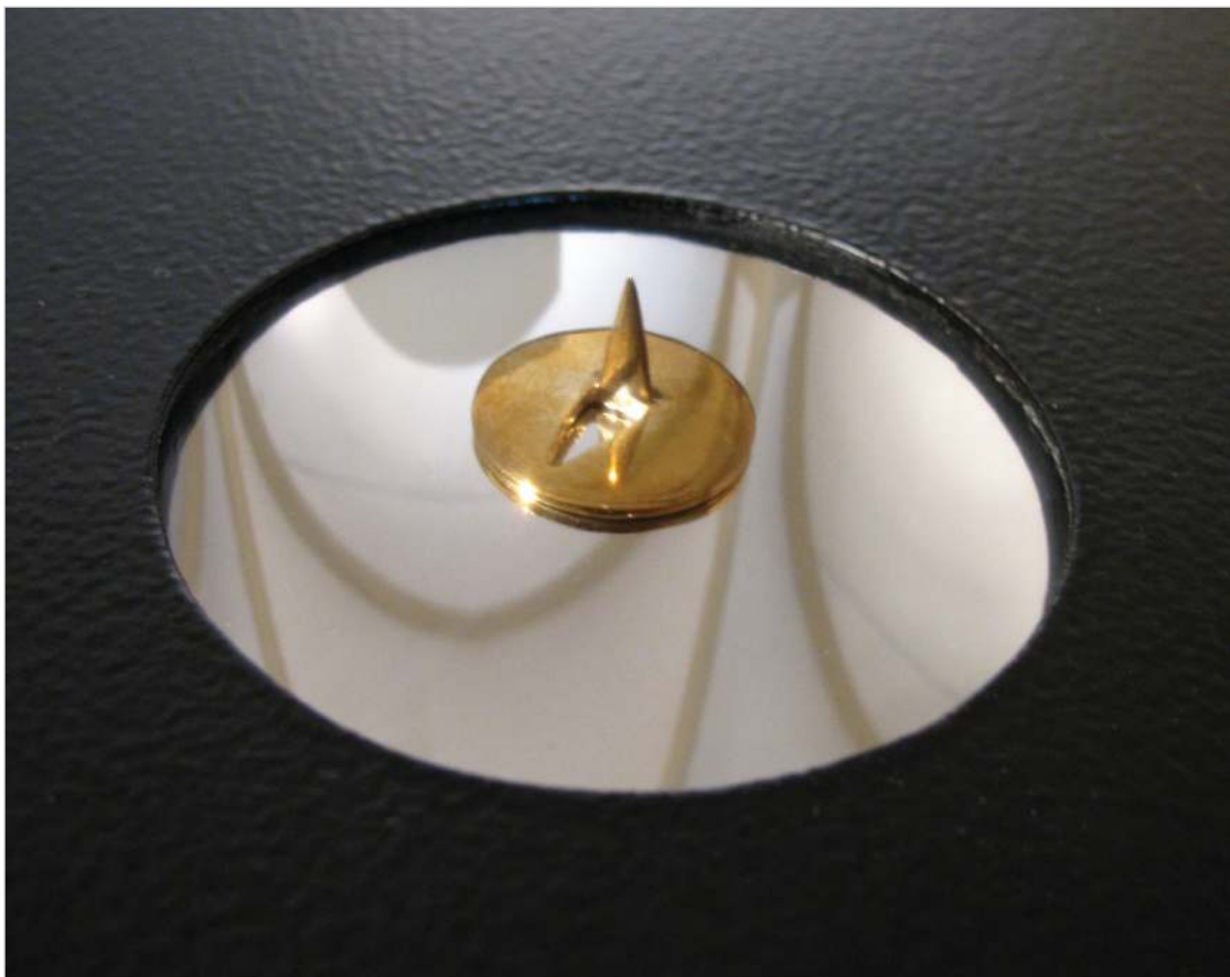
KOMLOVSZKY-SZVET TAMÁS: ANYAG NÉLKÜL