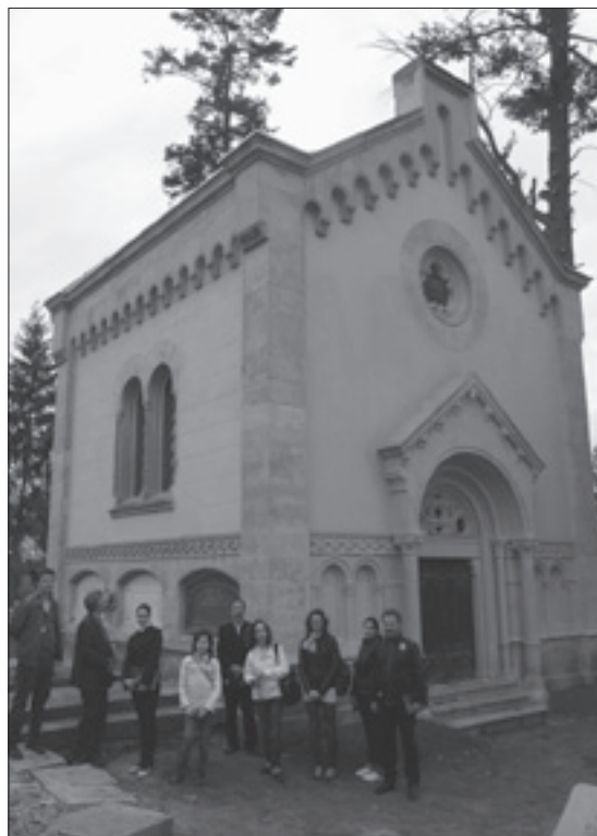
Az iktári Bethlen-kripta a Házsongárdban