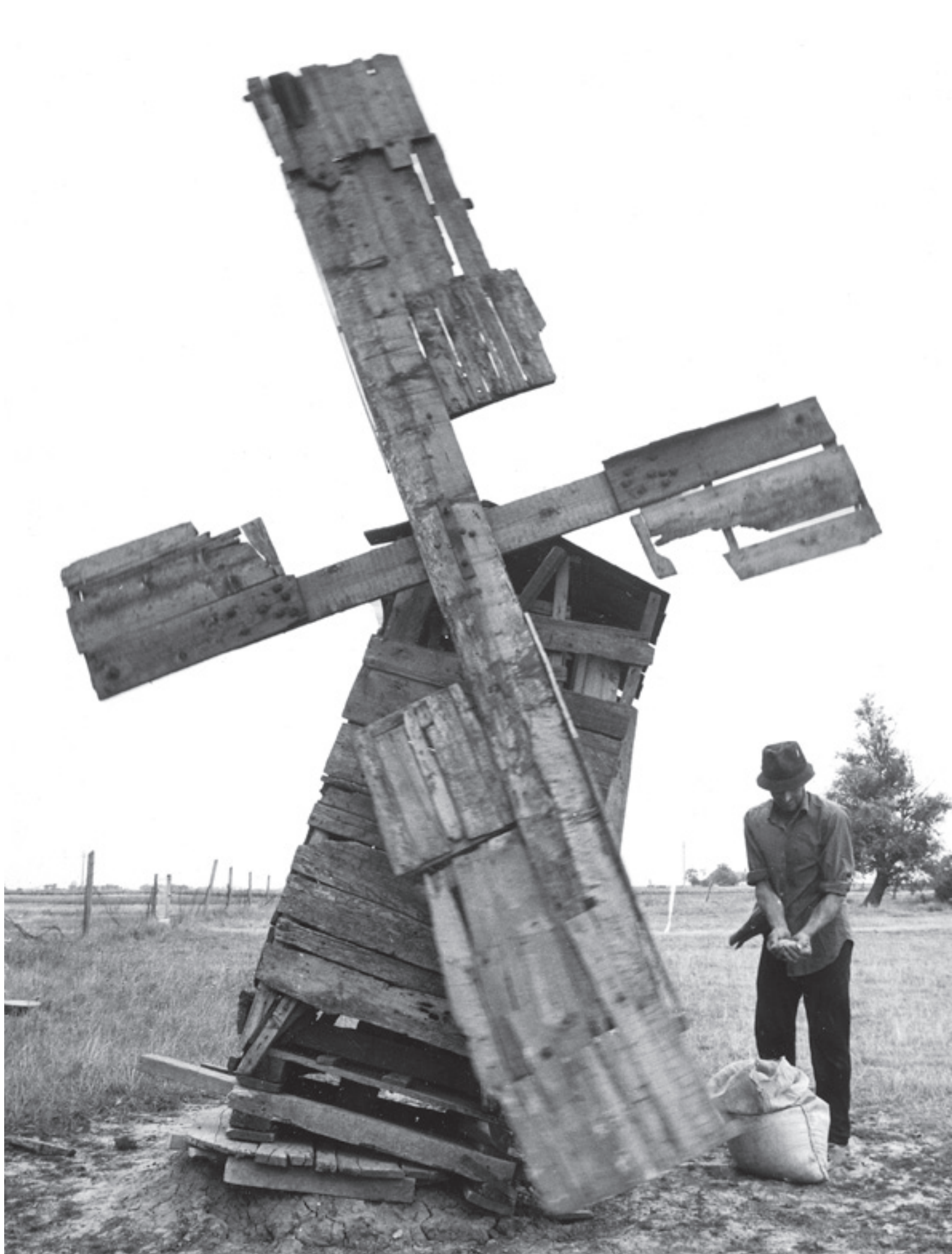
TANYAI SZÉLDARÁLÓ A BÉKÉSSÁMSONI ÚTON (HÓDMEZŐVÁSÁRHELY, 1982)