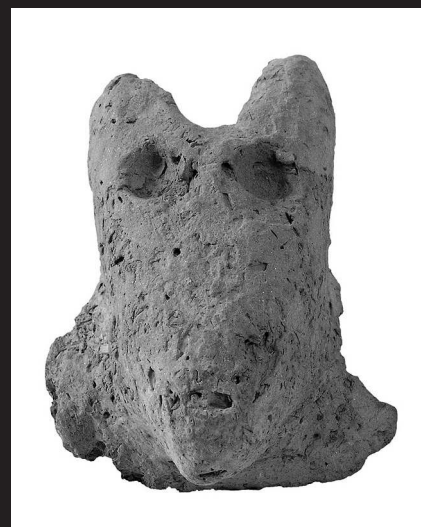
Állatplasztika a 2. sz. házból