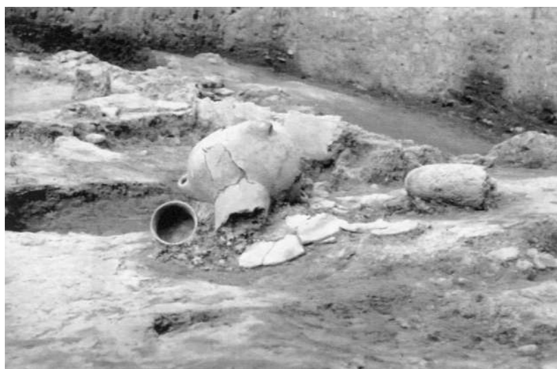
A 3. helyiség romjai