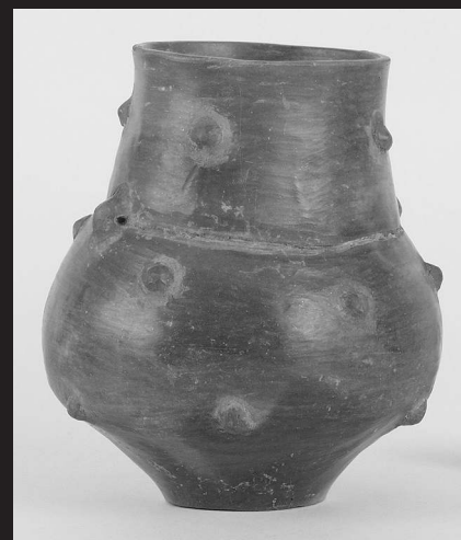
Díszkerámia egy gorzsai sírból