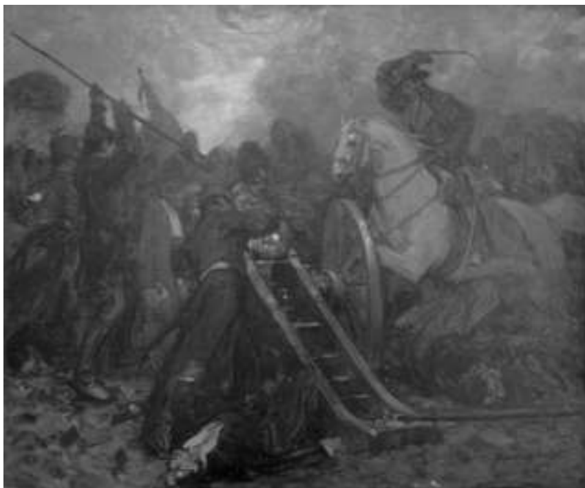
HEGEDŰS LÁSZLÓ Vázlat a segesvári csatához (Bem Szászvárosnál) 1909. (A kép a szentesi Koszta József Múzeum tulajdona)

1901-ben Hegedűs ismét sikert könyvelhetett el: 117 pályamunka közül a 2000 korona pénzzutalommal járó, 100 koronás bankjegytervét az Osztrák-Magyar Bank neki ítélte. Sikerét az országos lapok mellett a Vásárhely és Vidéke is közölte 1901. február 17-i számában. Így az 1902. január 2-án kibocsátott zöld százasokon Hegedűs metszeteit láthatta mindenki, aki megcsodálta a bankókat. A pénz azonban csak az első világháború végéig volt forgalomban.