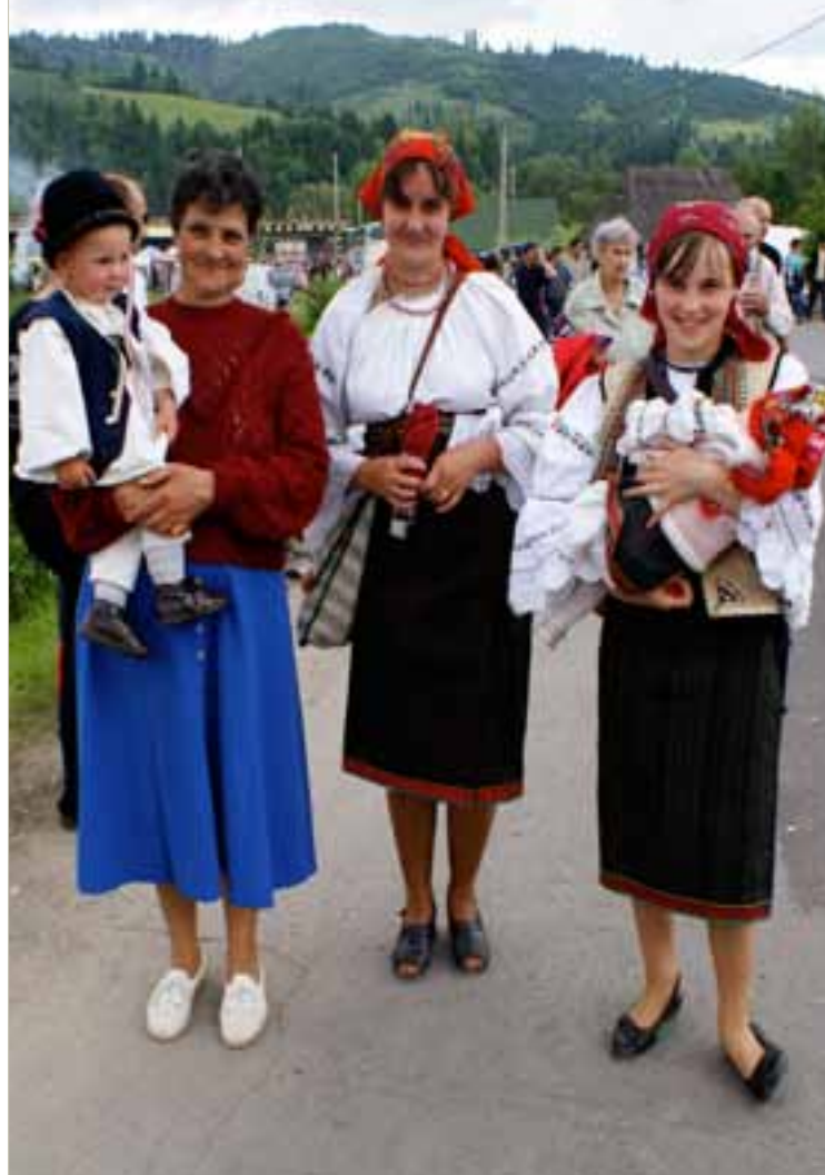
ÜNNEPLŐBE ÖLTÖZÖTT GYIMESI CSÁNGÓ CSALÁD Gyimesbük, 2011.