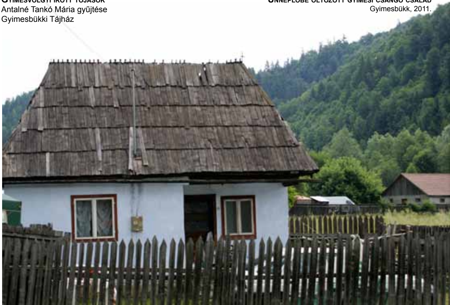
HAGYOMÁNYOS GYIMESI CSÁNGÓ HÁZ UTCAI DESZKAPALÁNKKAL