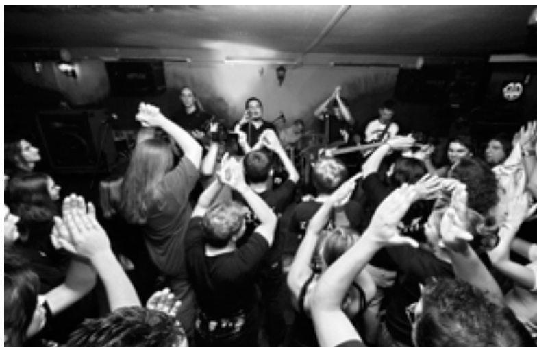
HÓDSTOCK - HÓDMEZŐVÁSÁRHELY