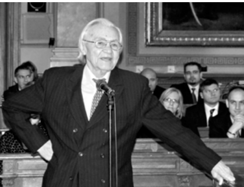
BITSKEY TIBOR SZÍNMŰVÉSZ