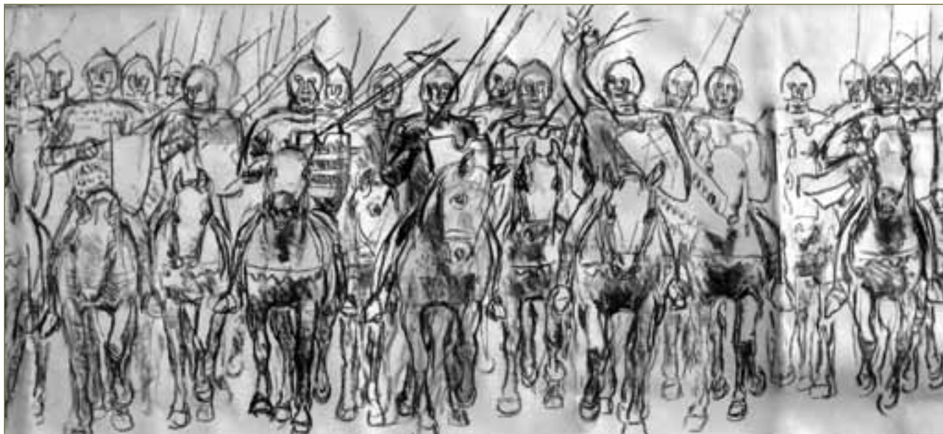
SZALAY FERENC: A HÓDTTÓI CSATA. SECCO VÁZLAT.

Gyermekkorunkban a családnak az országút mellett, Albrecht főherceg bir-