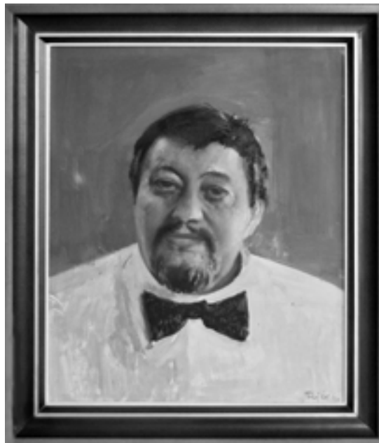
DR. RAPCSÁK ANDRÁS (Debrecen, 1943. július 14. – H. 2002. február 3.)

1990-ben az első szabad önkormányzati választást követően, a többszöri eredménytelen szavazás után, mint pártonkívüli új jelöltet, november 6-án választották meg a város polgármesterének, mely tisztséget haláláig betöltötte.