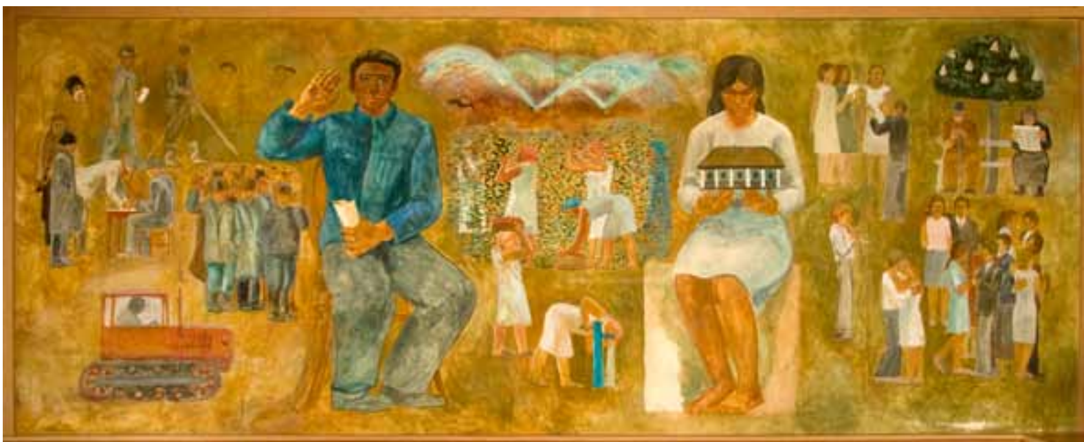
SZALAY FERENC: SZEGVÁR MÚLTJA ÉS JELENE. PANNÓ. (Szegevár és Vidéke Takarékszövetkezet tulajdona.)