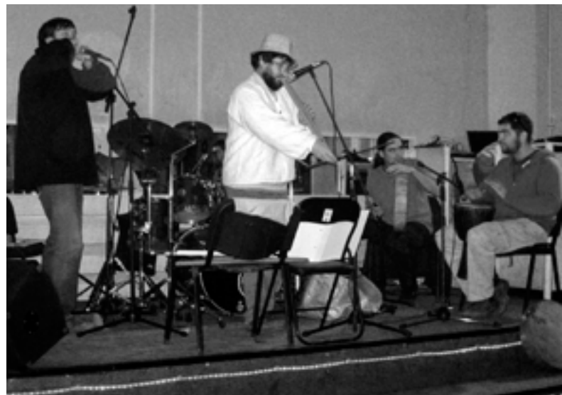
AZ ÖRDÖGFŰ ZENEKAR A VÖRÖSISZAP KÁROSULTJAIÉRT JÓTÉKONYSÁGI ESTEN AZ IFJÚSÁGI HÁZBAN

LÖSZ Kulturális Fesztivál, Hódstock Fesztivál- és Tehetségkutató, Karácsonyi Lidércnyomás, Szittya Népi Est, Sör-Filmek-Sültkrumpli-filmes est, Rimfaragók Éjszakája, Jótékonyági Est a vörösiszap károsultjaiért az Ifjúsági Házal összefogva. Segítünk a Kéktói Fesztivál, Fehér Tó Napja vagy éppen a Tanyasi Tízpróba Barátságprogram ban, és persze számos más eseményen is ott a kezjegyünk. Bemutatkoztunk már Nagytályán a Dereglye Fesztiválon is, ahová vásárhelyi programokat vittünk. A Ramsári túra és