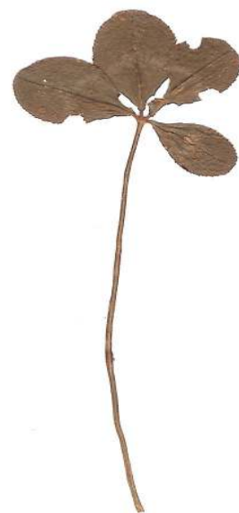
A SZERENCSET HOZÓ SZIBÉRIAI LÓHERE

Én aztán meguntam és december 13-án kimentem a városba, munkát kaptam, és hozzá fogtam dolgozni. A mester nagyon megszerette a munkámat, és elég jó helyem volt. Egyszer csak üzennek, hogy menjek a barakkba, mert megyünk el Novo-Nikolajevszk felé. Én azt mondtam, hacsak fegyveresen nem jönnek a