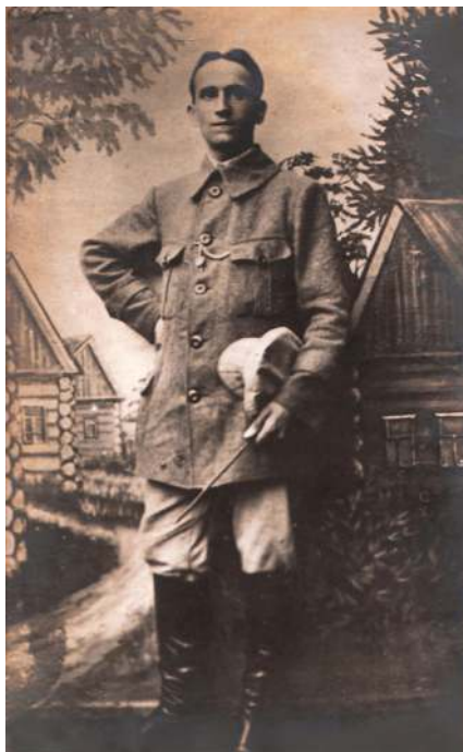
A FOGSÁG IDEJÉN BOROVICHIBEN Mútermi fotó - 1917

volt. A felszerelést nem volt szabad leszedni [letenni]. Már éjjel hallottuk az ágyúk dübörgését. Reggelre óriási köd ereszkedett [le], kiadták a parancsot, hogy felkészülni és útnak indulunk. Már tudtuk, hogy a harc vonalba megyünk. Ami nem volt szükséges, mindent kihajigáltunk a torniszterből [katonai háizsákból], hogy könnyebb legyen. Megittuk még a kávé és elindultunk Rohatyn irányába. 10 óra tájban egy faluhoz értünk, itt meg akarunk ebédelni, de a konyhánk már elveszett. Azt mondta a főhadnagy úr, hogy «akinek van, az egyék, akinek nincs, az éhen megy a halálba». Rövid raszt [pihenés] után rajvonásban elindultunk. Nagyon nehéz volt a fölvonulás, mert az oroszok óriási ágyútüzet adtak. Én a balszárnyon harcoltam. Mindig előre, előre, előre... Már a jobb szárny majdnem visszavonult, [de] mi még akkor is előre mentünk az ellenséghez, amikor a mieink azt avizálták [jelezték, parancsolták], hogy kerdőj [fordulj] gyorsan visszafelé. Mikor mentünk visszafelé, az oroszok, akik még jobban balra voltak mint mi, megláttak bennünket és két tűz közé szorítottak, és ott én is foglyul estem.