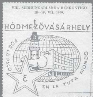
AZ 1959-ES ESZPERANTÓ KONFERENCIA TISZTELETÉRE KIADOTT BÉLYEG

A mikor bélyegeket említünk, szinte mindannyian a postabélyegekre gondolunk, pedig a XIX-XXI. század számtalan más bélyeg típus kiadásával örököltette meg korának kiemelkedőnek ítélt eseményeit, érdekességeit, számtalan területen használtak bélyegeket egészen eltérő célokkal, s tesz az egészen napjainkig.