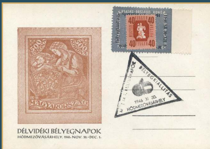
AZ 1946-BAN RENDEZETT BÉLYEGKIÁLLÍTÁS EMLÉKLAPJA