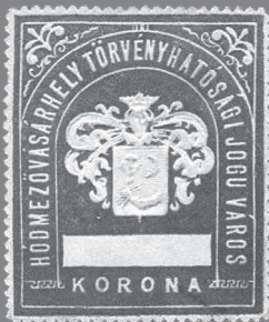
1929-BEN KIADOTT, DOMBORNOMÁSOS, VÁROSI OKIRATI ILLETÉKBÉLYEG