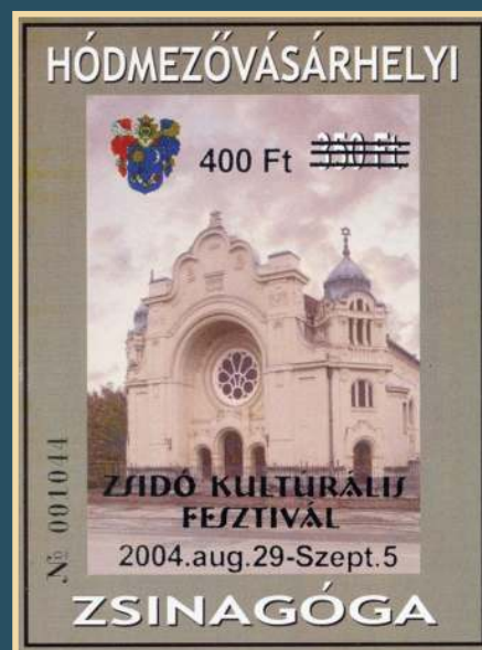
A FELÚJÍTOTT ZSINAGÓGÁRÓL KIADOTT EMLÉKVÍV ÉS ANNAK 2004-BEN FELÜLNOMOTT VÁLTOZATA