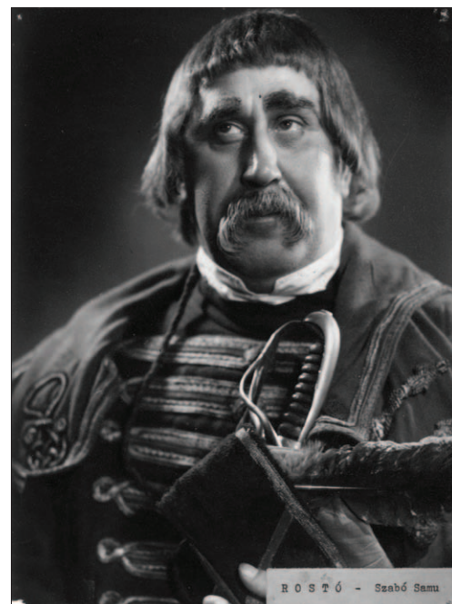
SZABÓ SAMU SZÍNműVÉSZ (Hódmezővásárhely, 1903. április 8. – Pécs, 1966. november 22.)

110. születésnapja volt a Kossuth-díjas színésznek, aki itt végezte tanulmányait a gimnáziumban, itt lépett először színpadra 1919-ben, a Nyári Színkörben. 1925-től 1927-ig a szege-di, majd egyéb vidéki színházakban is szerepelt. Pár évig Debrecenben is játszott. 1949-től haláláig a Pécsi Nemzeti Színház tagja. Számtalan szerepben játszott, 1954-ben Kossuth-díjat kapott. Anna utcai háza falán 2000-ben emléktáblát avattak.