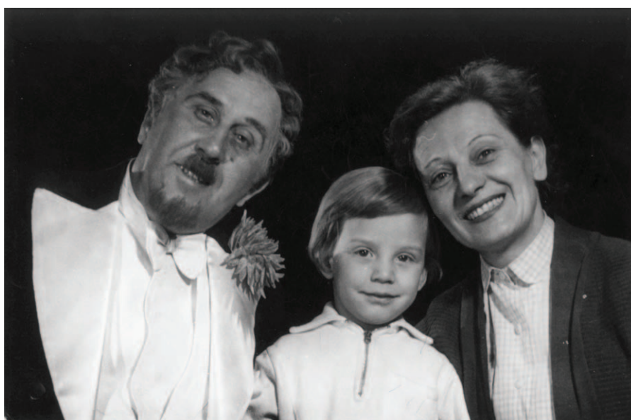
SZABÓ SAMU SZÍNműVÉSZ — SZEREPEIBEN, FELESÉGÉVEL, ARANY KATÓVAL ÉS KISFIUKKAL, TIBORRAL

Apámnak, Szabó Tibornak kicsit terhes volt apja nagy népszerűsége, mindig azzal küldték el ügyeket intézni: mondd, hogy a Szabó Samu fia vagy! Ez a varázsige megnyitott előtte minden ajtót. Ma már kevesen élnek azok közül, akik személyesen ismerték, de az a néhány ember, aki emlékszik, még mindig felcsillanó szemmel beszél róla. Művészetével mély benyomást tett az emberekre, nyomot hagyott az őt ismerők lelkében.