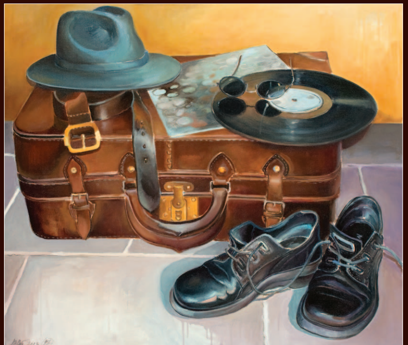
ZOLTAI ATTILA: A VILÁGUTAZÓ BŐRÖND TITKAI (2013)