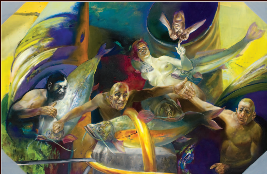
KÉRI LÁSZLÓ: BUKOLIKUS FESTMÉNY AZ ÉRINTÉSEKRŐL (2013)