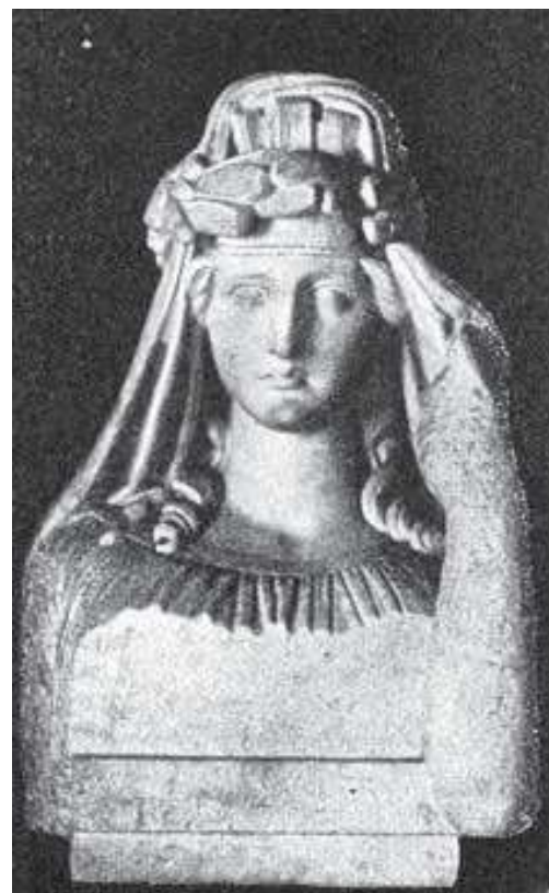
FERENCZY ISTVÁN | BÖLCS PANNONIA | 1825 KÖRÜL

A XIX. századi képzőművészettel kapcsolatos megnyilvánulások fogalomhasználata az illusztrált lapok vizsgálatával körvonalazható. A 1854 és 1921 között megjelenő Vasárnapi Újság hasábjain a legtöbb esetben a Pannónia elnevezést használták, ritka kivételként a Jauner Ferenc műhelyében kivitelezett, álló Hungariát bemutató Széchenyi-billikom leírása említhető. 3 A példák közül kiemelkedik az 1881. május 23-án rendezett bukaresti koronázási menet részletekbe menő ismertetése. 4 A „magyar társulat szekere” a különböző társadalmi osztályok képviselőinek kíséretében vonult fel, közepén a sodronyvértben, bő fehér szoknyában, címerpajzsral és pallossal trónoló Pannóniával. Ebben az esetben nem egy írásos programmal vagy művészi leírással megjelenő perszónifikációról van szó, így a Pannonia-névválasztás teljes mértékben a beszámoló írójának sajátos döntését tükrözi. A kortárs karikatúrák és azok szövegi kontextusának vizsgálatakor szintén ez az elnevezés látszik a leggyakoribbnak: a Pannónia név következetes használatára a Jókai Mór által szerkesztett Az Űstökös képei mutatnak bizonyítékot.