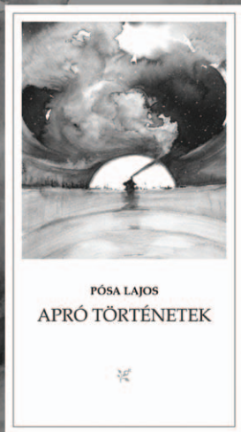
PÓSA LAJOS Apró történetek Bp., Siker K., 2014. 88 p.