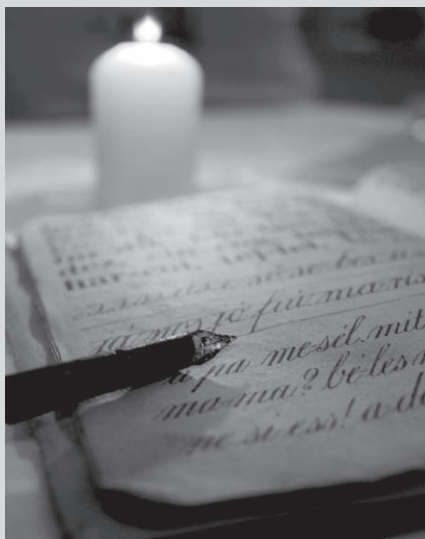
GAÁL GYÖRGYI: NAGYAPÁM FÜZETE

S mint kit az édes anyja vert meg, Kisírt, szegény, elfáradt gyermek, Úgy alszom el örökre.