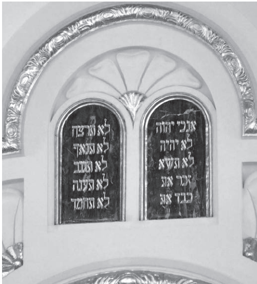
TÍZPARANCSOLAT A FRIGYSZEKRÉNY FELETT

Ez a belépés azonban különbözött a korábbiaktól: a felújított zsinagóga falai közé léptünk be.