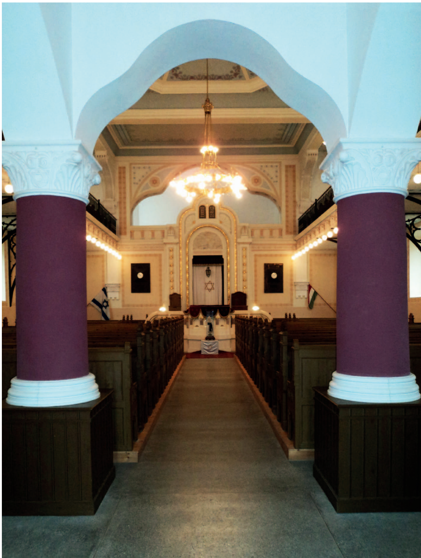
A VÁSÁRHELYI ZSINAGÓGA BELSŐ TERE