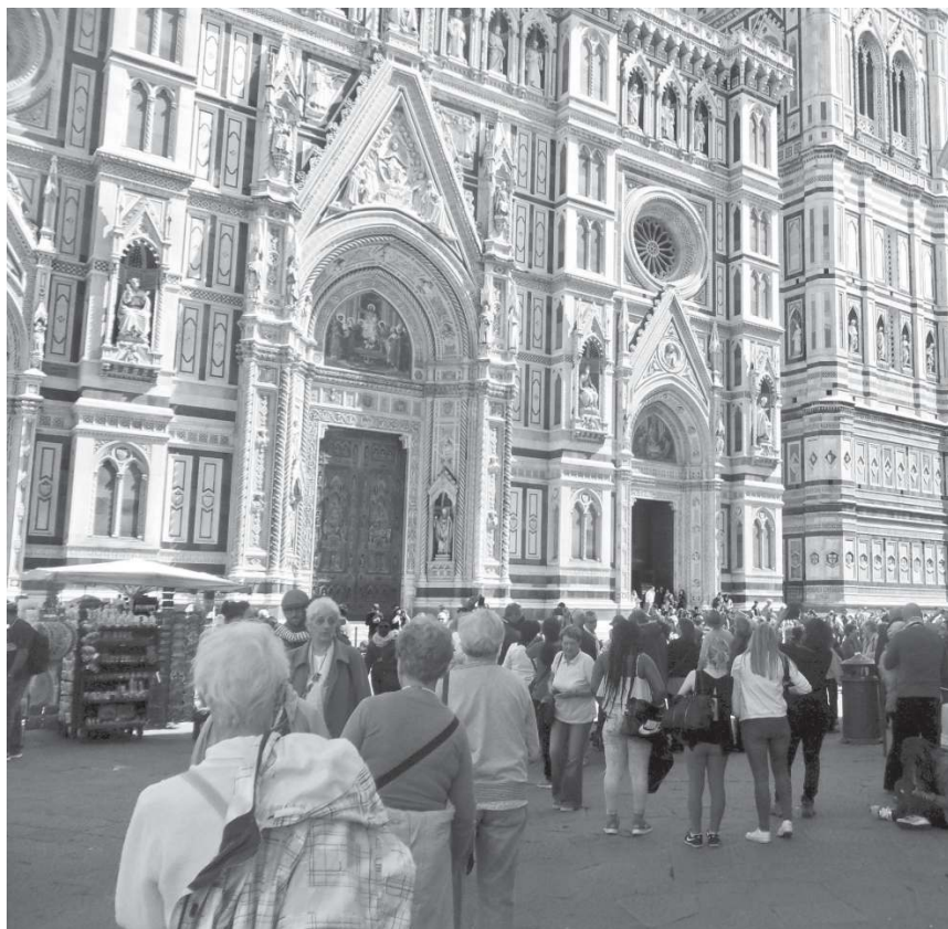
A FIRENZEI DÓM ELŐTT 2016 TAVASZÁN