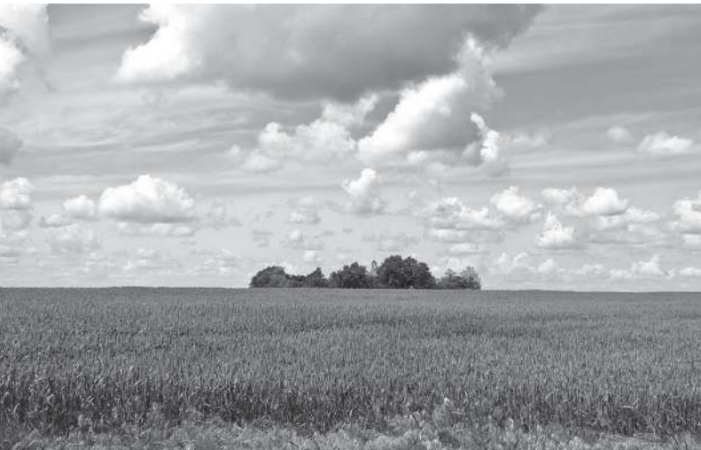
KOPÁNCSI TEMPLOM A PUSZTA KÖZEPÉN

A hódmezővásárhelyi Art.Pagony Művészettörténeti Önképzőkör néhány külső, érdeklődő taggal kiegészülve 29 fővel tett autós kirándulást szeptember 25-én, vasárnap Békés és főképp Csongrád megye rejtett, ám annál izgalmasabb, kulturális jelentőségű helyein azzal a céllal, hogy miután a csoport tíz esztendeje rendszeresen több napot kirándul a történelmi Magyarország és Európa kulturális fellegráiban, ezúttal a szűkebb környezetében is fölfedezze a figyelemreméltó látnivalókat.