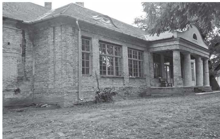
A NÁVAY-KASTÉLY GENCSHÁTON

Szintén az apátfalvi úttól nem messze, egy lucernaföldön a Kun-keresztre leltünk, melyet egy szélőtől kicsavart és rossz irányba mutató tábla jelzett csupán. A kőkereszt egy nagyjából három méteres gneiszt feszület, amiből egy méter a föld alatt található. Számos helyi legenda fűződik a kereszthez, ami nagyjából 500 éves és általában Dózsa Györggyel hozzák összefüggésbe (kép az 5. oldalon).