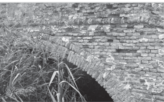
A TÖRÖK-HÍD BÉKÉSSÁMSON HATÁRÁBAN

Sokéves várakozásnak tettünk eleget, amikor Békéssámson határában fölkerestük, és a lehetőségekhez mérten szemügyre vettük a Száraz-ér fölött ívelő, vitatott eredetű, náddal sűrűn benőtt Török-hidat.