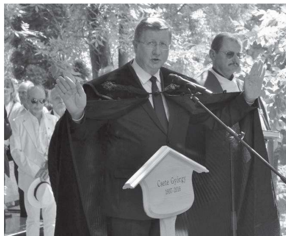
2016. július 18-án, Budán, a Farkasréti temetőben püspöki és papi áldással elbúcsúztunk tőle.

Csönd és fájdalom. Átléptél a küszöbön, de Te vársz reám.