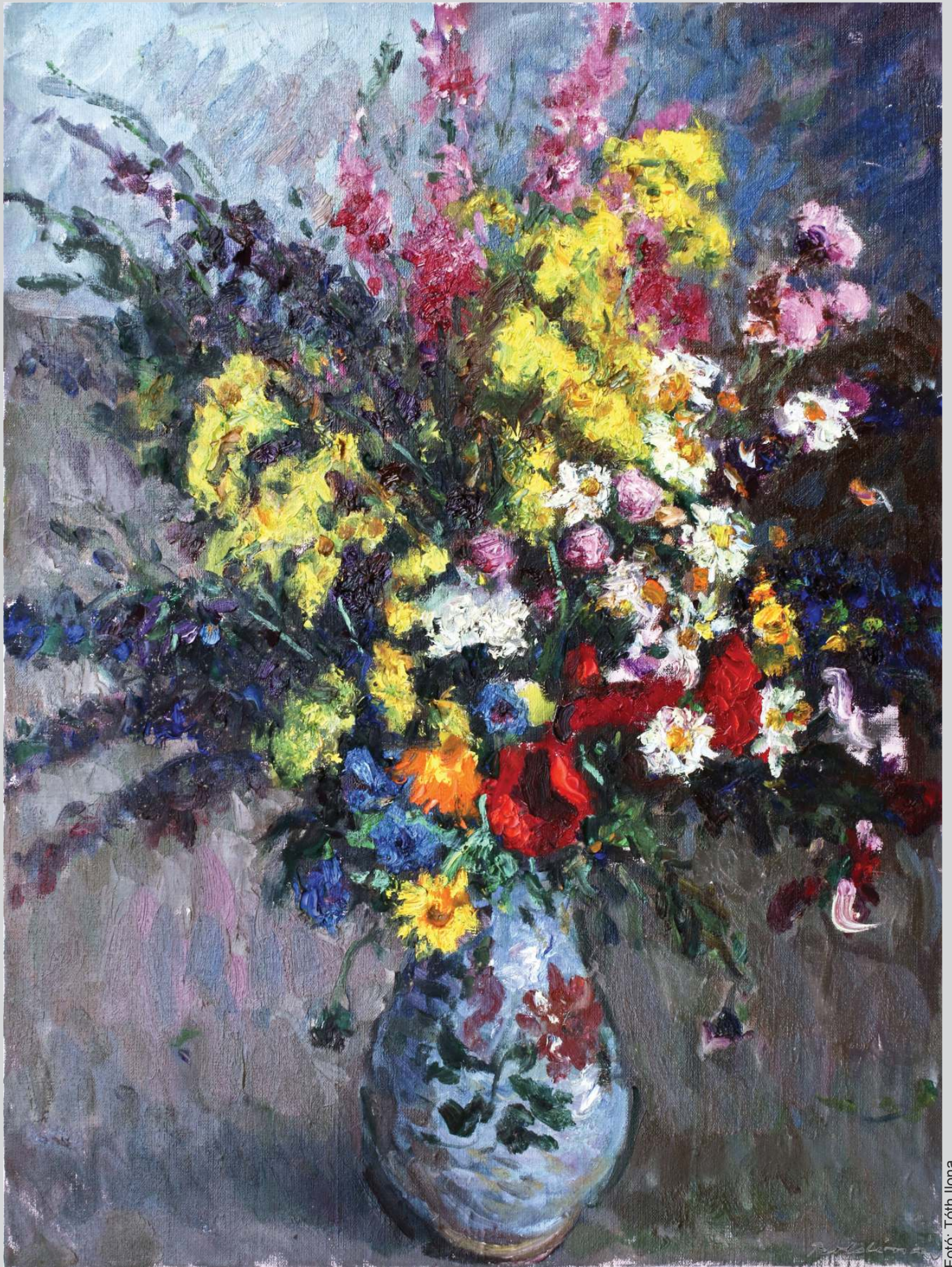
BOLDIZSÁR ISTVÁN: CSENDÉLET (OLAJ)