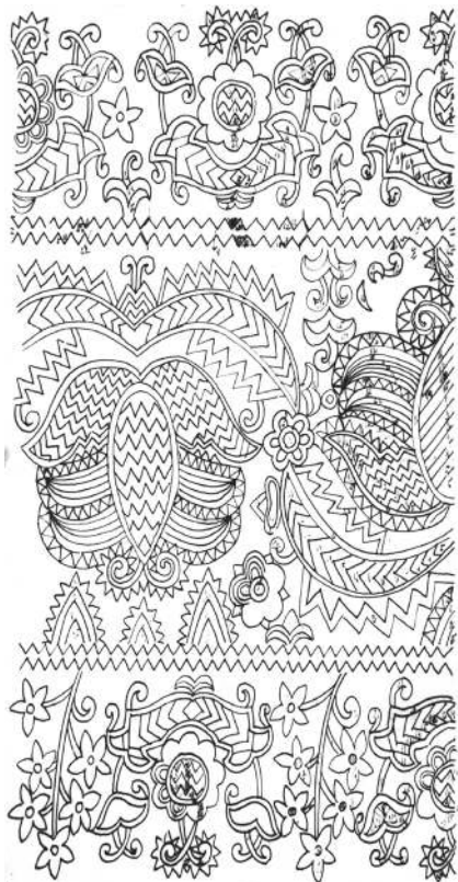
1. KÉP HOSSZÚ-GRÁNÁTALMÁS MINTA RÉSZLET

A vásárhelyi hímzés közismert motívumai mellett található kis összekötő minták sok mindent elárulnak, még arról is, hogyan születtek a párnaminták lépésről lépésre.