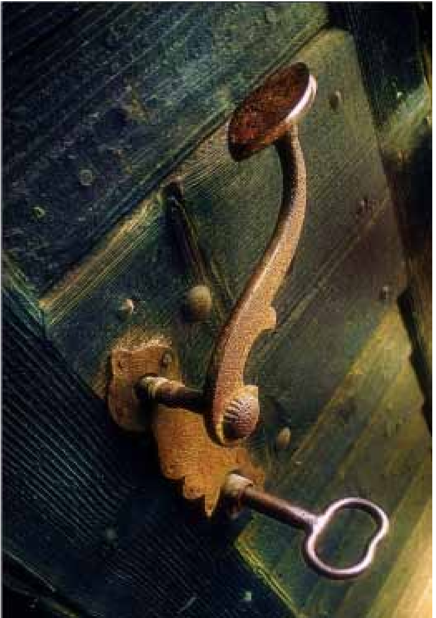
BÉCSI IMRE: RÉGI IDŐK LENYOMATAI (NO.2) XIV. VÁSÁRHELYI FOTÓSZIMPÓZIUM, 2017