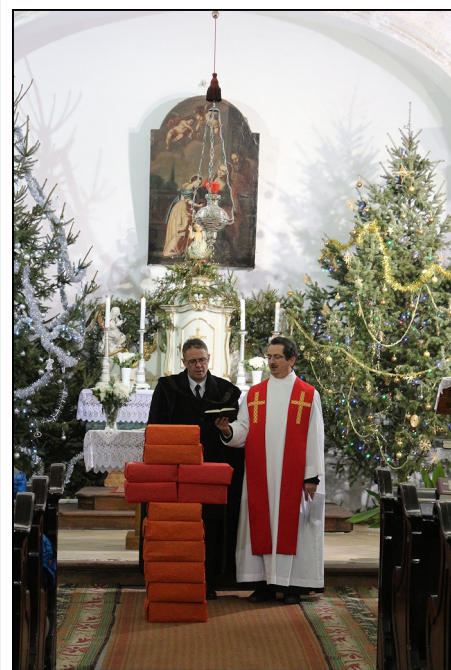
Ökumenikus istentisztelet

Az ökumenikus imahéten hálaadással emlékeztek világszerte a berlini fal lebontásának 25 éves évfordulójáról. Ennek kapcsán a bennünk és egymás közt lévő „falak”-ról sok szó esett.