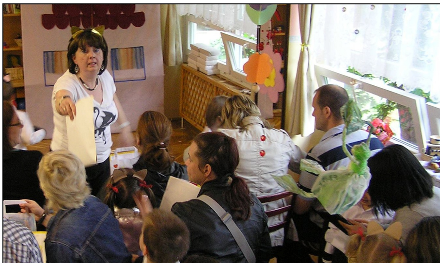
Nagyesportosok óvodai évzárója 2013-ban

Ha megnézek egy csillogó szemű gyereket, akkor látom, hogy annak