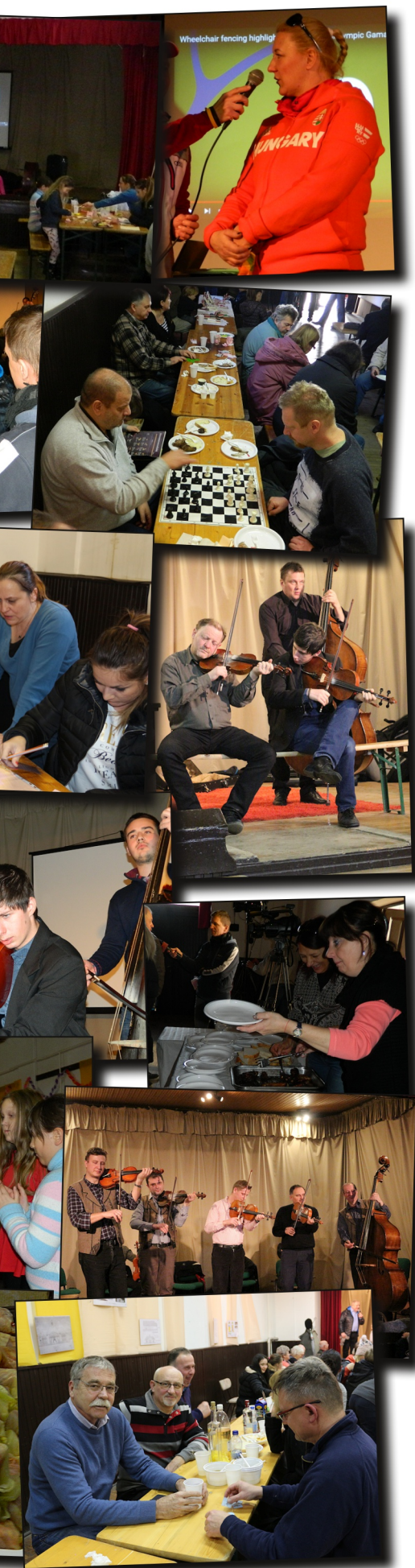
Disznói Disznótör képei