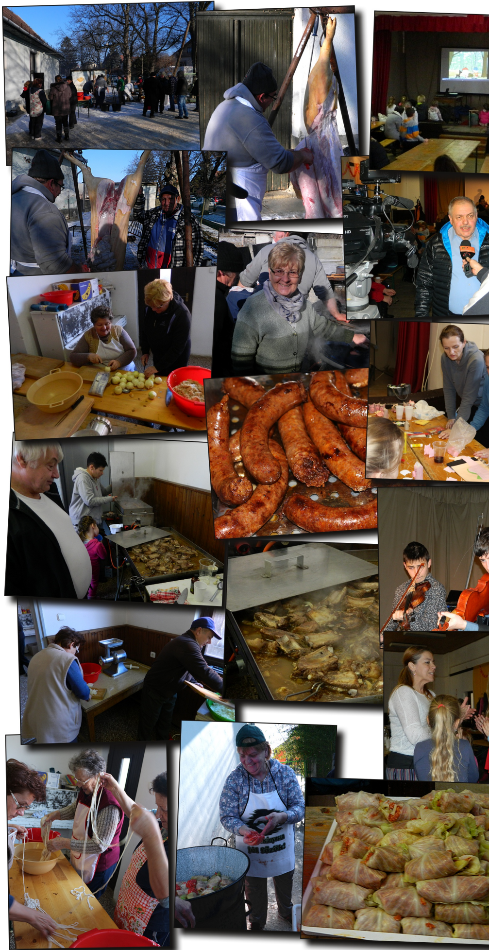
A II. Tinnyei Kö