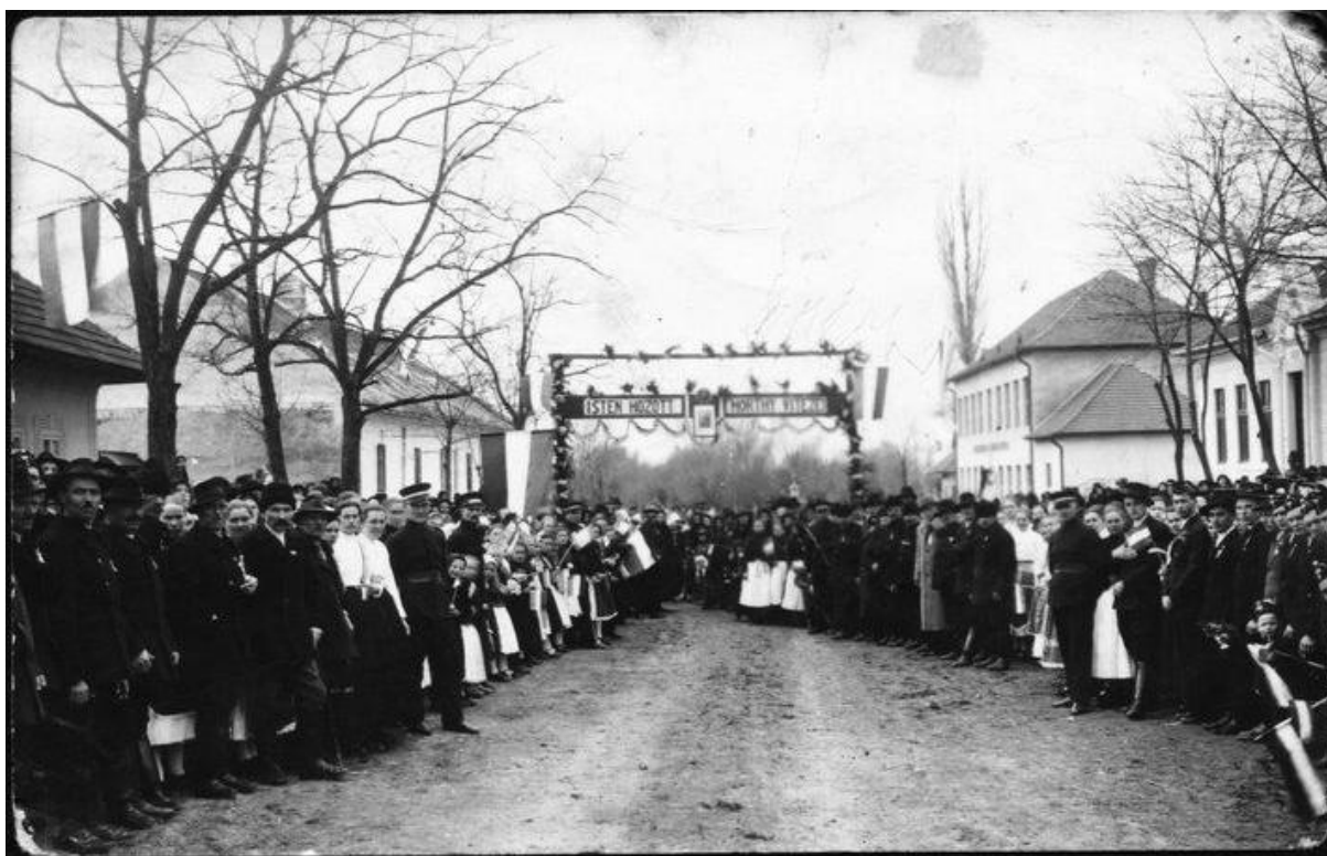
A nagycétényi bevonulási fogadóünnepség 1939 (Nagycétényi Önkormányzat)