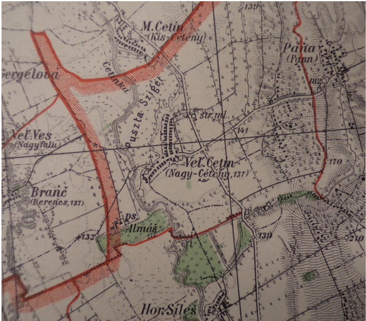
Nagycétény katasztere a visszacsatolás után