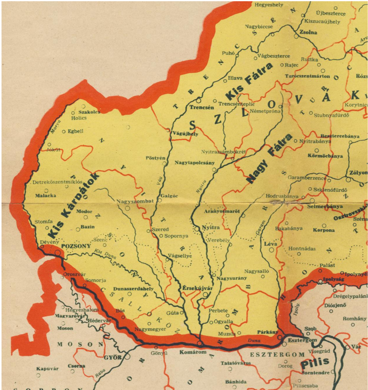
Az ezeréves magyar Felvidék – részlet (A Pesti Hírlap ajándéka)