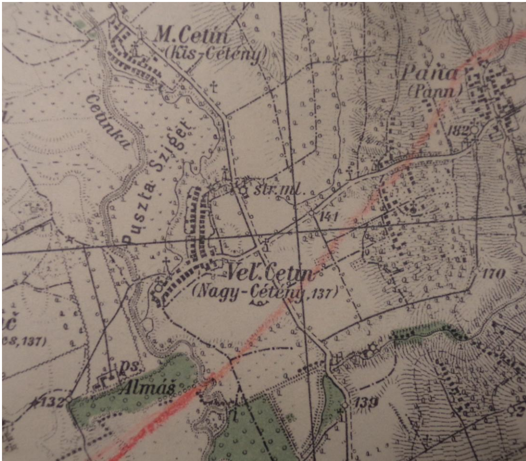
Térképészlet az első bécsi döntés határvonalával (ŠA Nitra)