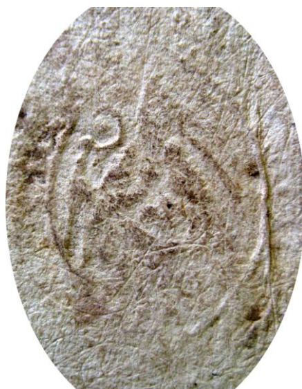
Nagycétény pecsétje 1706-ból

rendszerűtlen megjelenésű elektronikus történeti folyóirat