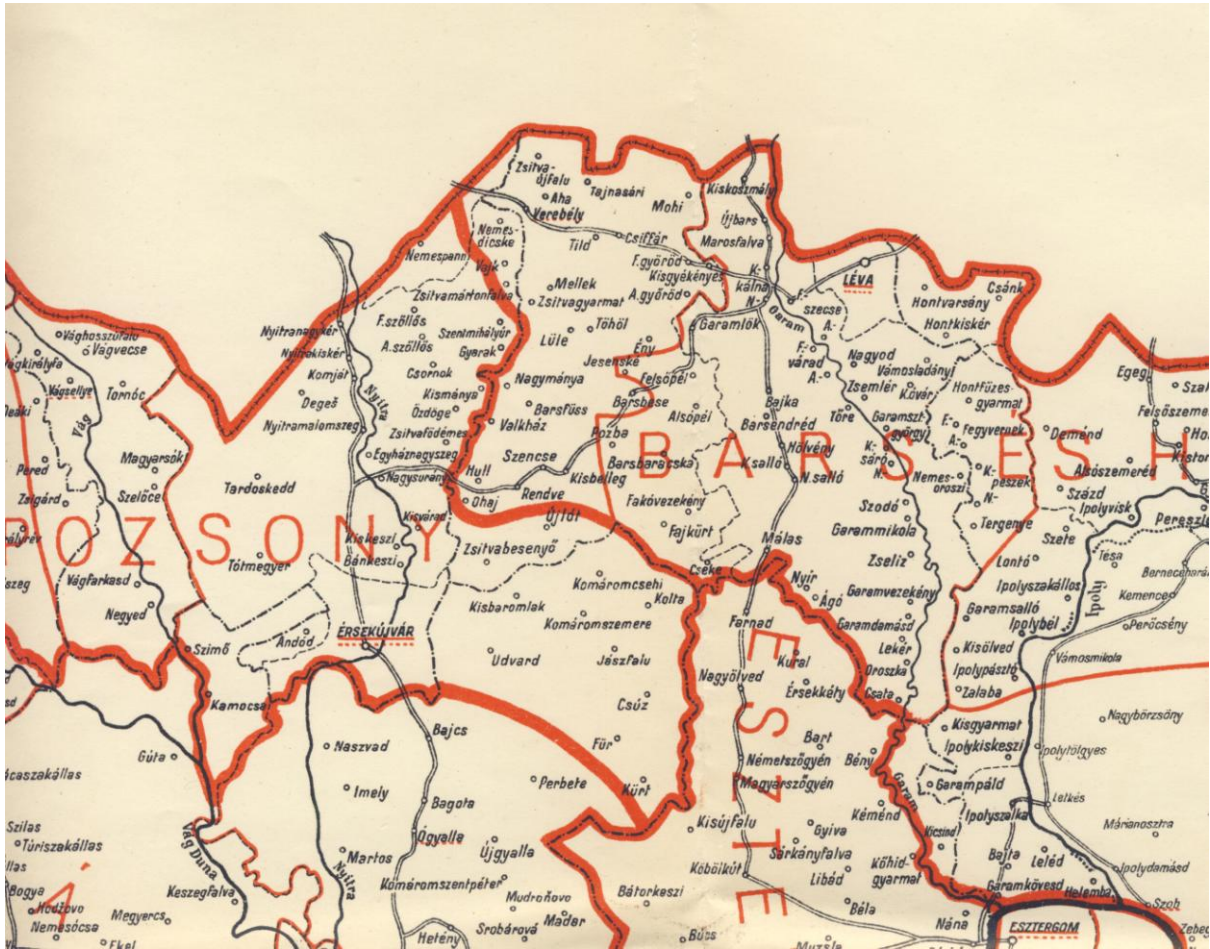
Észak-Magyarország térképe (1938) - részlet

Északi határa: Az 1938. nov. hó 5-én megállapított katonai demarkációs vonal.