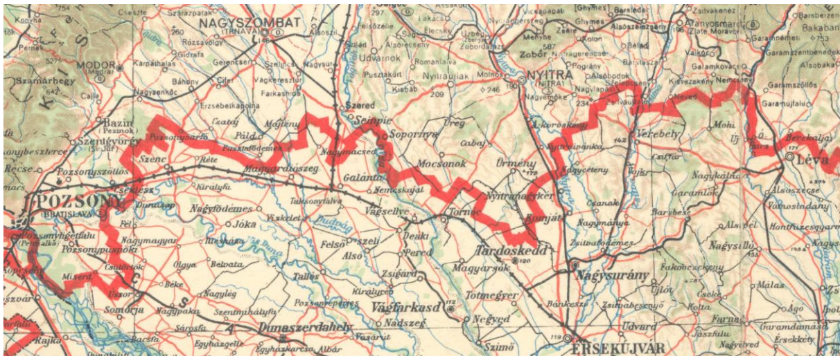
Magyarország térképe 1940 – részlet