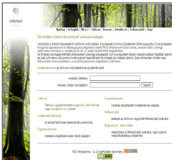
7. ábra A Doktori disszertációk archívum nyitóoldala

Az archívumok mellett OAI szerver működik, amely lekérdezésre XML formátumban szolgáltatja a metaadatokat. A szerver megléte kiemelt jelentőségű; a hazai adattárak között még kevés helyen található szabványos metaadat-szolgáltatást, ami pedig sokféle együttműködés alapjává válhatna.