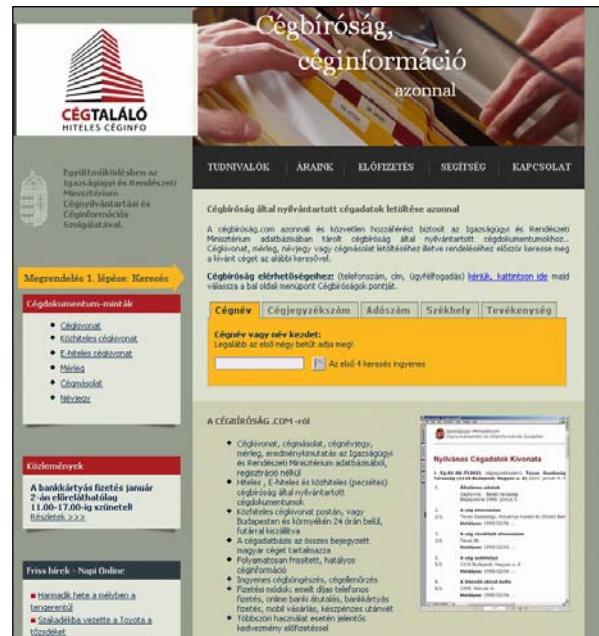
12. ábra A www.cegbirosag.com honlap, amely szinte megegyezik a CégTaláló főoldalával

A Voxinfo Kft. céginformációs tevékenységéhez több doménnevet is regisztrált, így például a www.cegtalalo.hu oldallal szinte azonos honlapok találhatóak a cegjegyzek.com és a cegbirosag.com címen. Ezen kívül a cegtalalo.hu -tól eltérő külsejű oldalak is rendelkezésre állnak az ügyfelek számára: a cegfurkesz.hu , a melyikcegmtitsinal.hu és az adoszam.hu címeiken (11., 12. ábra).