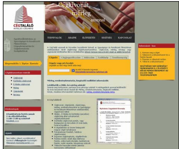
11. ábra A CégTaláló főoldala