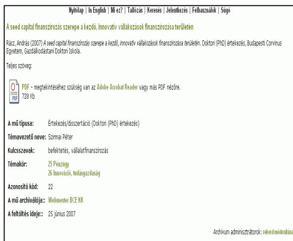
10. ábra Egy doktori disszertáció adatlapja