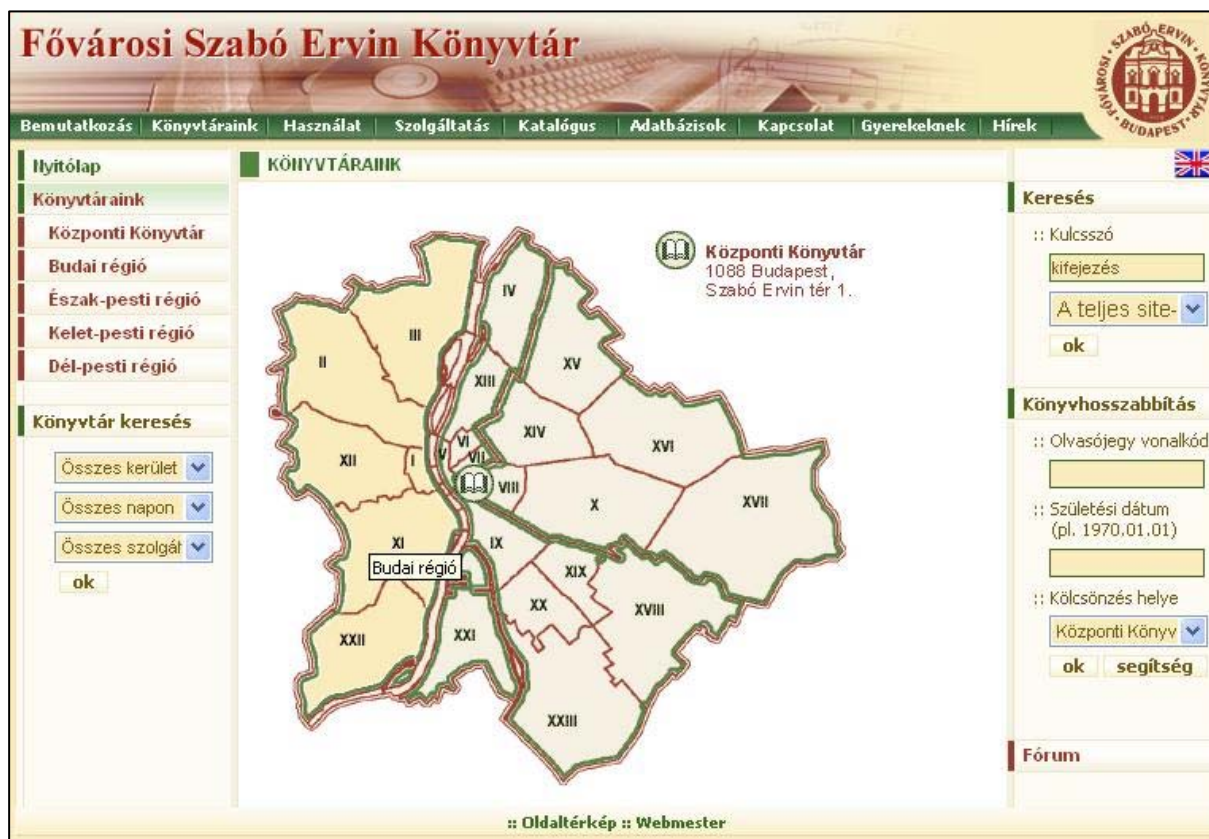
1. ábra A FSZEK honlapja

A szerkesztésnél követjük a Magyar Vakok és Gyengénlátók Országos Szövetsége által közzétett útmutatókat, a World Wide Web konzorcium (W3C) ajánlásait, és a különböző szakmai weboldalakon [3] található információkat, szerkesztési útmutatókat. Ezek mellett is fontosnak tartottuk, hogy e használói réteg számára egy külön menüpontot is létrehozzunk.