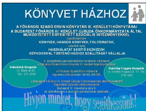
4. ábra A „Könyvet házhoz” program plakátja

A szolgáltatást nyújtó könyvtárak elérhetősége megtalálható a könyvtár honlapján, de szórólapok, plakátok, a kerületi médiákban megjelenő híradások, tájékoztatók segítségével is igyekszünk eljuttatni az információt (4. ábra).