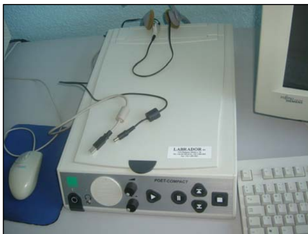
6. ábra Felolvasógép

Az előző fejezetben már említett pályázati támogatásból a lőrinci könyvtárban is üzembe helyeztünk egy számítógépet a JAWS for Windows magyar nyelvű képernyőolvasó szoftverrel, valamint egy speciális, ún. Poet-Compact berendezést (6. ábra). A német Baum cég által készített felolvasógép tulajdonképpen egy számítógéppel egybeépített (A/4 méretű) szkennert, Windows2000 operációs rendszerrel, optikai karakterfelismerő programmal, felolvasószoftverrel. Kezelőfelülete nagyon egyszerű, nem igényel számítógépes ismereteket, magyarul, angolul, és installálástól függően akár németül is beszél. Alkalmos bármilyen nyomtatott szöveg felolvasására, beállítható a hang minősége. Az egyszer már felolvasott szöveget el tudja tárolni, a tárolt szöveges formátumok pendrive-ra menthetők.