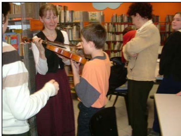
8. ábra Gyermekfoglalkozás a Lőrinci Nagykönyvtárban