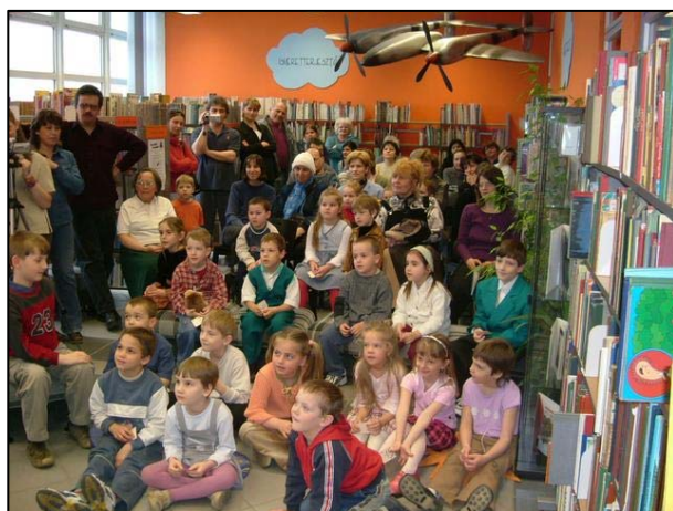
9. ábra Versmondó verseny

sokkal. A gyerekekben tudatosult, hogy a könyvtárba bármikor jöhetnek, mert itt szívesen látjuk őket, ez egy olyan elfogadó környezet, ahol biztonságban vannak. Bennük szerencsére még nem alakultak ki „berögződések”, így a legtermészetesebb módon rajzolt, játszott, dalolt, „kézműveskedett” együtt ép és fogyatékkal élő. A versmondó versenyen lehetett a legjobban érzékelni, hogy milyen erővel tudtak drukkolni egymásnak. Magam is sokat tanultam, tapasztaltam a programok alatt. Emberséget, toleranciát, szeretetet, a másság elfogadását, és újból megerősödött bennem az a gondolat, hogy mindenkire szükség van, az élet így teljes.