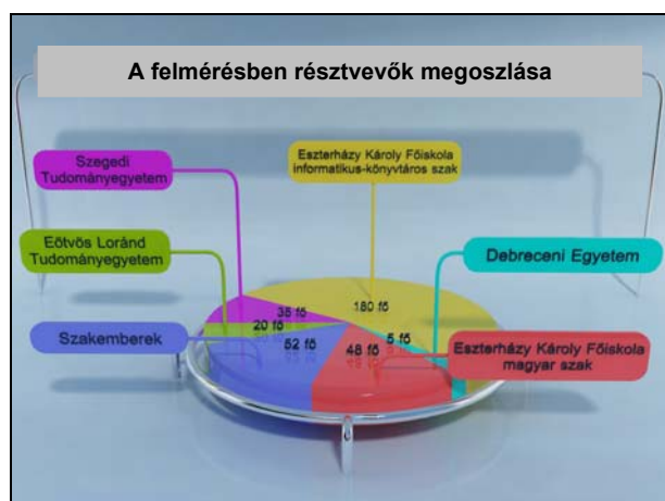
2. ábra A felmérésben résztvevők megoszlása

Végezetül a felmérésben a 2. ábrán látható összetétellel vettek részt a kitöltők: