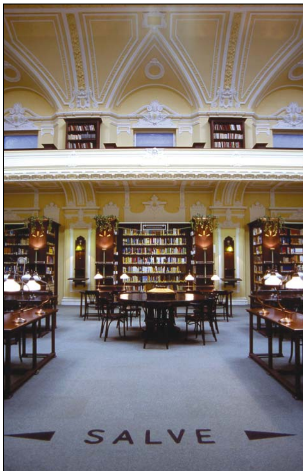
1. ábra A könyvtár olvasóterme

A Katholikus Kör 1947-ig működött, számos esemény, jeles rendezvény zajlott falai között. A háború alatt az épület egy része bombatalálatot kapott, majd 1948-tól 56-ig az Állami Hangversenyzenekar és a Budapesti Kórus székhelye volt, később lefokozódott díszletraktárrá.