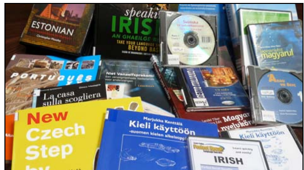
5. ábra A nyelvstúdió állományából

Az OIK nyelvstúdiójában 84 nyelv tanulásához található anyagot a látogató (5. ábra). Nyelvoktató dokumentumaink közül – használat szempontjából – a kölcsönözhető nyelvkönyvek és nyelvkönyvcsomagok állnak az érdeklődés élén. A helyben használat is jelentős, hiszen a kézikönyvek, az interaktív nyelvtanító CD-ROM-ok, és egyes nyelvkönyvek is csak helyben használhatók. 2009-ben 28 nyelvet tanultak nyelvstúdióunkban, ennek keretében 655 órát töltöttek nálunk, s ez alatt 1099 dokumentumot használtak.