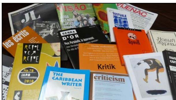
3/b ábra Periodikák 2.

Az OIK Zeneműtára gyűjtemény a gyűjteményben: 1994-ig különálló épületben, a Városligeti (korábban: Gorkij) Fasorban volt elérhető. Az épület privatizálása után az OIK épületének félemeletén