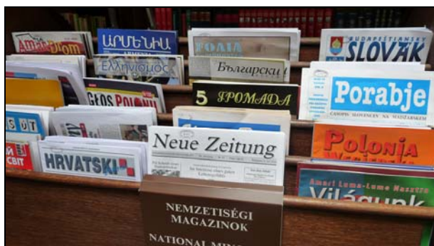
3/a ábra Periodikák 1.

anyag legnagyobb része könyv, de egyre inkább előtérbe kerülnek modern hordozókon tárolt dokumentumok. A korábbi időkből származó magnó-kazettákat igyekszünk CD-kel helyettesíteni, az arra érdemeseket pedig gondos mérlegelés után digitalizálni. Az olvasói igényekhez igazodva egyre több hangoskönyvet és DVD-t vásárolunk. Számos intézménnyel, szervezettel állunk kapcsolatban, némelyiktől rendszeresen kapunk ajándékokat. Ilyenek például a Goethe Intézet, a Lengyel Intézet, az Andrew Nurnberg Irodalmi Ügynökség. Állandó cserepartnerünk a Lengyel Nemzeti Könyvtár és a Deutsche Forschungsgemeinschaft. A 2010. év eredményéből érdemes megemlítenünk a Brazil Szövetségi Köztársaság kormányának igen értékes, 240 dokumentumból álló portugál nyelvű ajándékát. Az ajándékok és a hagyatékok fogadásánál fenntartjuk a válogatás jogát, s ezt ajándékozóink tiszteletben is tartják. A kötelesepéldányok válogatása is fontos beszerzési forrásunk, igaz ugyan, hogy főleg magyar nyelvű dokumentumokat tudunk ilyen módon gyarapítani.