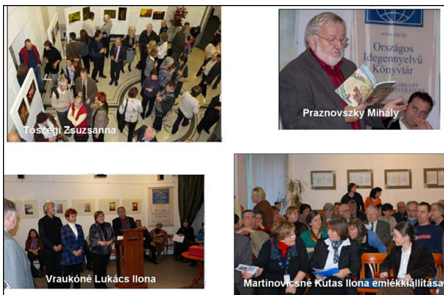
10. ábra Alkotó könyvtárosok

A rendezvénysorozatok közül kiemelésre méltó az Alkotó könyvtáros (10. ábra) (az MKE-vel közösen 2006 óta 11 alkalommal), az OIK Nyílt napja a Nyelvek Európai Napján (2011-ben már a hetedik), a Mulandóság és halhatatlanság (olyan kiválóságokkal, mint Géher István, Nádasdy Ádám, Kappanyos András és mások) valamint biblio-terápiás sorozatunk, a műKINCSvadászát , mely havi rendszerességgel jelentkezik.