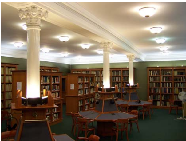
2. ábra A Zeneműtár

Komoly építészeti és szervezési feladatot jelentett a Zeneműtár befogadása a Molnár utcai központi székházba, amit a rendszerváltozást követő reprivatizáció kényszerített ki, és amely folyamatos belsőépítészeti átalakítások során nyerte el mai arculatát, vált különlegesen szép, egyedi, látványosságként is nevezetes zenei gyűjteménnyé (2. ábra).