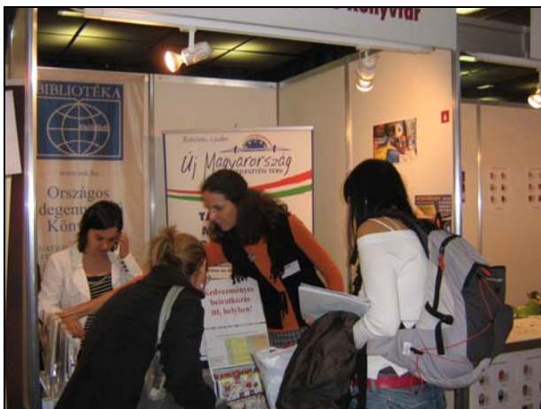
9. ábra A Millenárison

Az OIK nem csak várja, hogy a felhasználók megtalálják, hanem aktívan tesz is azért, hogy elérje a lehetséges olvasókat. Kollégáink számos rendezvényre „települtek ki”, hogy kedvezményes helyszíni beiratkozást ajánlva, szórólapokkal, prospektusokkal, egyéb reklámanyagokkal minél több emberrel ismertessék meg és népszerűsítsék az intézményt. (ELTE Könyvtári Nap két alkalommal, ELTE Bölcsész Napok, Bartók Béla Zeneművészeti Szakközépiskola és Gimnázium, Oktatás Hete, 2010. évi Nyelvpárádé, Európai Nyelvi Kóktélpár a Gödörben, Európa Pont megnyitója a Millenárison, 9. ábra.) Fontos az OIK egységes megjelenése a különféle propagandaanyagokon. Van magyar, angol, német és orosz nyelvű könyvtárismertető leporelló, hétféle szolgáltatásismertető szórólap (pl. az Akadálymentesen című fekete-fehér, jól olvasható), plakát, egységes meghívó, könyvjelző, toll, emblémás hőkötet mappá, a munkatársak két nyelvű névjegye és az „OIK – mert megérdemlem!” feliratú póló.