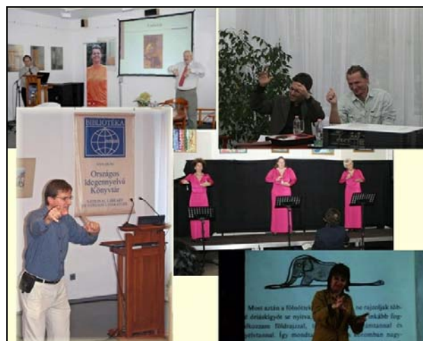
8. ábra A SINOSZ programjai az OIK-ban

Évek óta kiemelten fontos terület a fogyatékkal élők könyvtári ellátásának állandó javítása, vagyis az esélyteremtés, például a Siketek és Nagyothallók Országos Szövetségével együttműködésben (8. ábra).