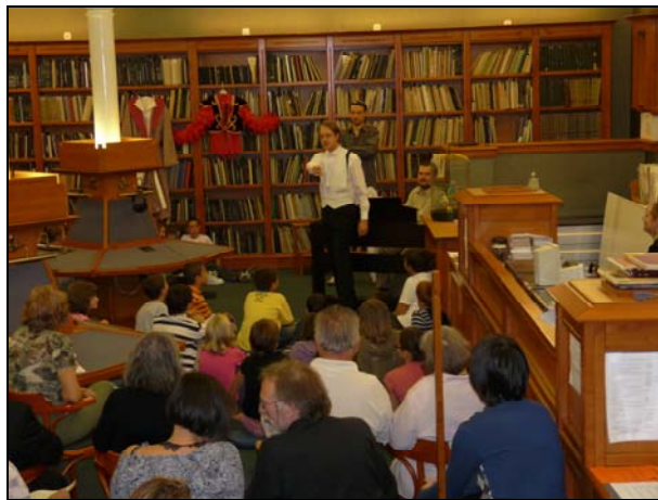
7. ábra Kulisszák mögött (nyílt óra a Zeneműtárban)

A Zeneműtár informális képzésként nyílt órákat szervez diákoknak, tanároknak és érdeklődőknek; például Mozart Varázsfuvola c. operájának áriáin keresztül betekintést nyerhettek az operaénekesek műhelymunkájába, másik alkalommal a zene születéséről és a zeneszerzői munka műhelytitkairól hallhattak (7. ábra).