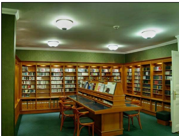
6. ábra CD-k és zenei folyóiratok

Zenehallgatásra 16 lehallgató hely áll az olvasók rendelkezésére, CD-t és bakelit lemezeket lehet hallgatni. A Zeneműtárban jelenleg két számítógépet használhatnak olvasóink, melyeken önállóan lehet zenét hallgatni, meg lehet nézni a Zeneműtár állományában lévő DVD-ket és ezekről a gépekről érhető el a könyvtár katalógusa, illetve az Oxford Music Online adatbázis. Minden beiratkozott olvasónk gyakorolhat a Yamaha típusú elektromos zongorán néma üzemmódban, fülhallgató segítségével véve igénybe a hangzás ellenőrzéséhez. A szabadpolcokon, tematikus rendben elhelyezett 30 ezres kottaállományból pedig élmény válogatni (6. ábra).