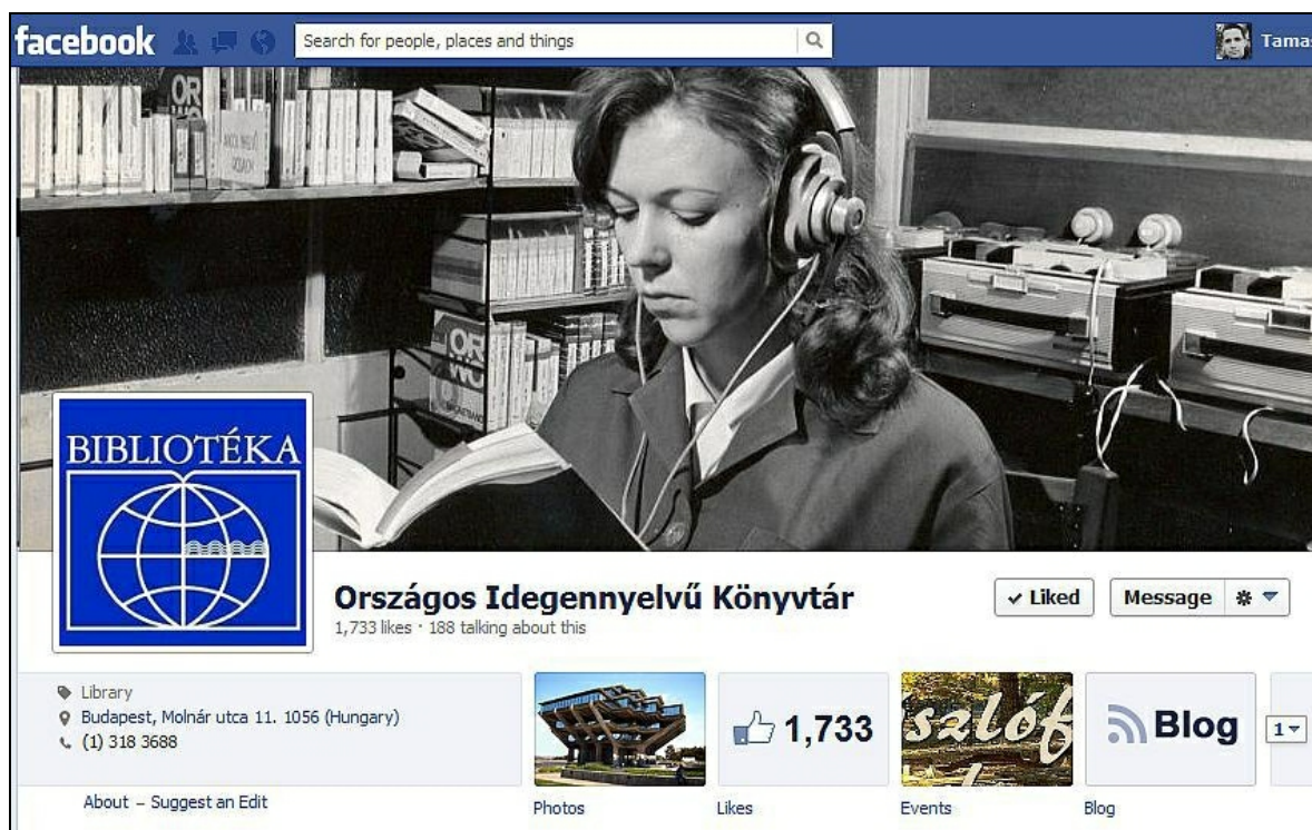
2. ábra Az OIK Facebook oldalának nyitóképe

Az Országos Idegennyelvű Könyvtárhoz jelenleg három Facebook oldal köthető. Egy általános, a teljes intézményt reprezentáló oldal [6], egy Zeneműtári Facebook oldal [7], amelyen zenei hírek, események, képek jelennek meg, és egy eszperantó témájú oldal [8], melyet a Fajsi Gyűjtemény gondoz. A továbbiakban a könyvtár általános oldaláról lesz szó.