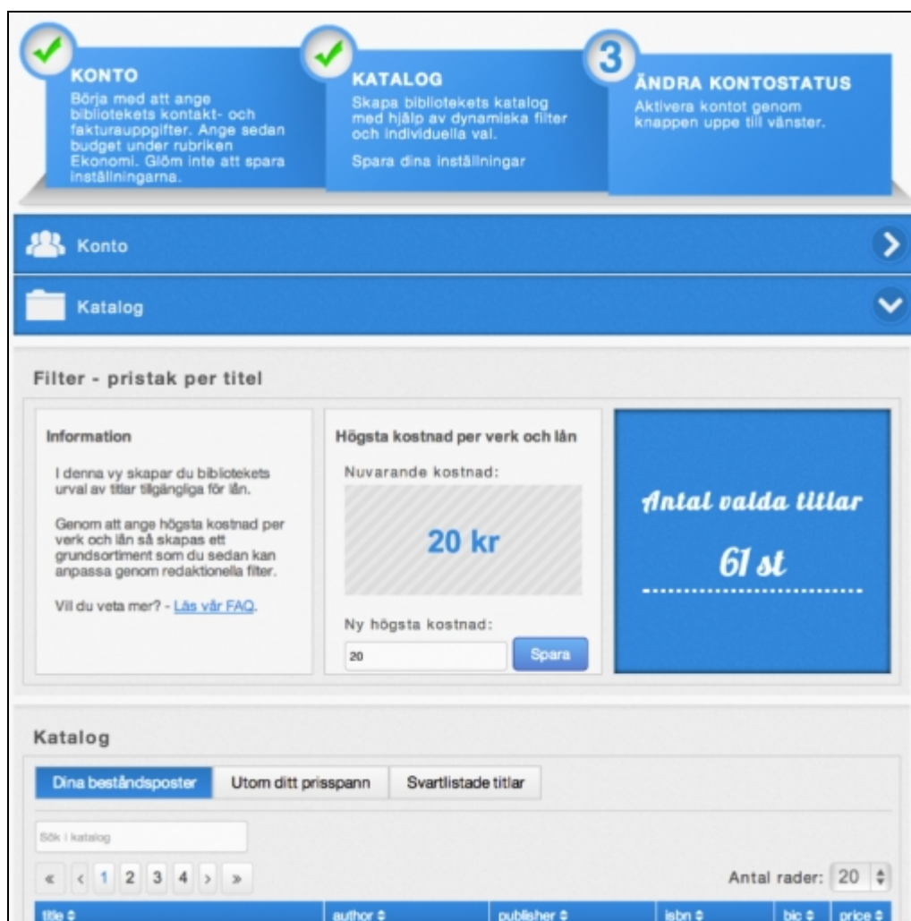
1. ábra Az Atingo eHUB felülete

Az ELDORADO egyik legfőbb erénye lehet, hogy infrastruktúrát szolgáltat a partnerkönyvtárak számára azáltal, hogy támogatja, illetve egységesíti a digitális másolatküldés folyamatait, beleértve a jogtisztázást.