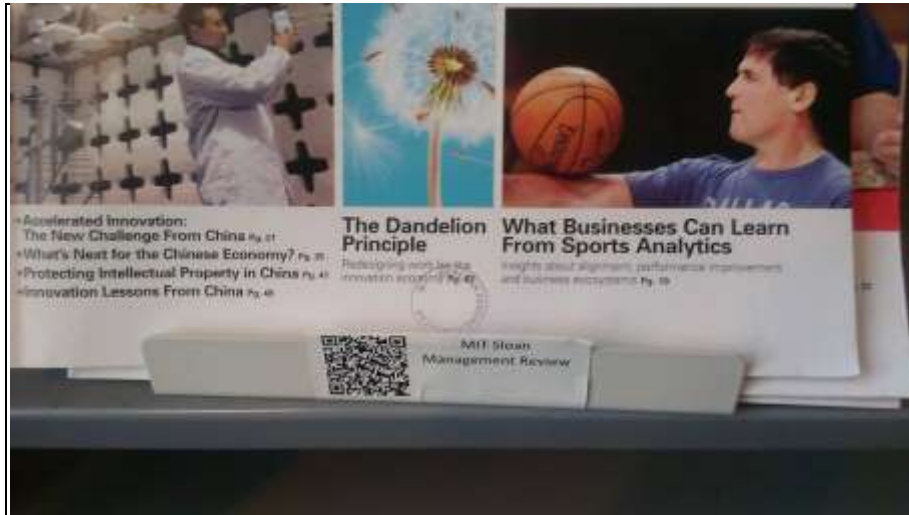
3. ábra A QR kód alkalmazása az időszaki kiadványoknál