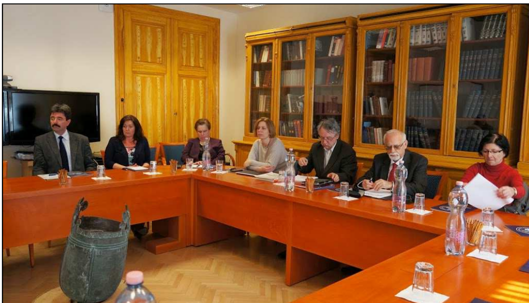
7. ábra A KIKK alakuló ülése