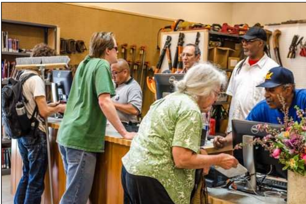
1. ábra: Eszközkölcsönzés a Berkeley Városi Könyvtárban