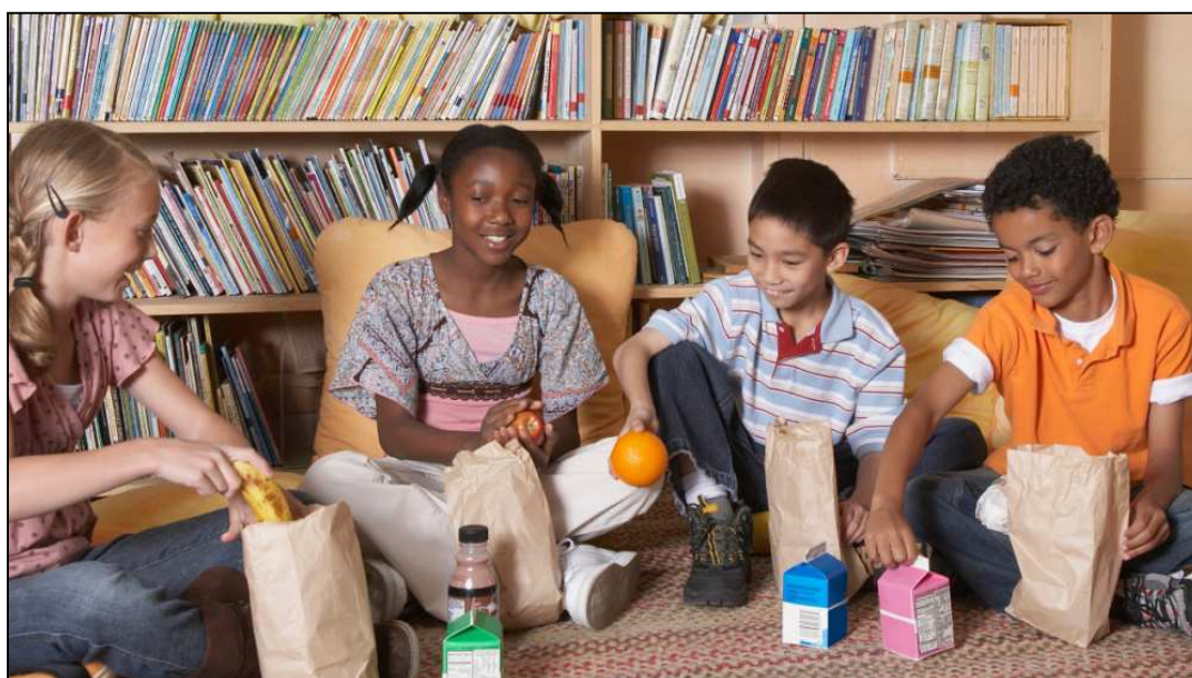
2. ábra: Gyermekek könyvtári étkeztetése Kaliforniában a Summer Food Service Program (SFSP) 11 keretében

https://www.berkeleypubliclibrary.org/sites/default/files/images/featured/rchrdfrdmn_d710713_sm.jpg?slideshow=true&slideshowAuto=false&slideshowSpeed=4000&speed=350&transition=fade