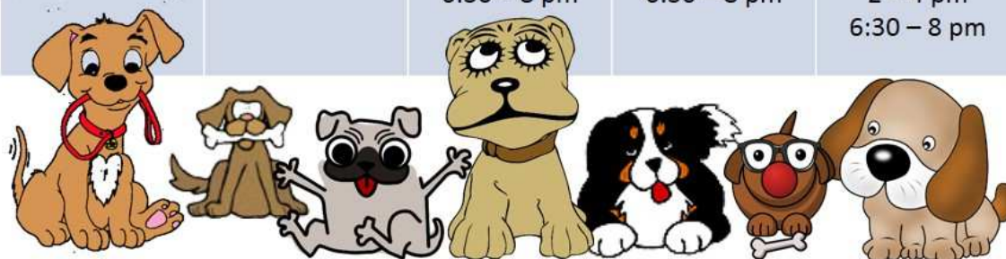
4. ábra: Terápiás kutyák az Ashlandi Egyetem Könyvtárában