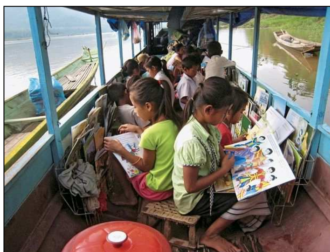
10. ábra: A Mekong és Ou folyókon úszó gyermekkönyvtár