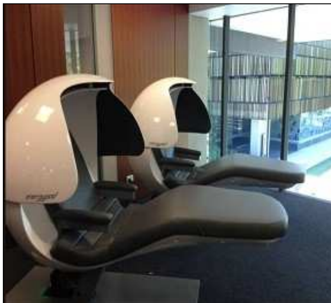
3. ábra: Relaxációs kapszulák a Queenslandi Egyetem Biológiai Gyűjteményében