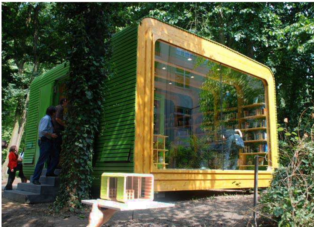
12. ábra: Köln első minikönyvtára