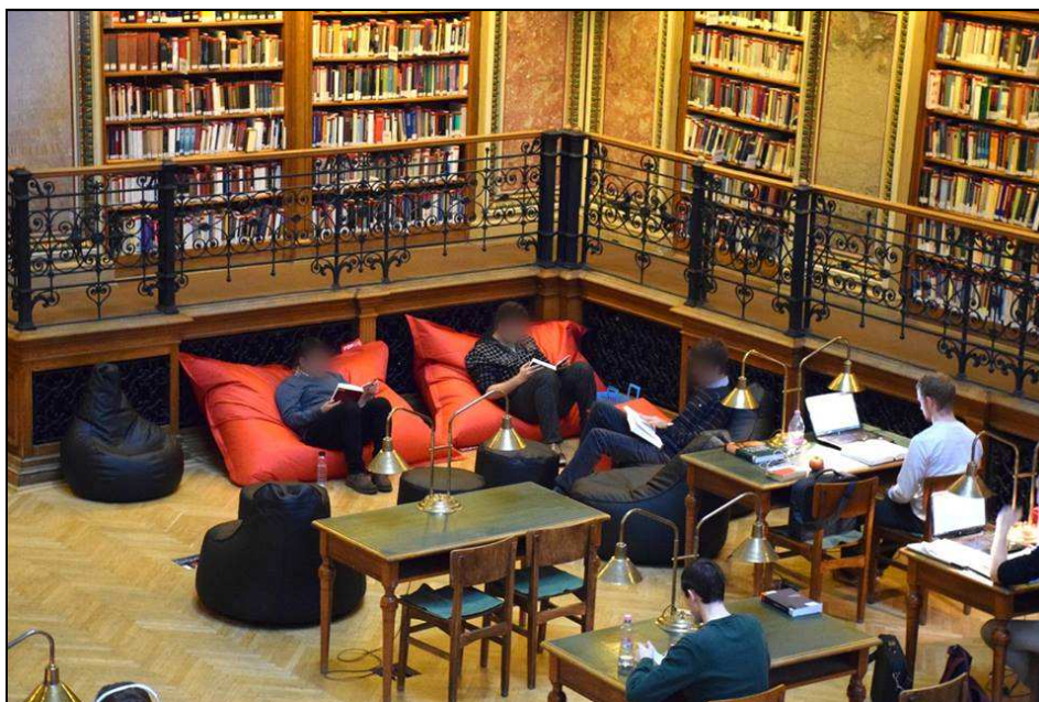
6. ábra: Babzsákok az ELTE Egyetemi Könyvtár dísztermében