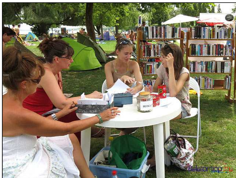
8. ábra: Könyvtár a keszthelyi városi strandon