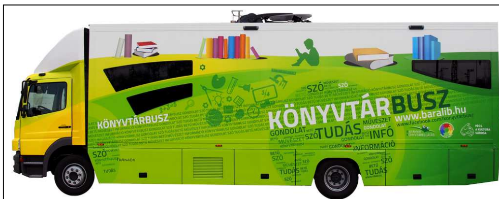
9. ábra: A pécsi Csorba Győző Könyvtár könyvtárbusza