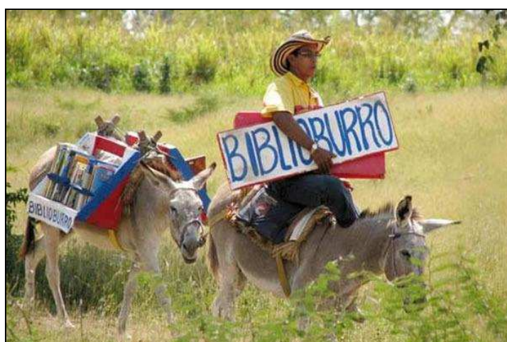
11. ábra: Louis Soriano Biblioburro mozgókönyvtára Kolumbiában