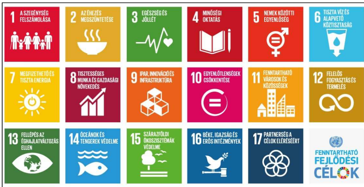
13. ábra: Az ENSZ által meghatározott fenntartható fejlődési célok 2030-ig

Forrás: http://www.menszt.hu/content/download/3233/13031/file/SDGs_HU_final_UNIS.jpg