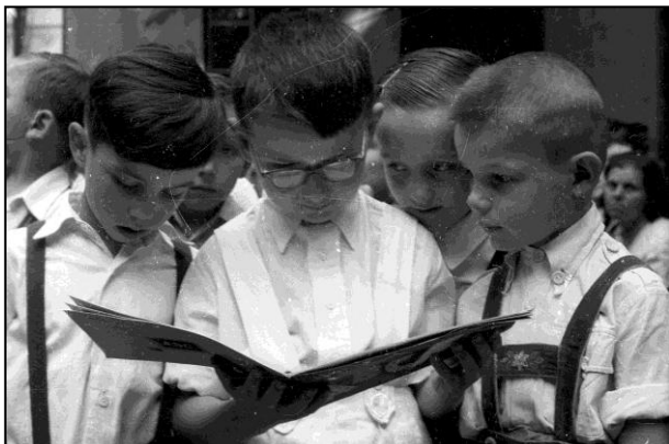
Így olvastak száz éve

eredmények pedig folyamatosan javultak a könyvek számával egészen 350 könyvig, ahol elérte a maximumot a hatás.