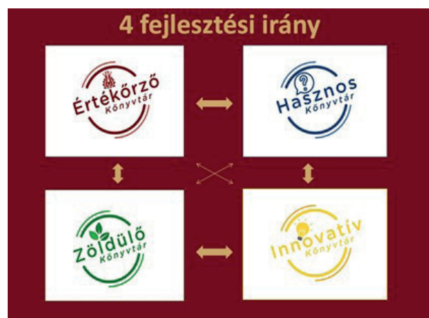
4 fejlesztési irány