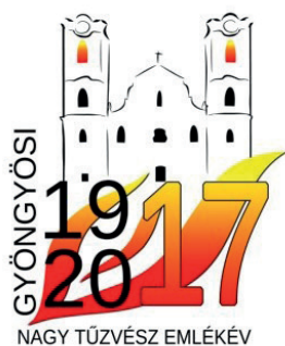
A nagy gyöngyösi tűzvész 100. évfordulójára

Több munkatársunk kreativitását bizonyítja, hogy saját magunk készítjük arculati elemeinkhez illeszkedő logóinkat, plakátjainkat.