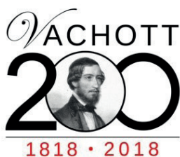
Könyvtárunk névadója születésének évfordulójára