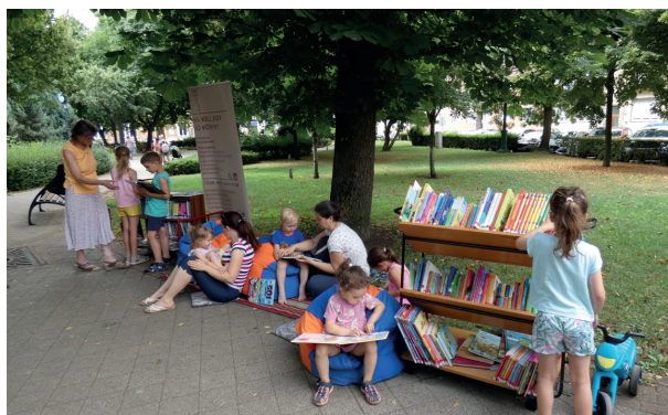
Könyvtár a játszótérekben