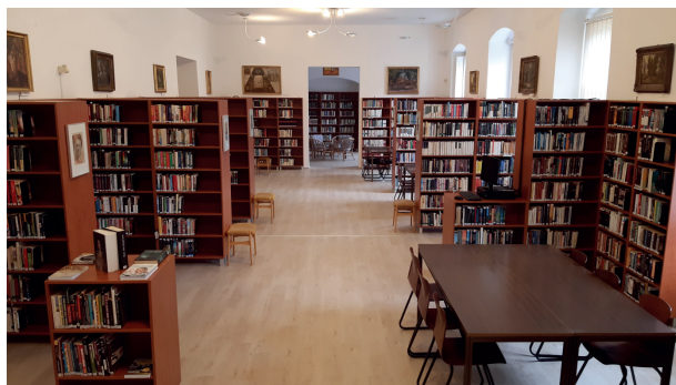
A szépirodalmi részleg

A felhasználói igények változásával párhuzamosan alakítjuk a könyvtár szolgáltatási rendszerét és folyamatosan fejlesztjük a technikai feltételeket. Tapasztalataink szerint az olvasás nem megy ki a divatból , viszont míg régebben elsősorban az ismeretszerzés, tanulás eszköze volt a könyv, ma inkább a kapcsolódásnál van nagyobb szerepe. Könyvbeszerzési politikánkat tehát úgy alakítottuk ki, hogy igyekszünk a legfrissebb, közkedvelt könyveket gyorsan, a helyi könyvesboltból beszerezni, olvasóink konkrét kéréseit is teljesítve.