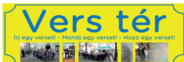
A Vers tér népszerűsítése molinón