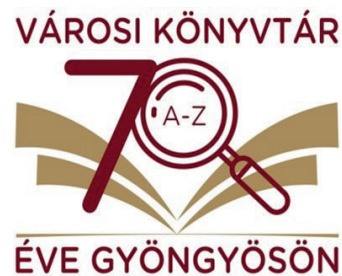
A városi könyvtár megalakulásának 70. évfordulójára