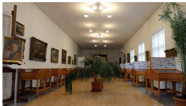
Herman Lipót festmények és éremtári kiállítás

A könyvtárban működő Kiállítóhely és Muzeális Gyűjtemény összefogja Gyöngyös város két, adományozás révén birtokába került gyűjteményét, a Huszár Lajos Éremtárat és Herman Lipót festőművész hagyatékát. Az épületben elhelyezett gyűjtemények jól kiegészítik egymást. A Vachott Sándor Városi Könyvtár Magyarország legfontosabb Herman Lipót anyagával rendelkezik. A festő özvegye 1980-ban ajándékozta Gyöngyös városának a férje hagyatékát képező 98 festményt, 100 grafikát, valamint Herman Lipót személyes tárgyait és dokumentumait. A festmények és néhány személyes