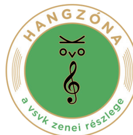
A zenei részleg új logója