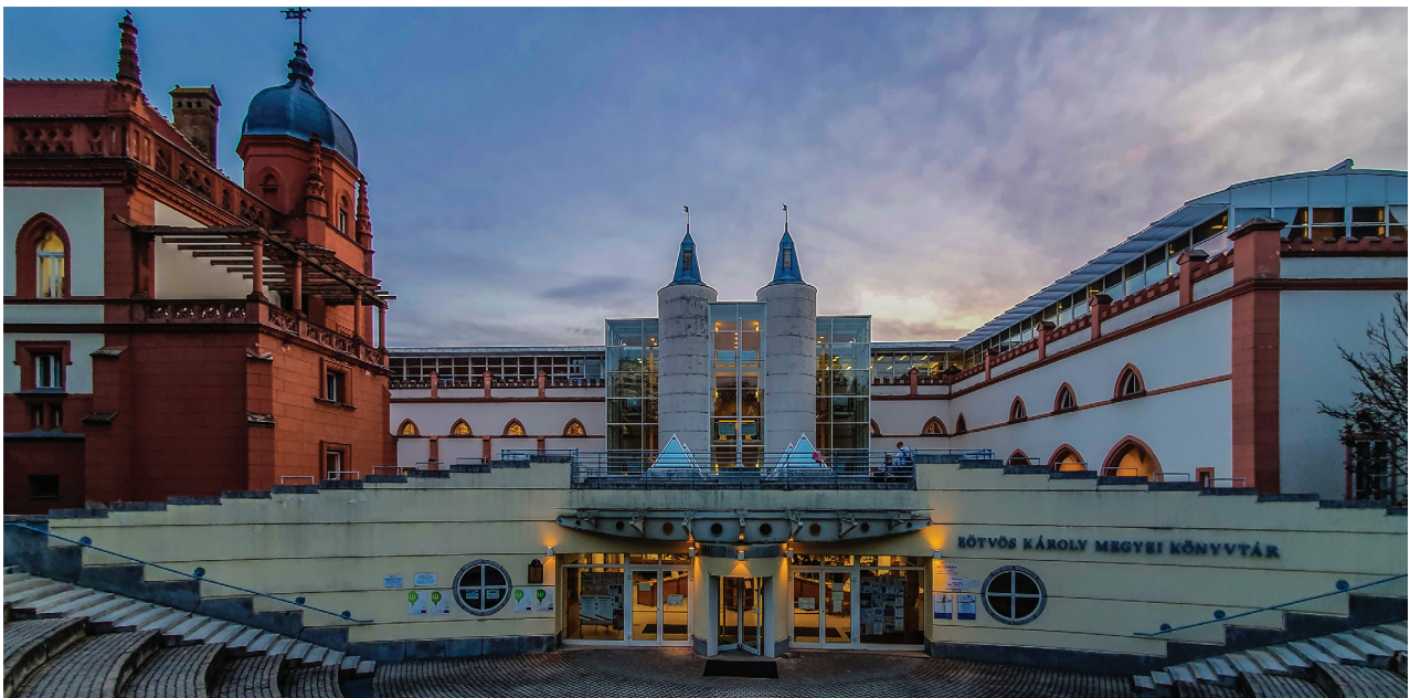
1. ábra Eötvös Károly Megyei Könyvtár épülete

állomány áll használóink rendelkezésére. A kistérségi könyvtári ellátás könyvtárunk egyik fontos feladata. Jelenleg 202 kistérségi szervezzük a könyvtári szolgáltatásokat. Központi könyvtárunkon kívül három fiókkönyvtár látja el a feladatokat. A központi épületben 4900 m 2 területből 3900 m 2 használóink rendelkezésére áll. Munkatársaink létszáma 51,5 fő.