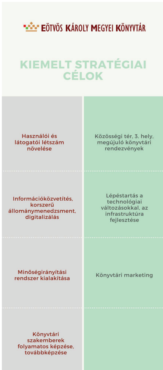
2. ábra Kiemelt stratégiai célok