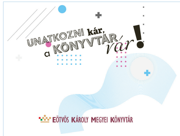
3. ábra Unatkozni kár, a Könyvtár vár! szlogen