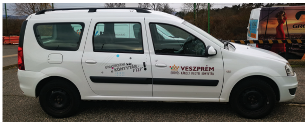
5. ábra Gépkocsi-dekoráció 1. változat