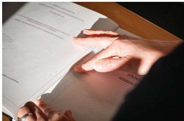
8. ábra Dokumentum RFID-címkével történő ellátása