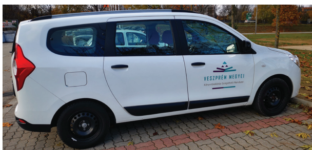
6. ábra Gépkocsi-dekoráció 2. változat