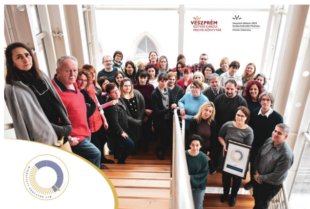
11. ábra Az Eötvös Károly Megyei Könyvtár munkatársai

A 2022. évi minőségcélok között szerepelt, hogy a Minősített Könyvtári címre pályázatot nyújtunk be. A cél érdekében létrehoztuk az Önértékelő csoport-