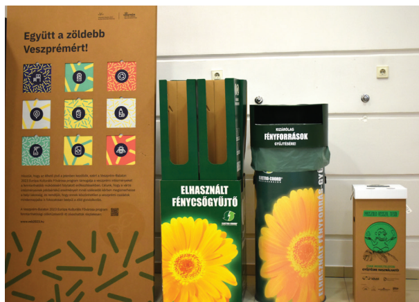
9. ábra Zöld sarok az Eötvös Károly Megyei Könyvtárban