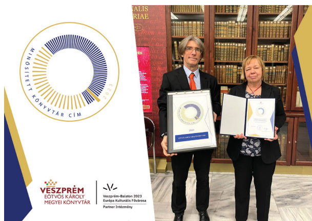
10. ábra Minősített Könyvtár cím átadó

ink megújítása oly módon, hogy tekintettel legyünk a fogyatékossgal élők speciális igényeire. Tervezzük a mentális betegséggel élőket segítő eszközök beszerzését. Az akadálymentesség minimum követelményeit teljesítve 2 évre intézményünk szeretné megkapni az Acces4you védjegyet (EKF-pályázat keretében kiírt pályázaton nyertünk támogatást e feladat megvalósításához).