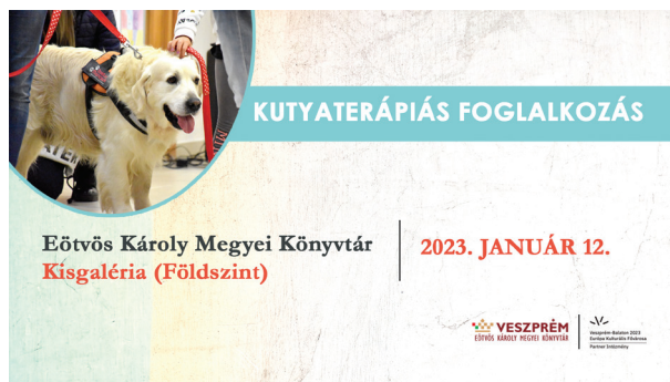
7. ábra Kutyabarát könyvtárban kutyaterápiás foglalkozás