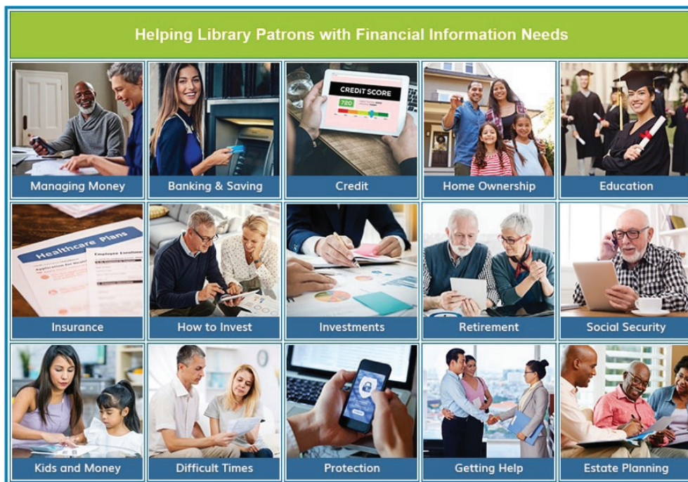
3. ábra A Smart Investing@Your Library könyvtáros továbbképzési témakinálata

Forrás: American Library Association, Smart Investing@Your Library i. m. https://smartinvesting.ala.org/staff-training/on-line-self-paced-reference-course