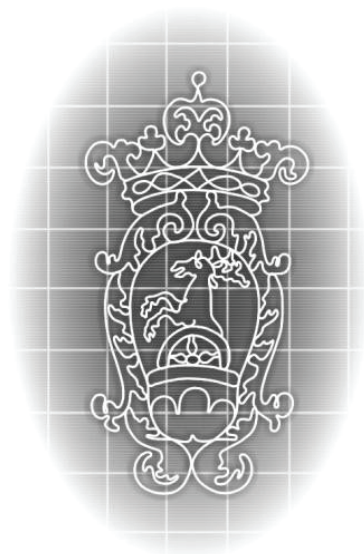
2. ábra A kiválasztott szarvas-vízjel képe

adatbank szám/D-szám (database number): D-2943 tipológiai törzs (type): címer-vízjel vízjel neve/név (watermark name/motif): Pálffy család címere vízjel helye (position of wm): jobb (J) főmotívum (main motif): szarvas félkeréken társmotívum (companion motif): korona, pajzs, hármaskör vízjelpár (watermark pair): vízjelméret (watermark size): 76 x 144 mm