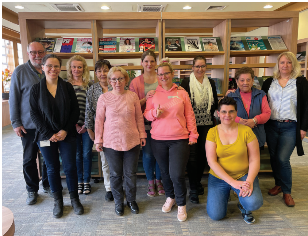
4. ábra A kollektíva