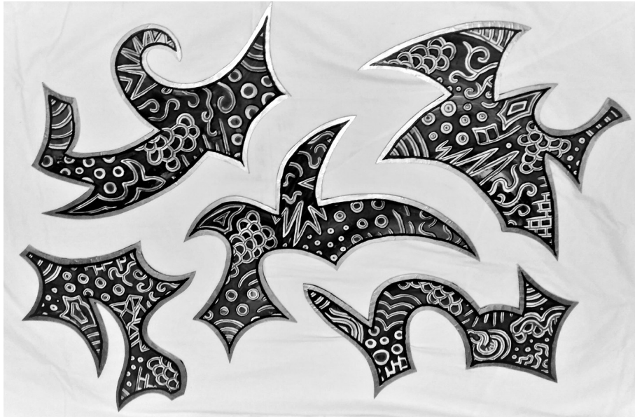
Serhal-Dora-Zeina: ébredés előtt