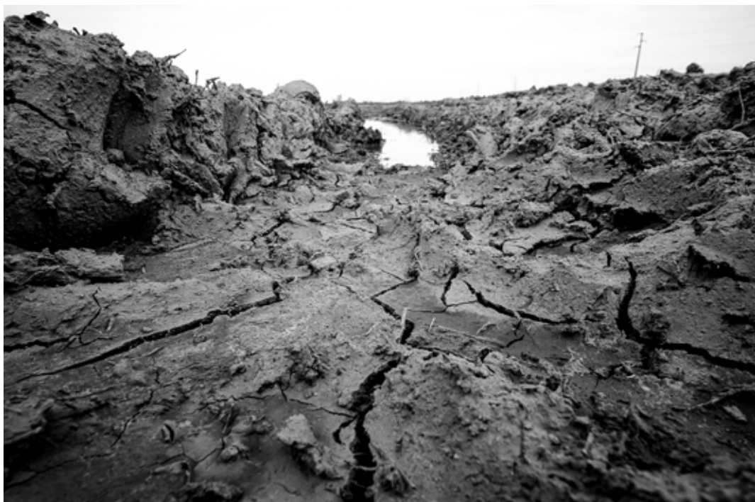
Szimpla bánáti kátyú (Csóka közelében, 2024. 02. 10.)

cipő, a másikban a sámlit. Átmegyek a tévé előtt, anya ekkor sem mondja, hogy ne mászkáljak előtte, de érzem a tekintetét a hátamon. Az ablak elé állítom a sámlit, felállok rá, és kidobom a cipőket, a lendülettől majdnem kiesek, meg kell kapaszkodnom a keretben. Nyávogást hallok, megijedek, hogy eltaláltam Artúrt, de látom, hogy jól van, csak éppen ő is megijedt, hogy eltalálom és elfutott. Lemászok a sámliról és odakuporodok anya mellé a kanapéra, és anya átkarol és magához húz, és akkor már megint sírnom kell, és azt képelem, hogy színesek a könnyeim, összerosódnak anya fekete szemfestékével, és soha semmi nem lesz már fehér.