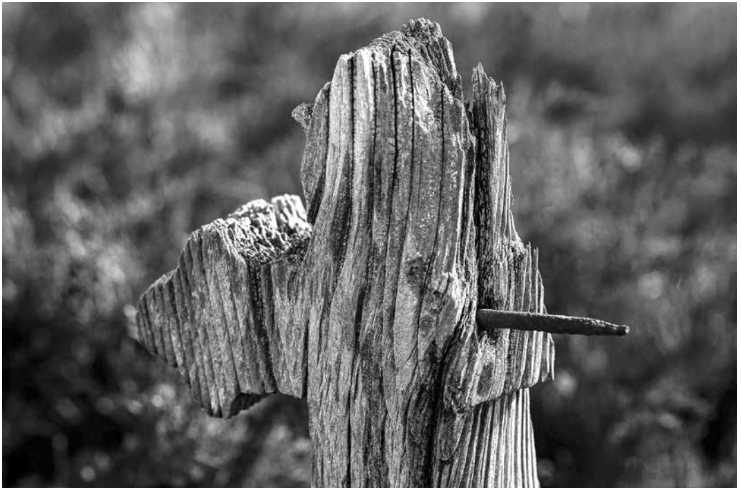
Köröszt (Zenta, 2023. 02. 09.)

De megmaradok magamnak örökre, és soha nem leszek már normális, családcentrikus férfiember, aki tenyerén hordozza azt, akit szeret, vagy akit szeretnie muszáj.