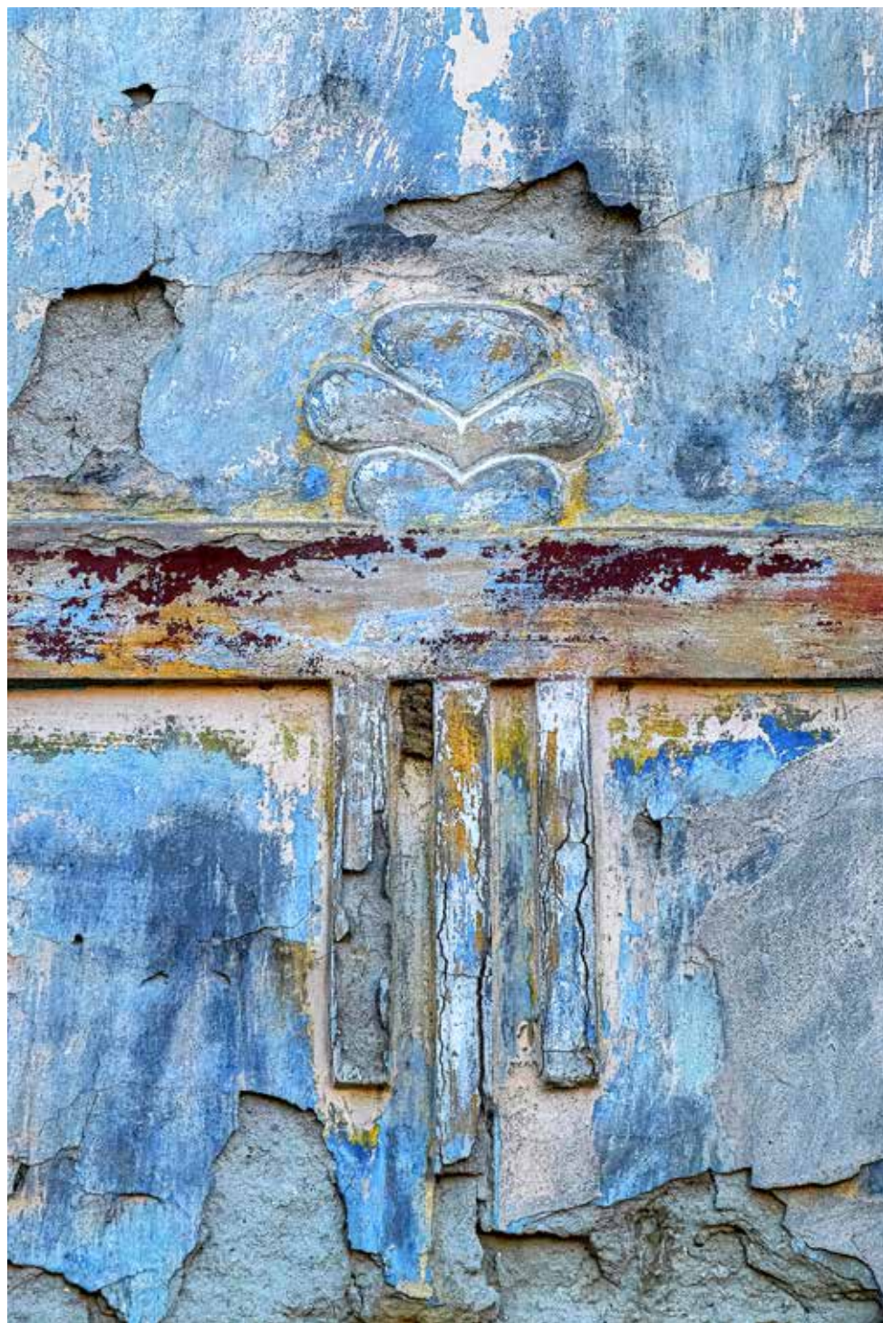
Virág (Szeghegy, 2022. 10. 27.)