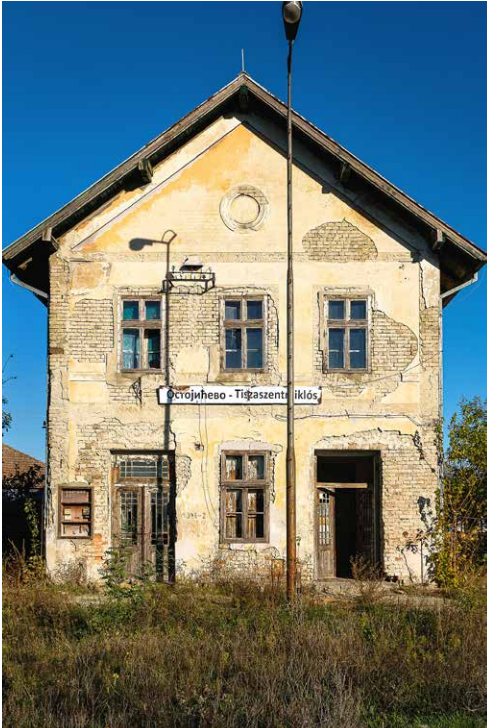
Vasútállomás (Tiszaszentmiklós, 2023. 11. 12.)