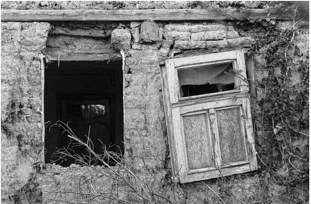
Sárga ablak (Tizsaszentmiklós, 2023. 11. 12.)