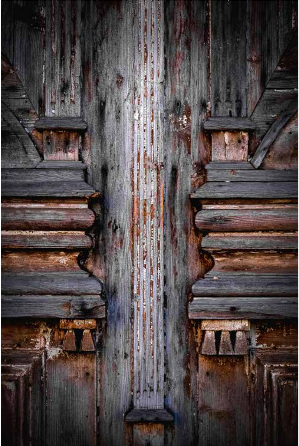
Míves (Magyarkanizsa, 2023. 02. 15.)