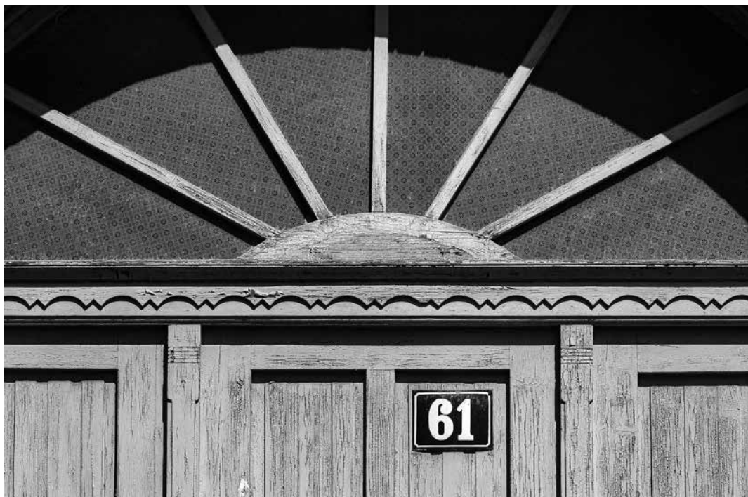
61 (Topolya, 2023. 04. 20.)

És most olvassuk Tandori „instrukcióit” a Londoni Mindenszentek című verséről.