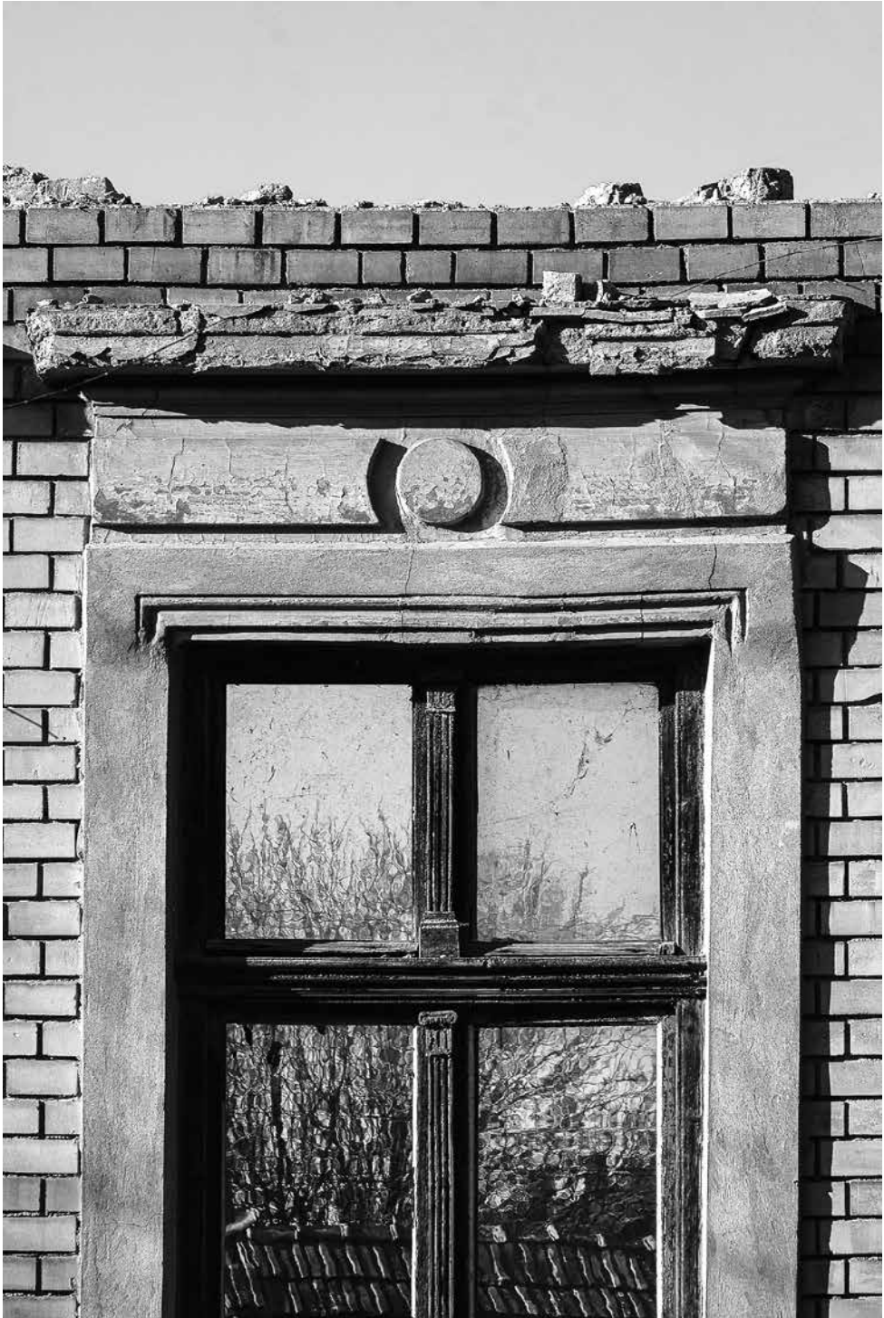
Ablakos kép (Magyarkanizsa, 2023. 02. 15.)