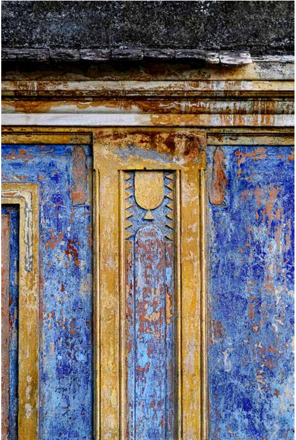
Archaikus (Tiszaszentmiklós, 2022. 05. 14.)