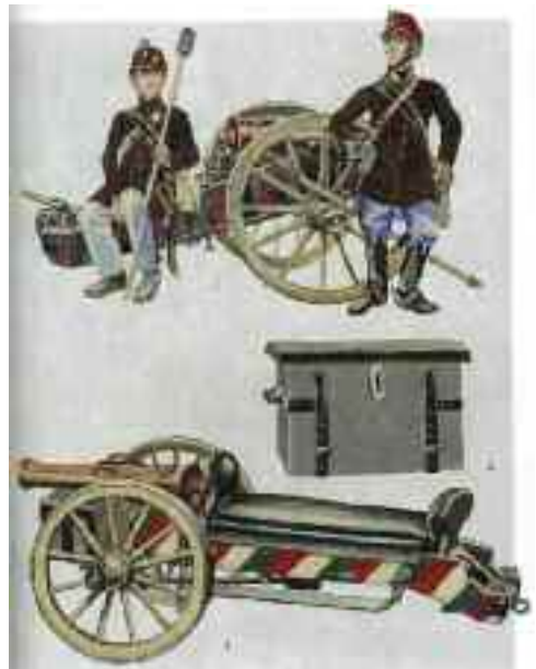
Piros sapkás honvédtüzérek és 6 fontos lovas ágyú