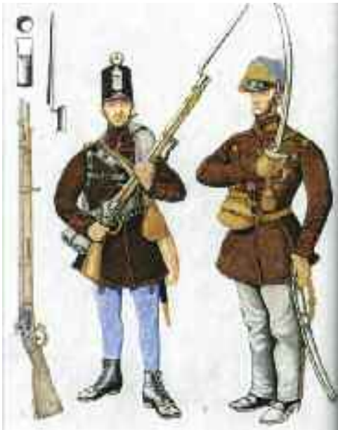
Honvéd gyalogság, honvéd és főhadnagy