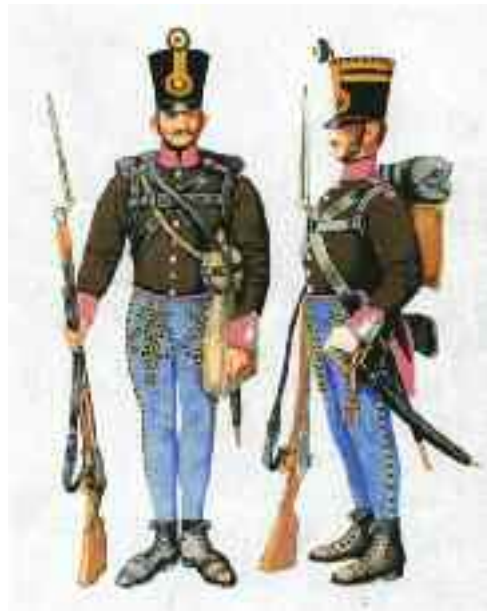
15. (2. Székely) határőr gyalogezred