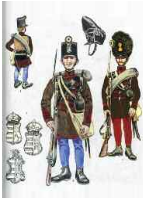
Honvéd gyalogosok, jobbra a komáromi erődben alakult gránátos osztály őrmestere