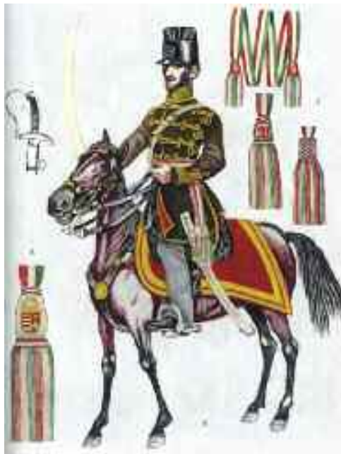
Honvéd őrnagy lóháton