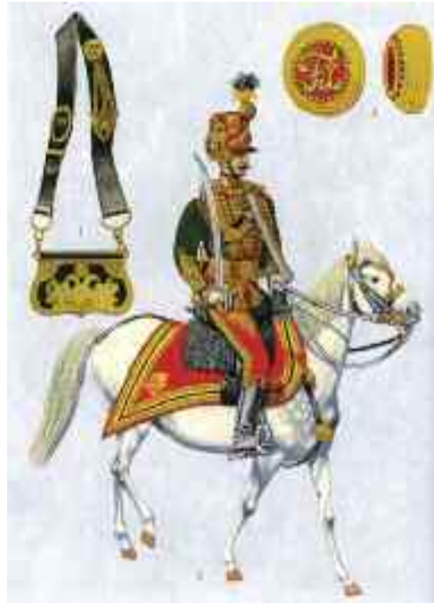
8. Koburg huszárezred, törzstiszt díszben