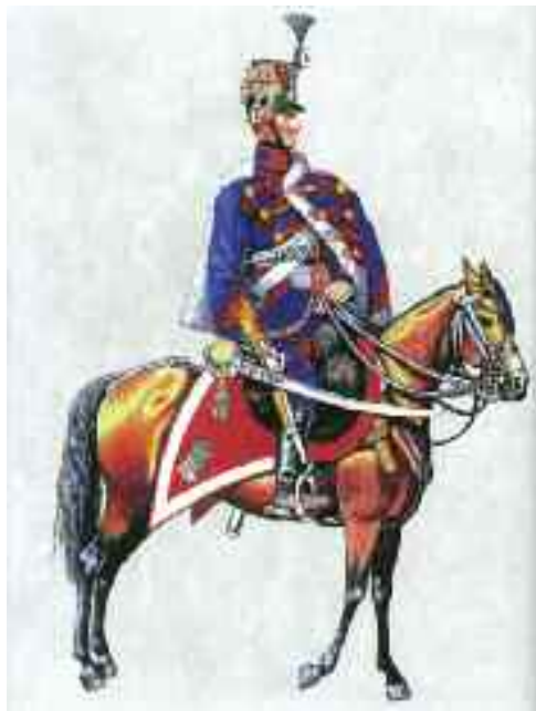
14. Lehel huszárezred közhuszája