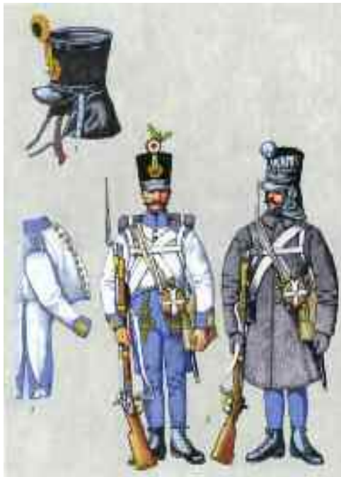
32. Esteri Ferdinánd főherceg-sorgyalogezred katonái