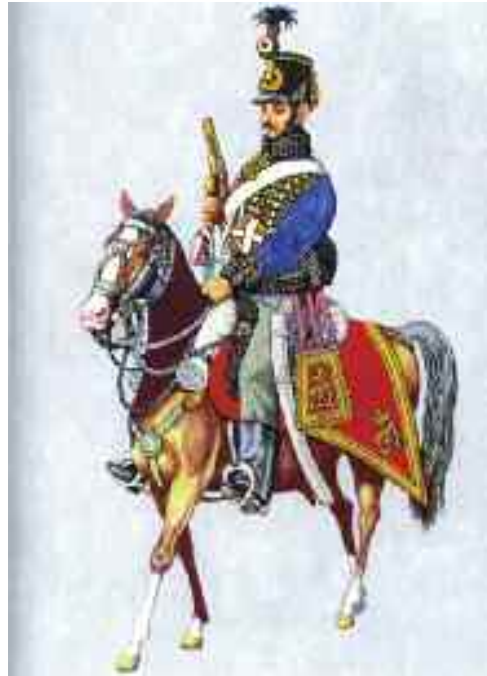
12. Nádor-huszárezred, huszár téli menetöltözetben