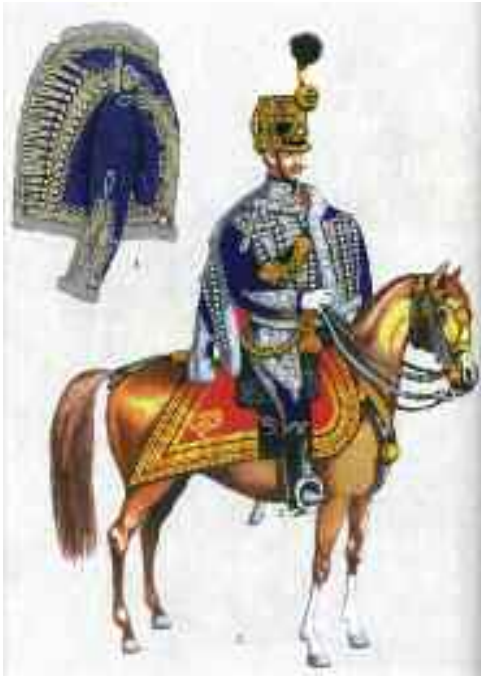
11. Székely határőr huszárezred, törzstiszt díszben