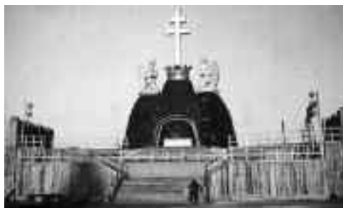
Gáthy Zoltán – Mátrai Lajos: Szénoltár , 1938