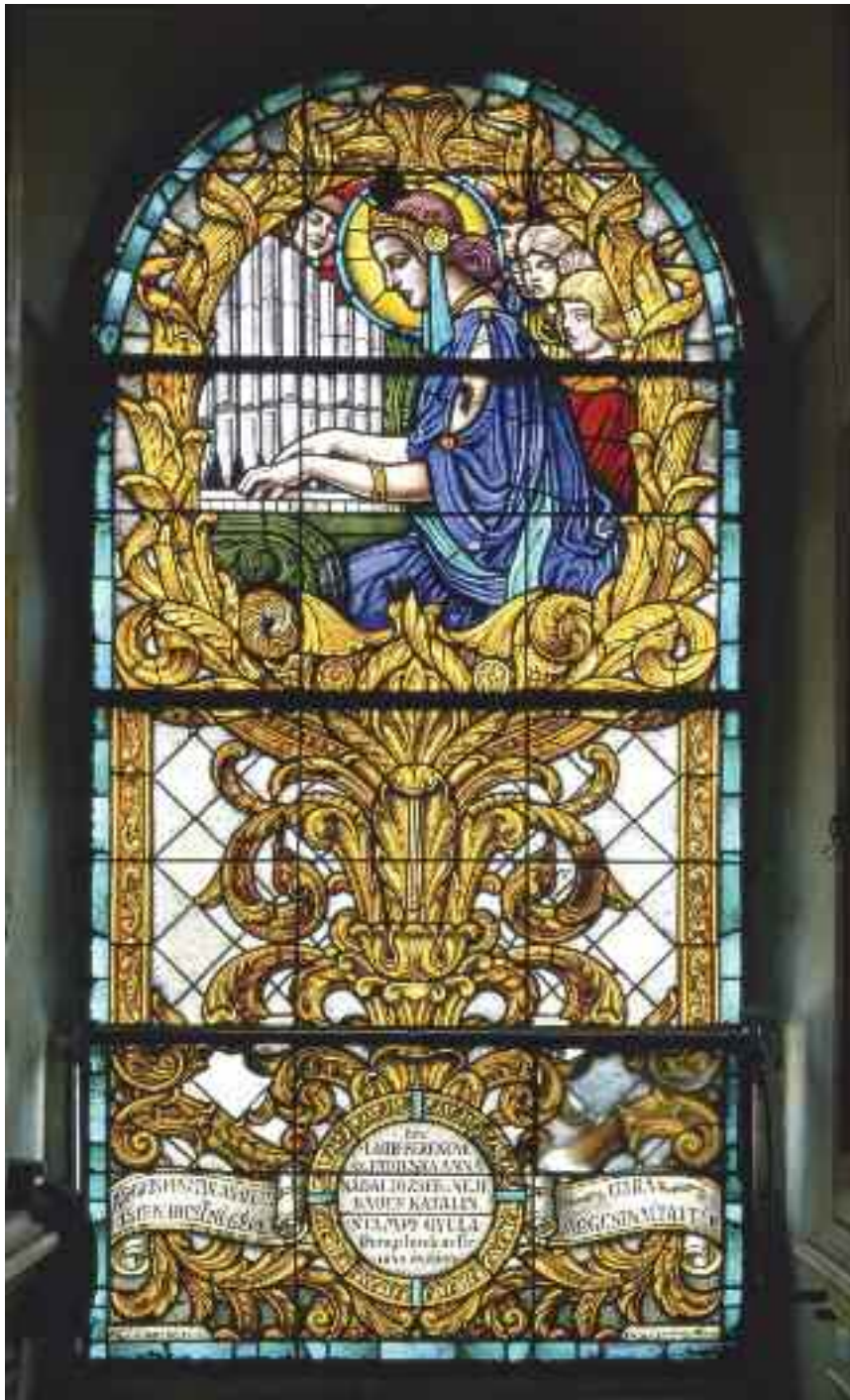
Szent Cecília-üvegablak, 1935 (Dorog)