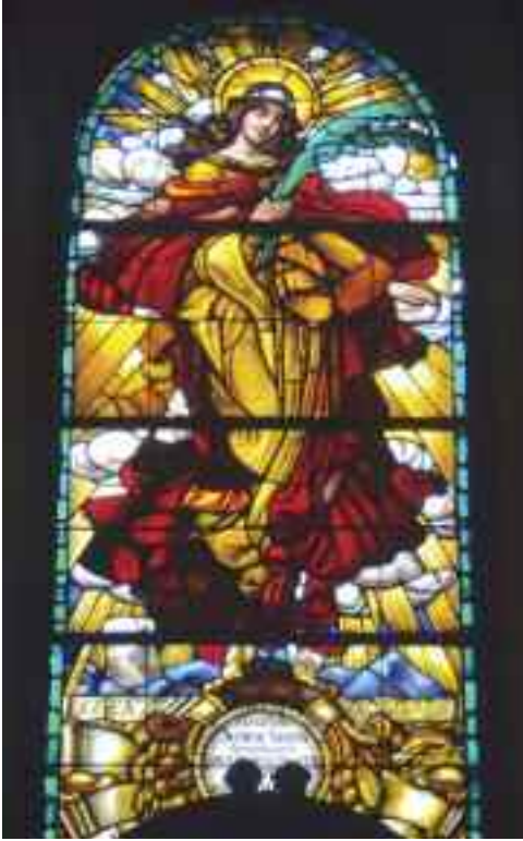
Szent Borbála, 1935 (Dorog)