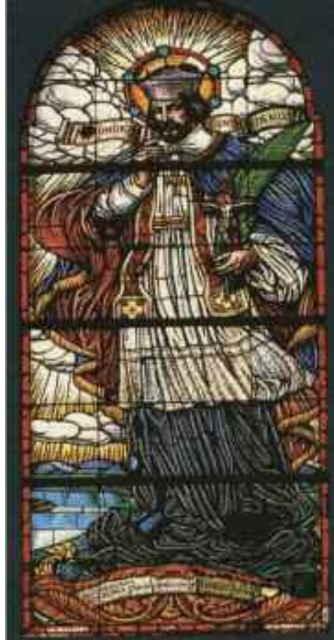
Nepomuki Szent János, 1935 (Dorog)