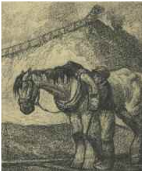
Bányaló fiúval, 1935

hogy több darabjuk ismeretlen helyen lappang, s nem láthatja a nagyközönség. Néhány darabja a soproni Központi Bányászati Múzeum tulajdona, más – sérült – vázlatokat Haranghy Judit Dorog városának ajándékozta. Jelenleg restaurálásra várnak. S ennek a közös munkának maradtak nyomai olyan apróbb megbízásokban, mint a dorogi Munkásotthon Önszegélyző Egyesület zászlójának, szimbólumainak megvalósítása, vagy a részvétel egy provizórikus alkotás látványképének megtervezésében: az eucharisztikus világtalálkozást 1938-ban Dorogon monumentális, szabadtéri szénoltár építésével ünnepelte meg a bányatársaság. Az építész Gáthy Zoltán, a szobrász Mátrai Lajos és a festő Haranghy Jenő szép együttműködését is illusztrálja az országos híró építmény.