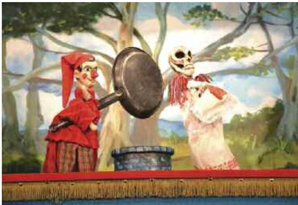
Vitéz László. Az elásott kincs. 2013. Mesebolt Bábszínház, Szombathely