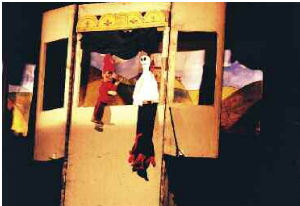
Purgateátrium. Rendezte: Kovács Ildikó, Tervezte: Dan Fraticiu. 1992. Círóka Bábszínház, Kecskemét