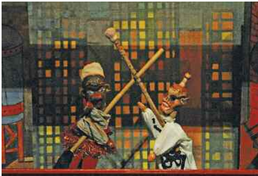
Batu-Tá kalandjai. 2013. Vojtina Bábszínház, Debrecen