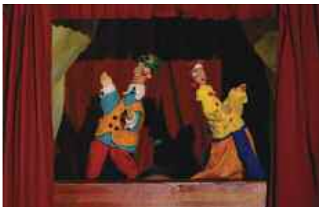
Gigác Lacku. R: Kovács Géza, T: Boráros Szilárd, játssza: Futó Ákos, 2009. Kabóca Bábszínház, Veszprém