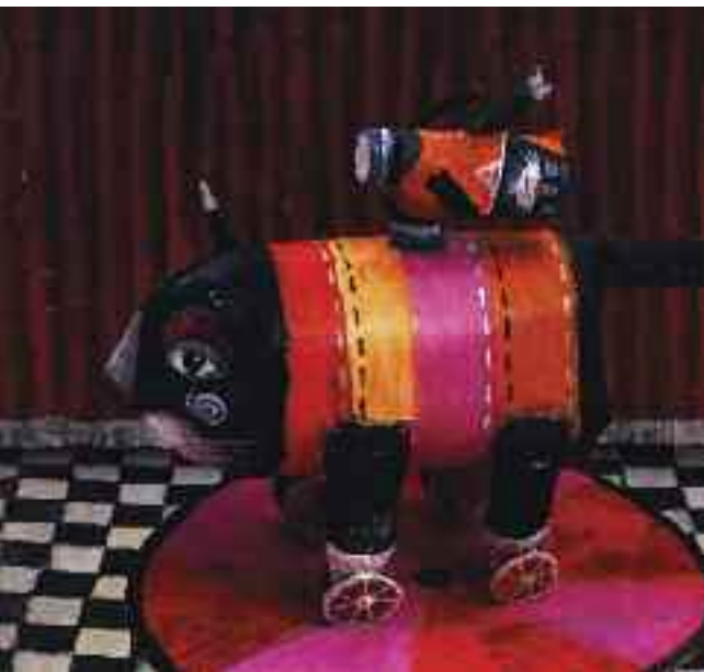
Vanessza és a gördülő cicák

(Módra Ildikó – Szalma Edit: Trapp . Bp., 2010. Naphegy Kiadó; Módra Ildikó – Szalma Edit: Cinóber Cirkusz . Bp., 2014. Móra Kiadó)