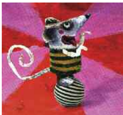
Vakmerő cincigó a cirkuszban