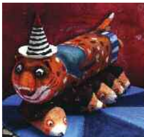
Csipesz, a macskafakír