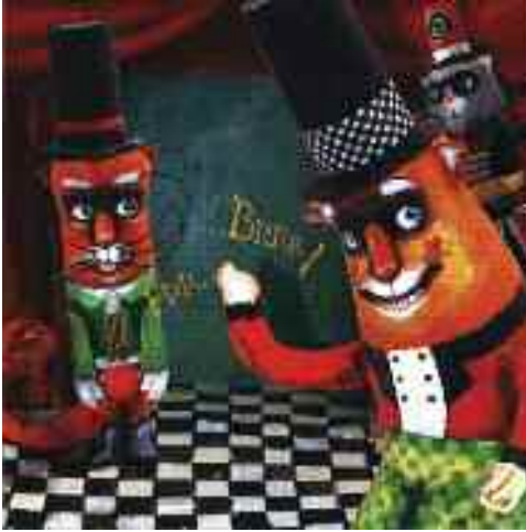
Fiminc úr, a porondmester, Grabanc és Miss Mini apukája, a világhírű idomár