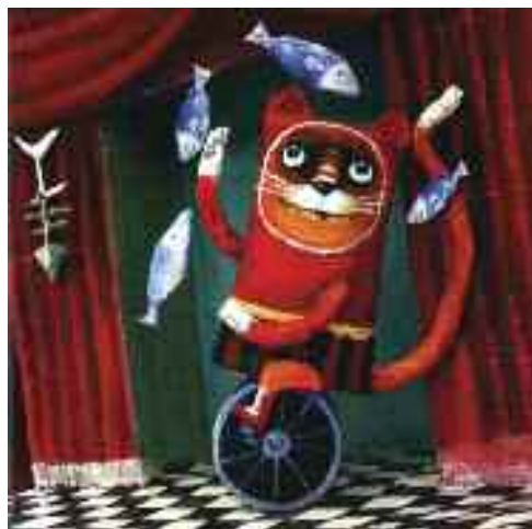
Mázlist, a zsonglór