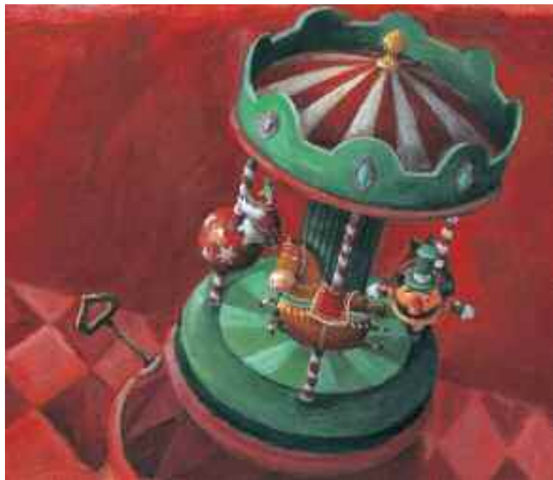
TRAPP – Szalma Edit illusztrációi