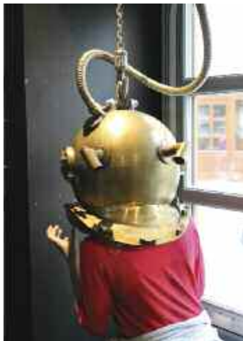
A Zeman Múzeum kiállításának termei – látogatókkal