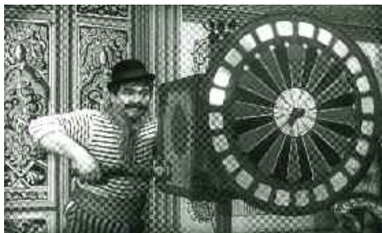
Ördögi találmány (film), 1958