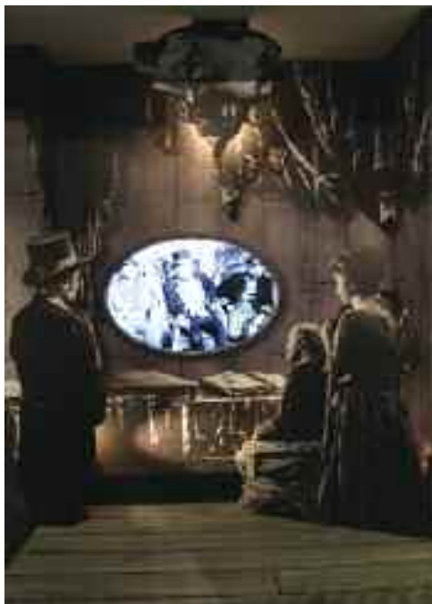
Ördögi találmány, 1958