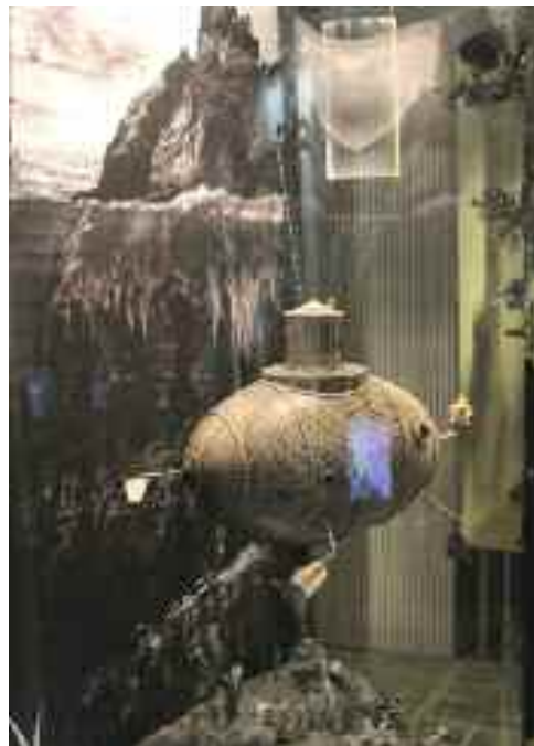
Ördögi találmány, 1958