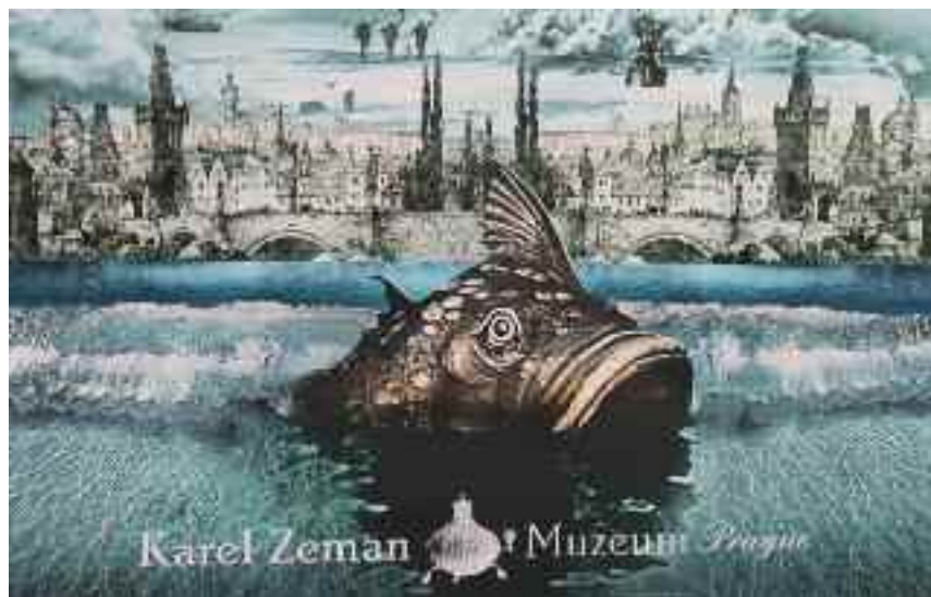
A prágai Karel Zeman Múzeum plakátja