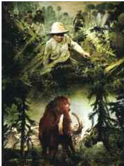
Utazás az őskorba, 1955

A teret kitágító tükrök között, a „távlatok folyosóján” végighaladva s azokon a fülkéken túljutva, amelyekben bele lehet nézni a filmekbe, az elvárászolt látogató az utolsó terembe jut. Itt további nevezetes művek: a Bolond krónikája (Bláznova kronika, 1964), az Ellopott léghajó , az Üstökösön , az Ezeregyéjszaka meséi (Pohádky tisíce a jedné noci, 1974), a Varázsló tanítványa (Čarodějův učeň, 1977), a Mese Jancsiról és Marikáról (Pohádka o Honzíkovi a Mařence, 1980) idézik fel a rendező munkásságát. Az Ezeregyéjszaka meséiről megjegyzendő, hogy Zeman ezzel a filmmel kezdte meg a lányával folytatott együttműködést, aki képzőművészként vett részt a közös munkában.