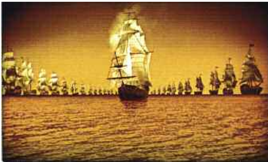
Münhausen báró, 1961