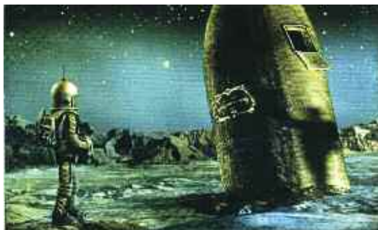
Münhausen báró, 1961