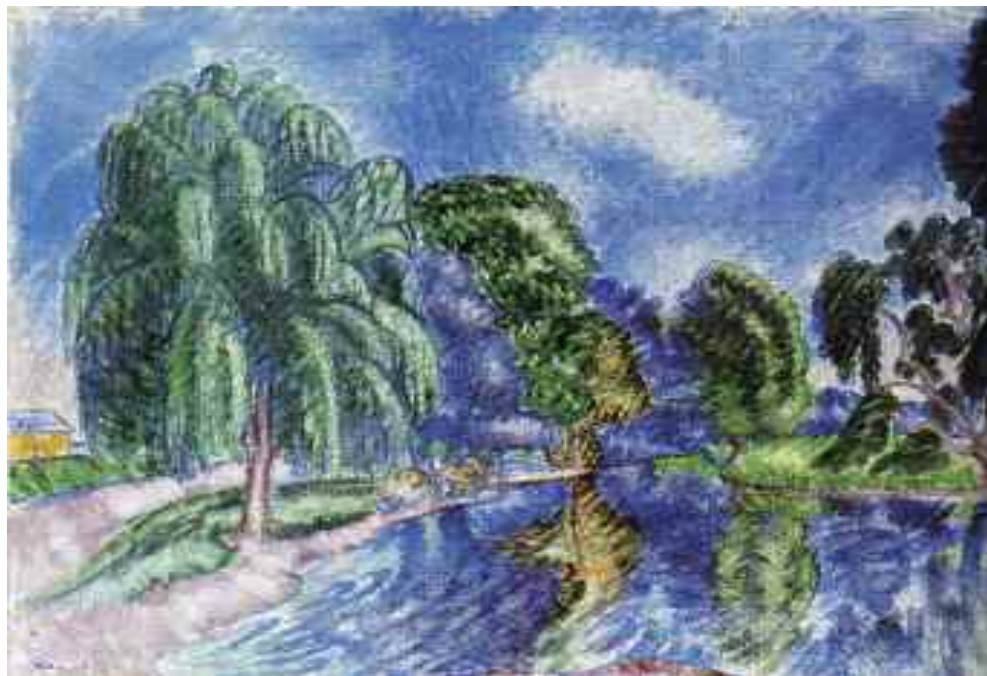
Vaszary János: Tatai park , 1909 (olaj) Galerie Semiha Huber, Zürich