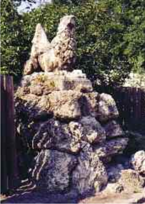
Schwaiger Antal: Griffes kapu részlete, Angolkert, Tata