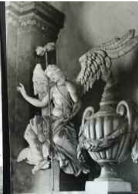
Schwaiger Antal: Szent Kereszt plébániatemplom főoltárának szobordíszje, Tata