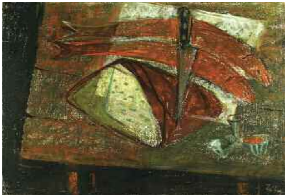
Zilahy György: Nagypéntek , 1960-as évek (pasztell) KDM