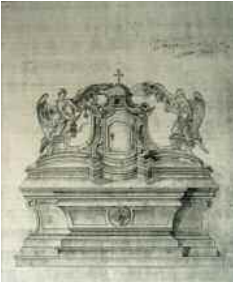
Schwaiger Antal: Oltárterv rajza, színezett vázlat. (Szlovák Nemzeti Archívum. Közli: RUSINA 1998, 145. kép)