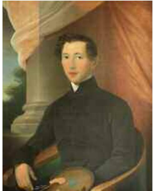
Pesky József: Stech Alajos , 1844 (olaj) KDM

életében nem egyszeri kalandot jelentett a porcelánfestés, arról egy másik dísztál tanúskodik. A magántulajdonban lévő darab egy áttört, dúsan aranyozott peremű tál, amelynek tükrében fiatal nő arcképe látható, a századvég turnűrös viseletében, nagyon finom árnyalatokkal megfestve. Stech ez esetben is jelezte munkáját. A két tányér – s különösen az arcképpel dekorált – arra enged következtetni, hogy a mester nagy jártasságra tett szert a porcelánfestés terén és valószínűleg több ilyen alkotása is született, noha nyilván nem állhatott a porcelánműhely alkalmazásában.