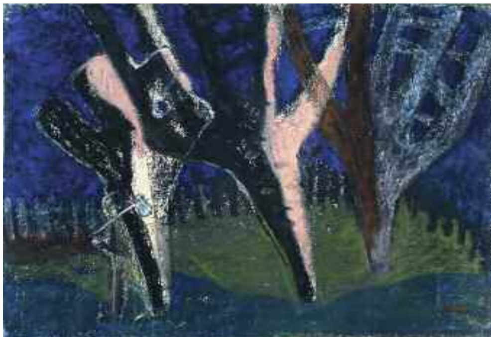
Zilahy György: Elhagyott kert öreg fái , 1960-as évek (pasztell) KDM