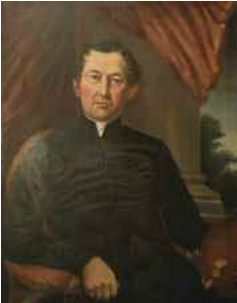
Stech Alajos: Önarckép , 1881 (olaj) KDM