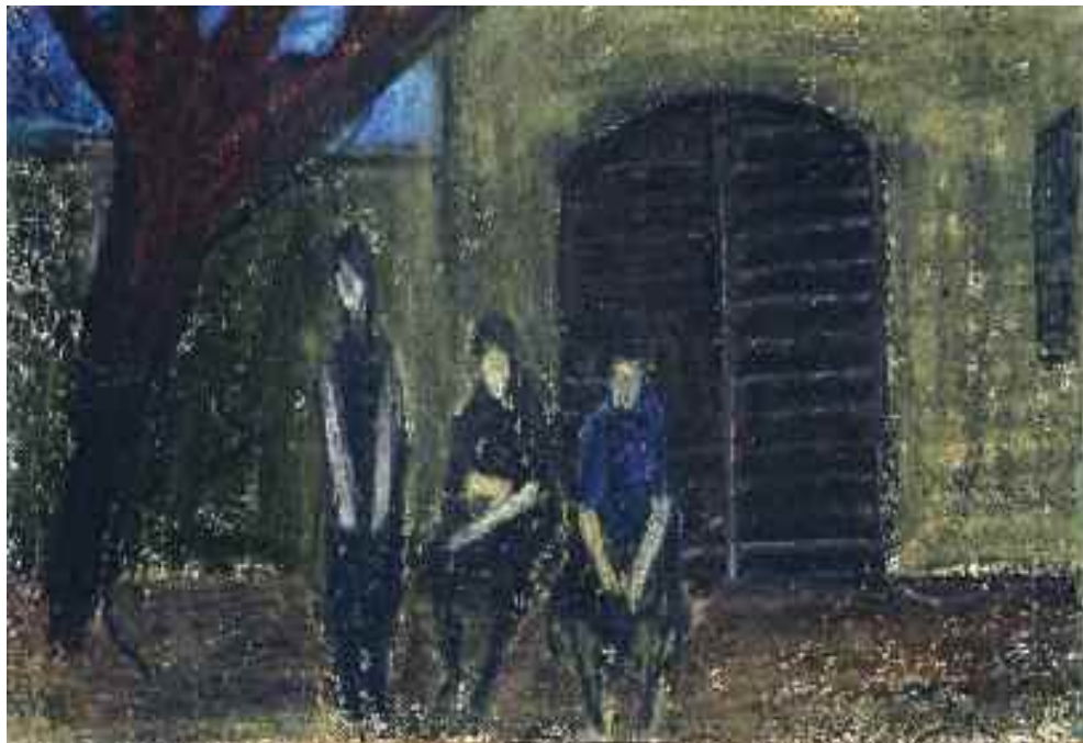
Zilahy György: Ház előtt , 1960-as évek (pasztell) KDM.