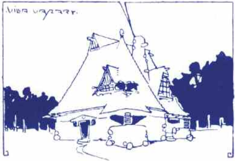
Torockai Wigand Ede: A Vaszary-villa terve, 1911