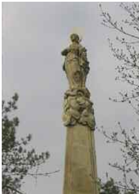
Schwaiger Antal: Maria Immaculata emlék, Tata