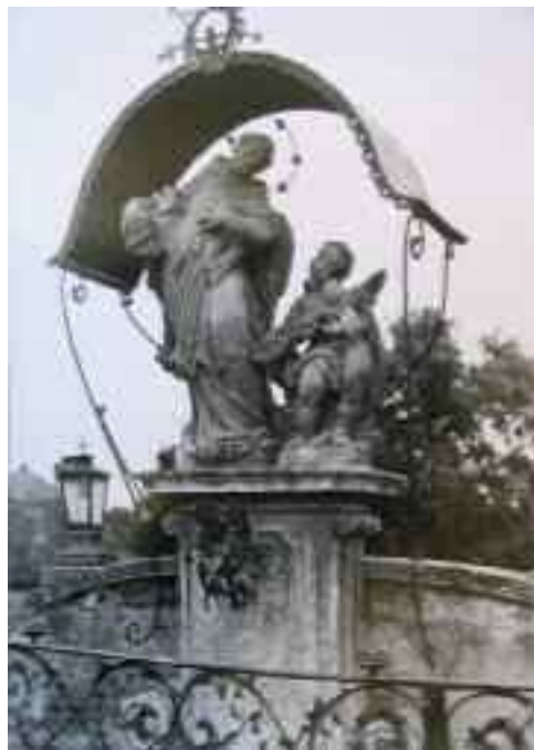
Schwaiger Antal: Nepomuki Szent János szoborcsoport, Tata