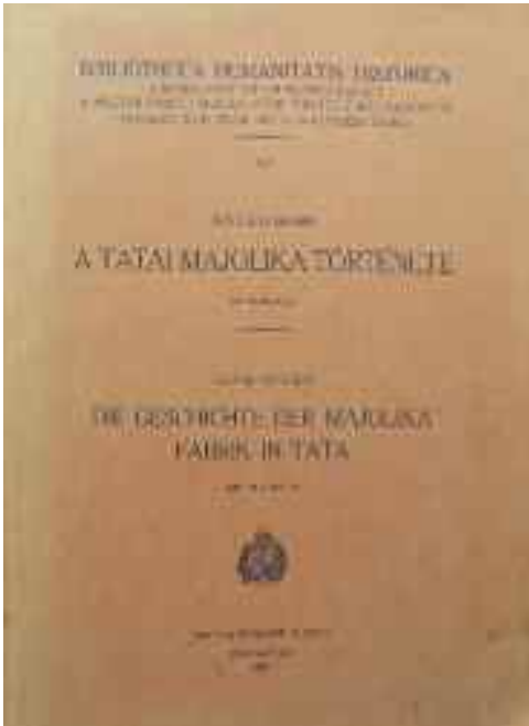
Révhelyi Elemér: A tatai majolika története című könyvének címlapja, 1941