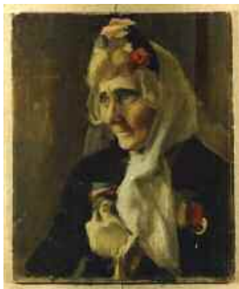
Nagy János: Julia néni , 1953 (olaj) Nagy János Gyűjtemény, Tápiószéle