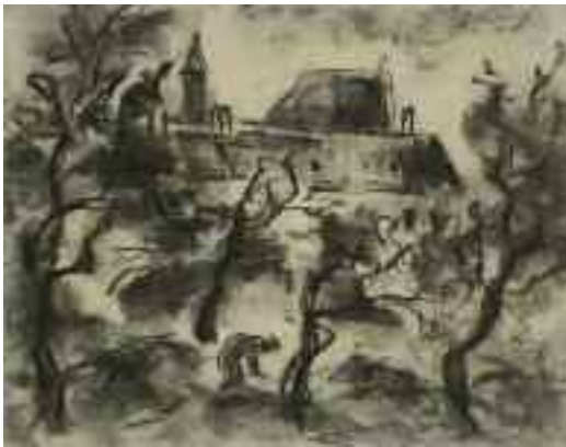
Schadl János: A kapucinus templom kertje, 1941 (szén) Tata Város tulajdona