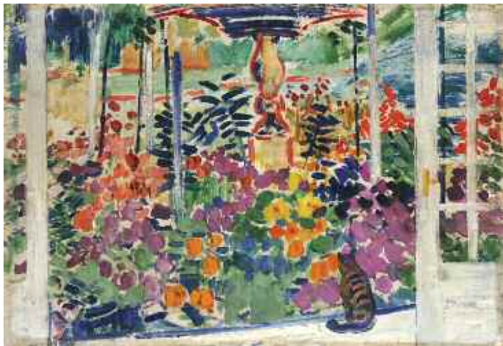
Vaszary János: Parkrésztel verandáról , 1930-as évek (olaj) MNG