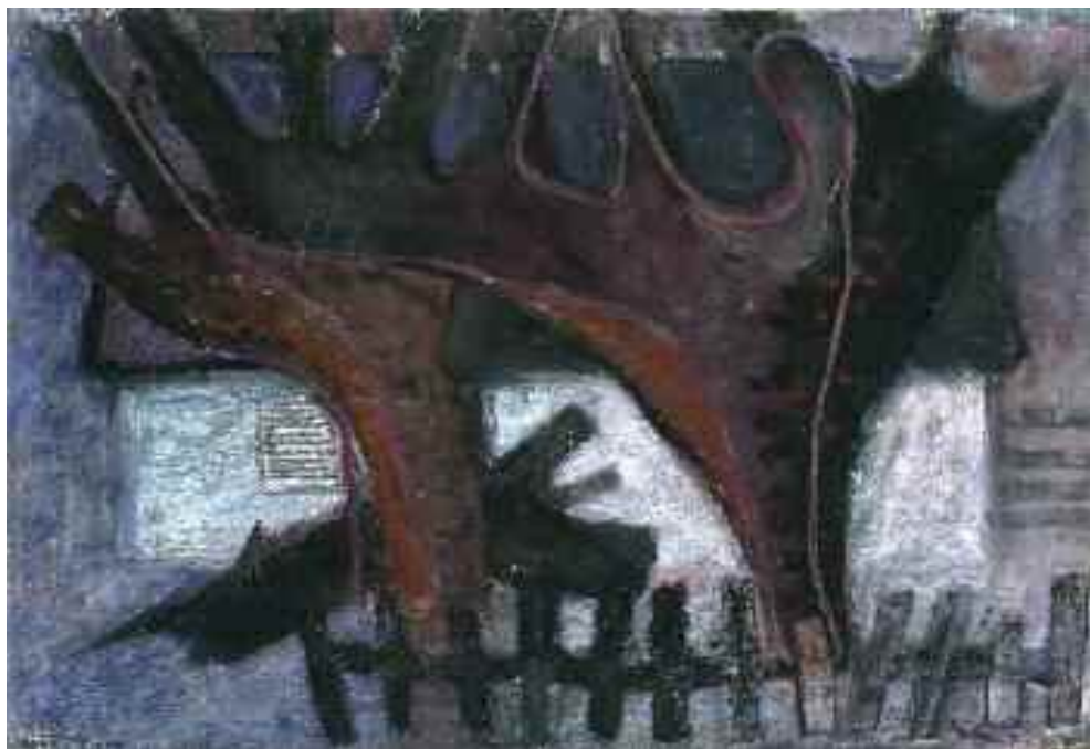
Zilahy György: Tatai fák I. , 1960-as évek (pasztell) KDM.