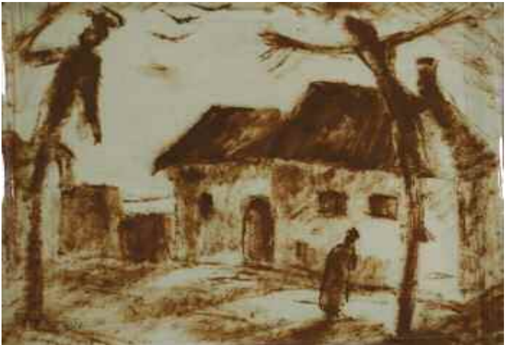
Schadl János: Házak , 1937 (földfesték) Tata Város tulajdona