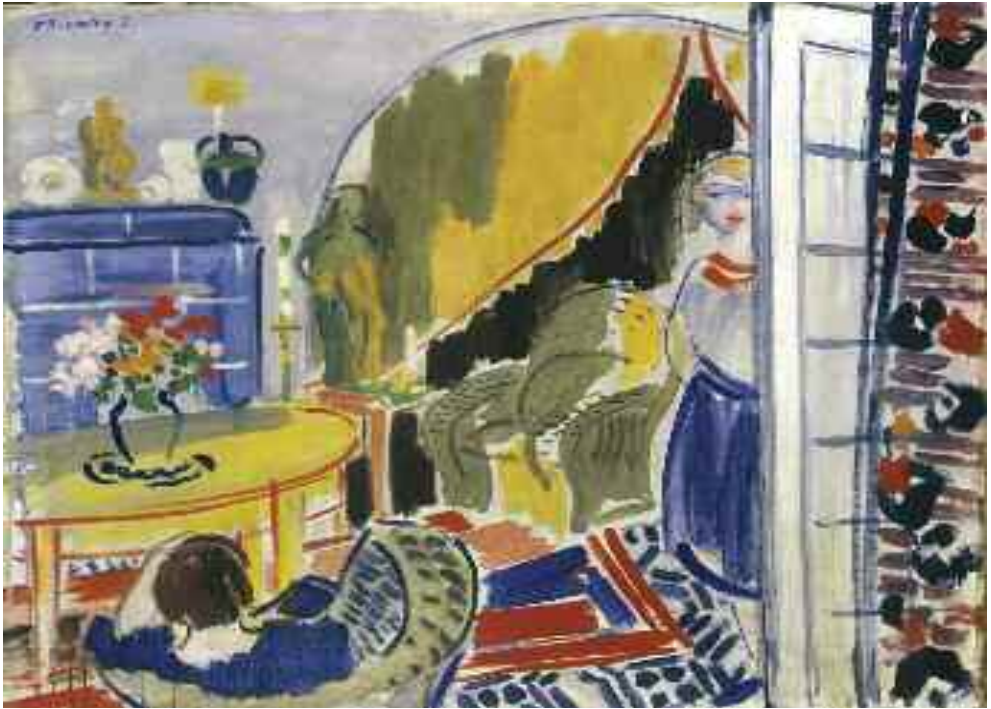
Vaszary János: Szobában, 1930-as évek (olaj) MNG