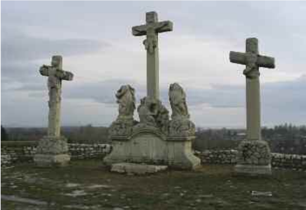
Schwaiger Antal: Kálvária szoborcsoport, Tata (Fotó: P. Tóth 2004)