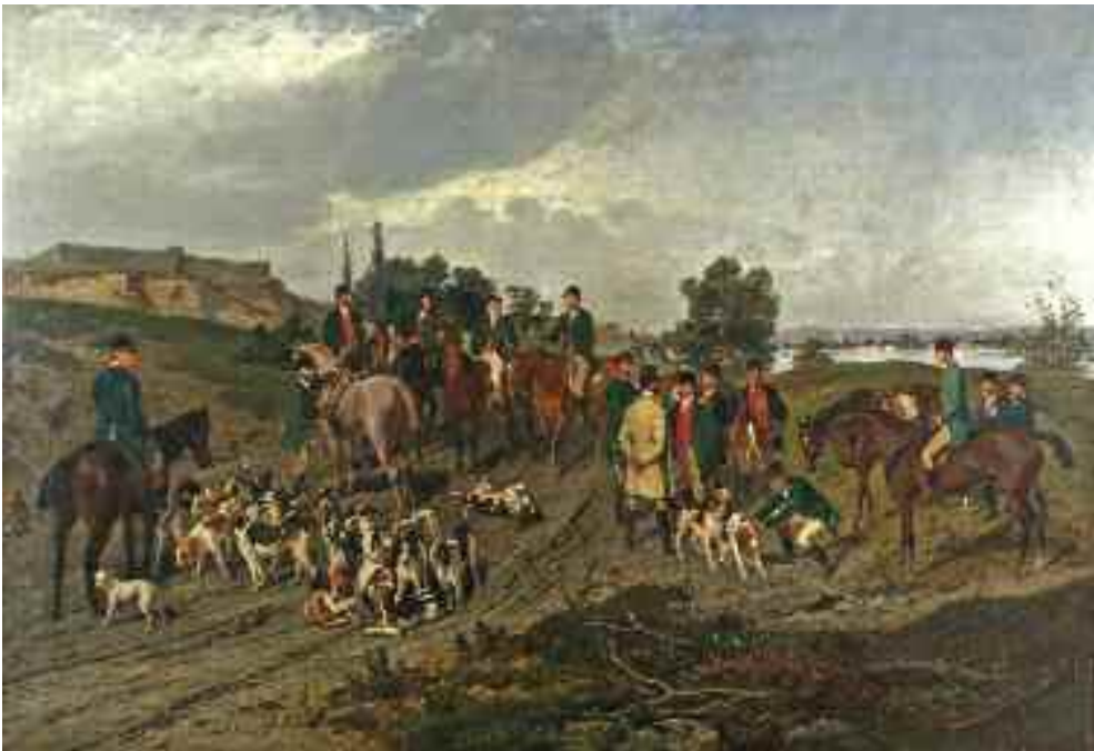
Wilhelm Richter: Az Esterházy család rókvadászata , 1870 (olaj) KDM