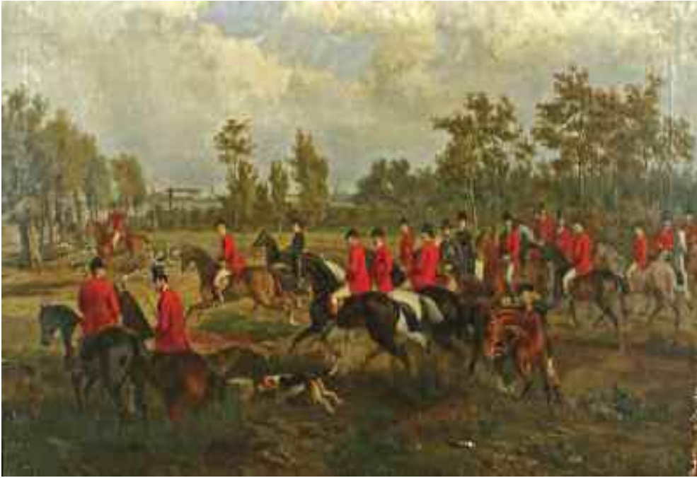
Wilhelm Richter: Falkavadászat , 1872 (olaj) KDM