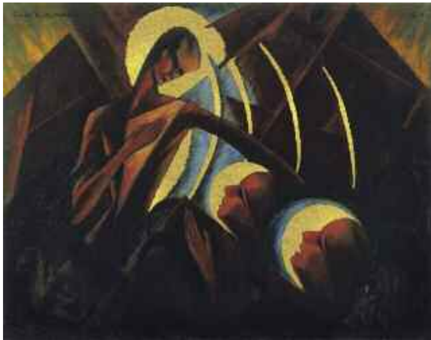
Schadl János: Emberek, legyetek tisztákl , 1923 (olaj) Magántulajdon