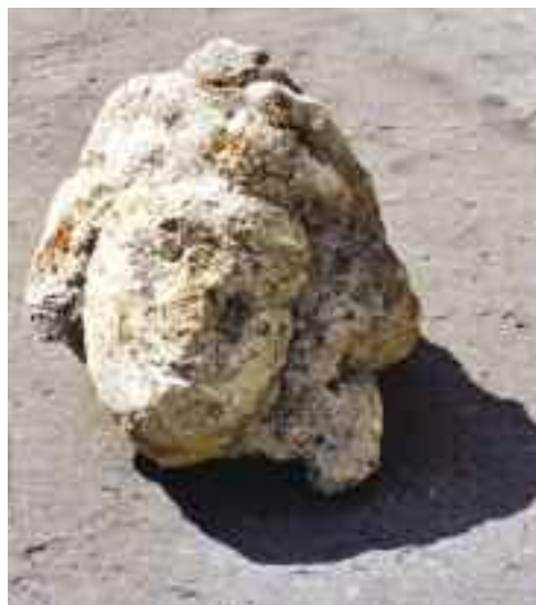
Schwaiger Antal: Szökőkútnimfa, szobor töredék, Esterházy-kastély, Tata