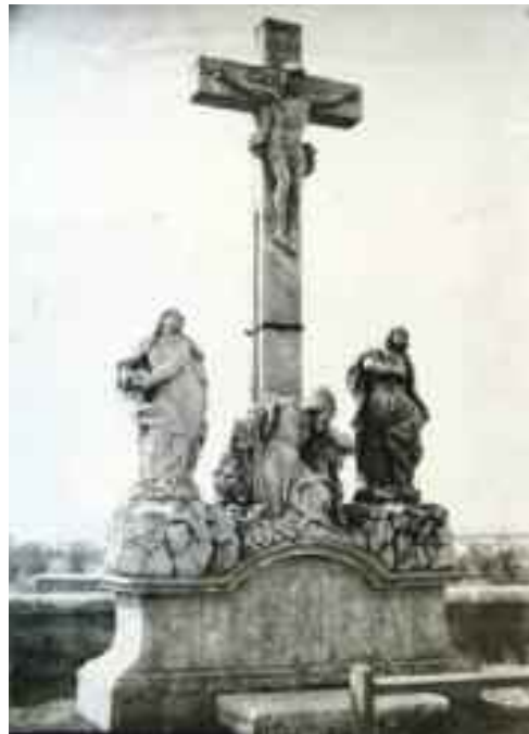
Schwaiger Antal: Kálvária szoborcsoport középső egysége, Tata