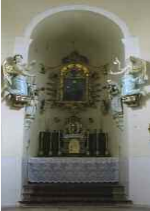
Schwaiger Antal: A Sárlocs Boldogasszony templom szentélye (angyalszobrok), Vértessomló