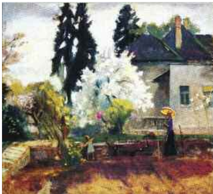
Nagy János: Tavaszi kertben , 1990 (olaj) Nagy János Gyűjtemény, Tápiószele