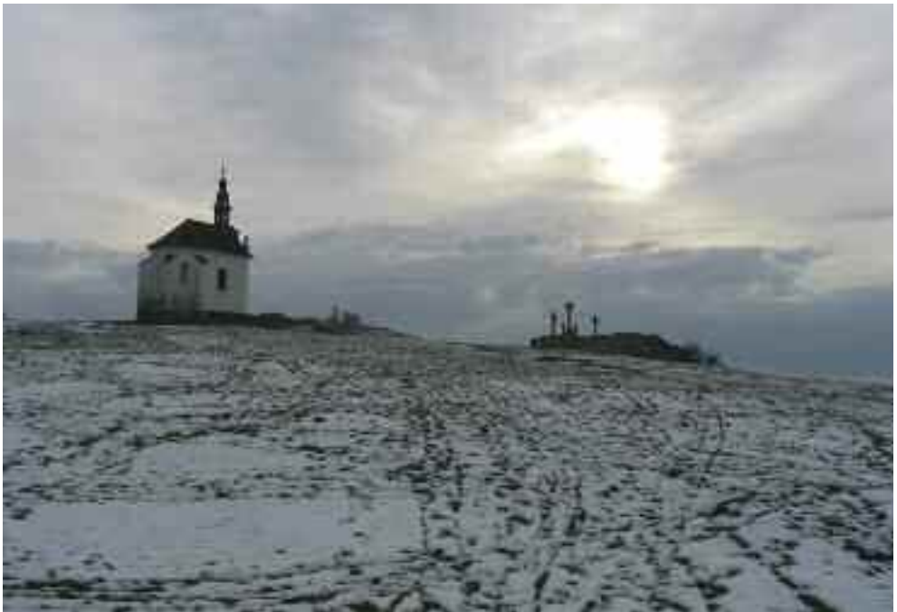
A Kálvária-domb távlati képe a Kálvária szoborcsoporttal, Tata (Fotó: P. Tóth 2004)