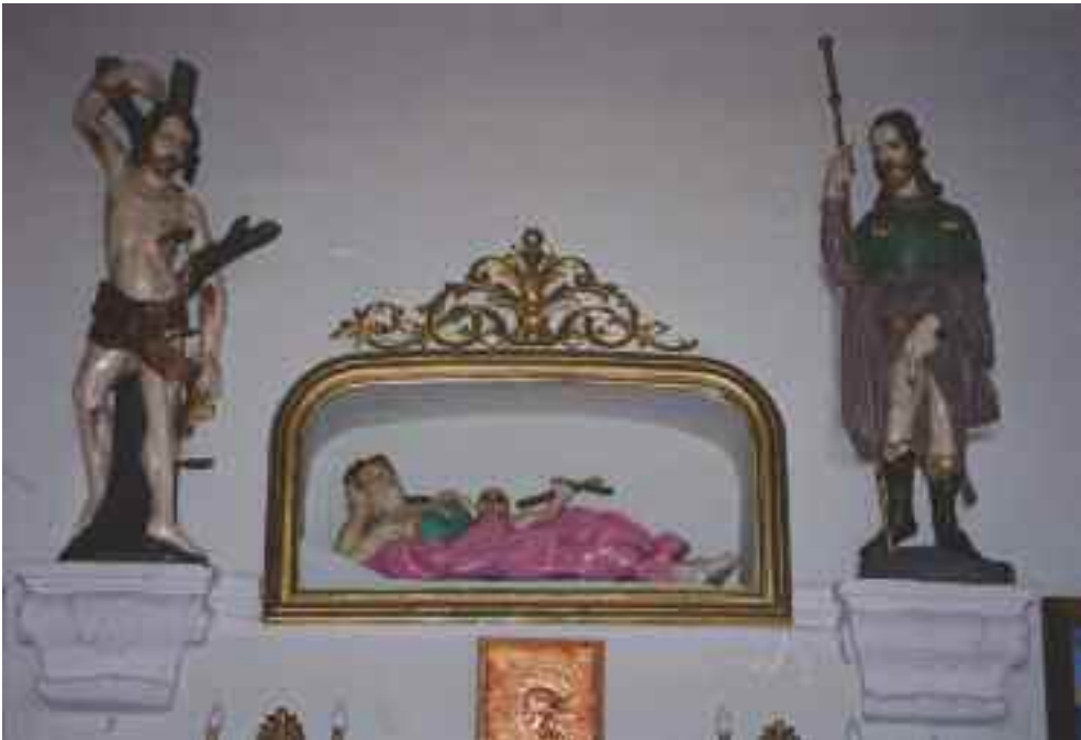
Schwaiger Antal: Szent Rozália-oltár a Sárlocs Boldogasszony templomban, Vértessomló