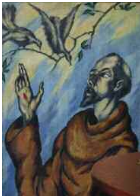
Schadl János: Szent Ferenc a madaraknak prédikál , 1919 (olaj) Tata Város tulajdona