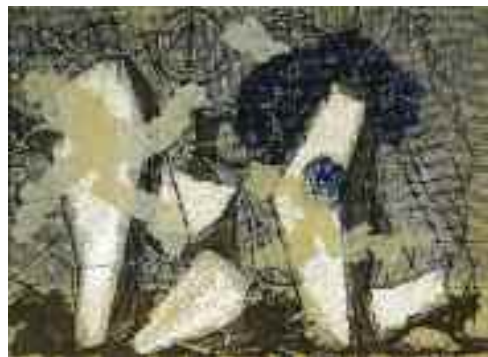
Martyn Ferenc: Halászszerzők a tengerparton , 1941 (olaj) Tata Város tulajdona