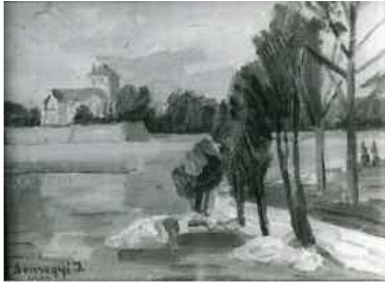
Somogyi Imre: Őreg-tó a tatai várral, 1983 (olaj)