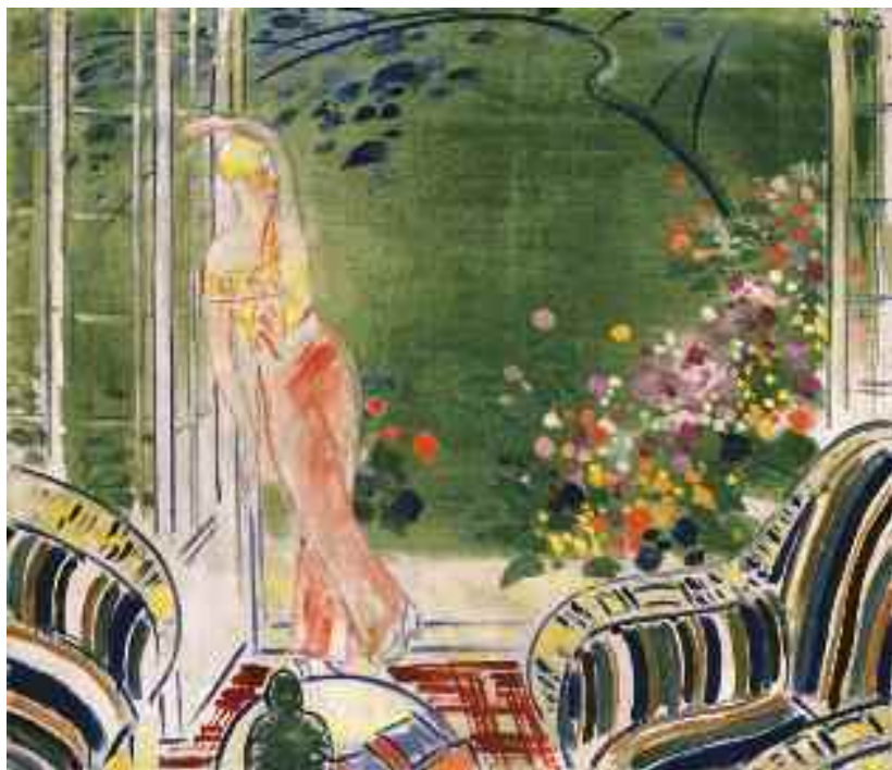
Vaszary János: Verandán álló piros pizsamás nő, 1930 körül (olaj) MNG