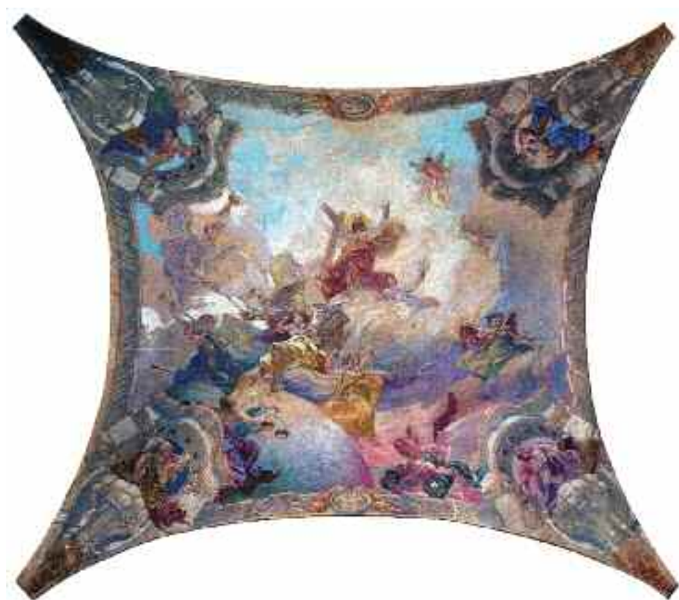
Muhits Sándor–Stiasny Aladár: Falképterv a tatai Nagytemplomhoz (kupola), 1912 (toll, akvarell, fedőféhér, karton) KDM