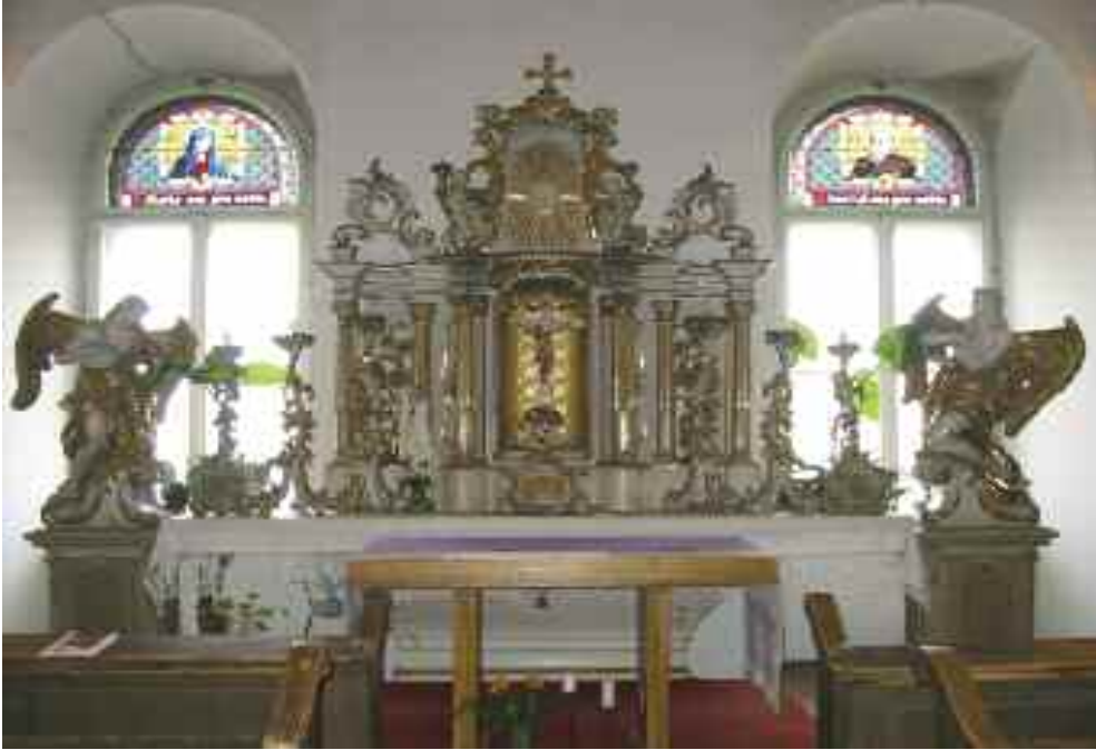
Schwaiger Antal: Szobordísz az egykori tatabi piarista rendház kápolnájának oltáráról. Piarista rendház emeleti kápolnája, Kecskemét.