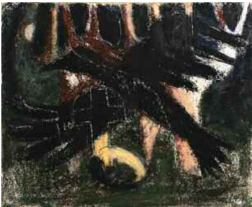
Zilahy György: Sötét árnyék II. , 1960-as évek (pasztell) KDM

A képaláírásokban szereplő rövidítések: KDM – Kuny Domokos Múzeum MNG – Magyar Nemzeti Galéria