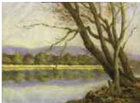
Trojkó Imre: Tópart (pasztell) KDM

(Komárom Megyei Dolgozók Lapja 1958. augusztus 2.)