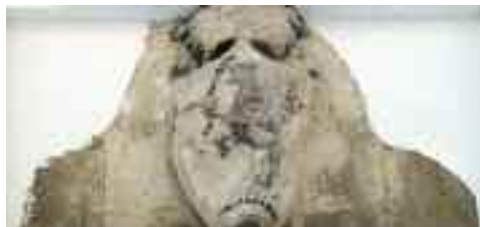
Schwaiger Antal: Esterházy-címer, Kietreiber-malom, Tata

A címerpajzsban koronán álló, kardot tartó griff látható, a pajzs fölött szintén egy koronával. A mű mára erősen megkopott, sérült, de az alapvető formák jól kivehetők rajta.