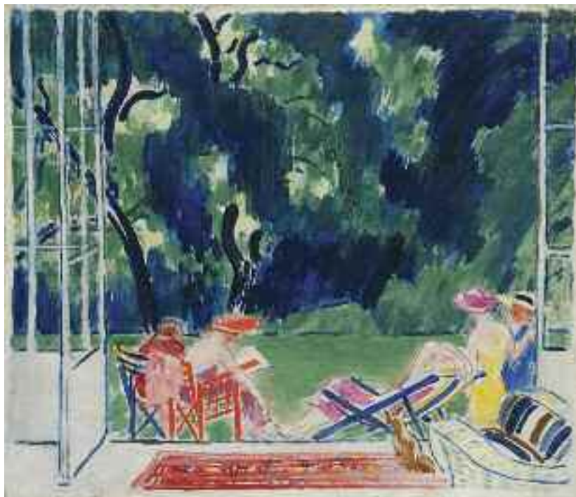
Vaszary János: Parkban, 1936 (olaj) MNG