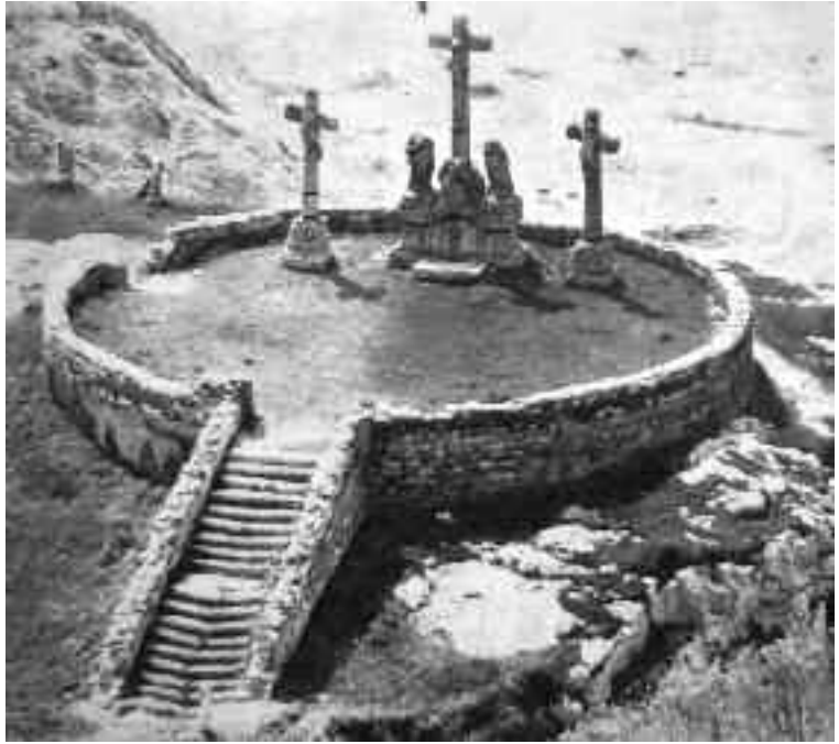
Kálvária szoborcsoport, Tata (Közli: RADOS 1964, 101. kép)