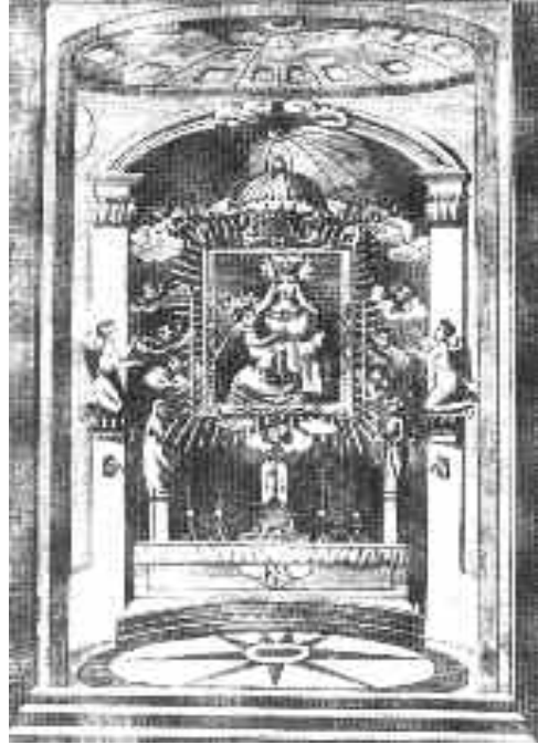
Domeck metszete a Sárlocs Boldogasszony templom szentélyéről, Vértessomló (1836)