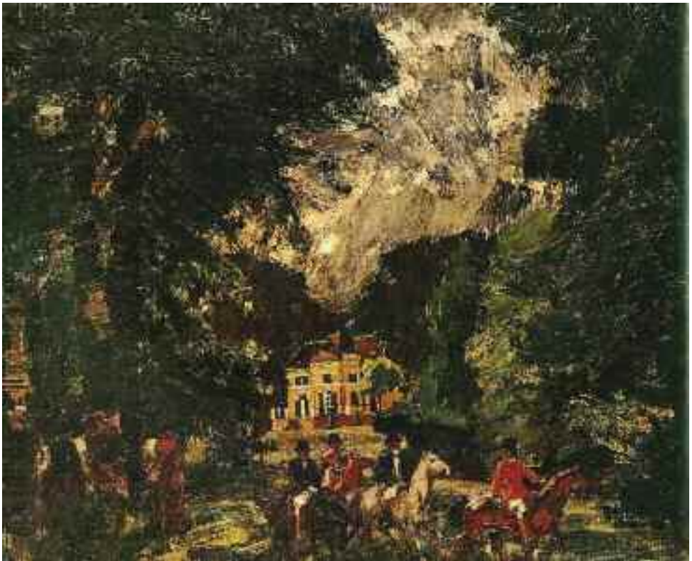
Vaszary János: Lovasok a parkban , 1919 (olaj) MNG

A Lovasok a parkban kompozíciót követően, a fekete alapos korszak után Vaszary elszakadt a kert külső ábrázolásaitól. A táj, a lombok, a fák valóságos