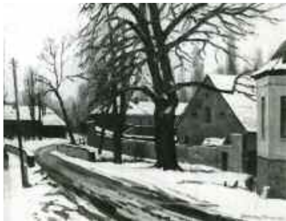
Somogyi Imre: Tóvárosi Nepomuki malom, 1981