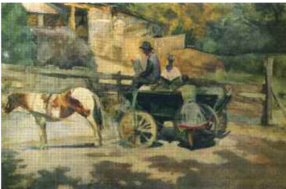
Nagy János: Pónilovas szekér (Déli napsütésben) , 1961 (olaj) Nagy János Gyűjtemény, Tápiószele