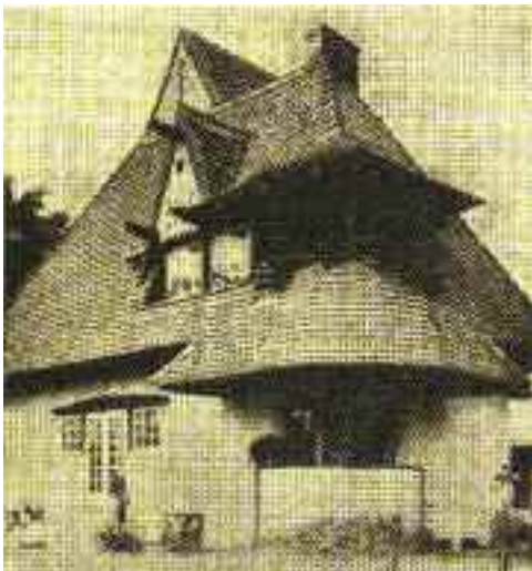
A Vaszary-villa, 1916