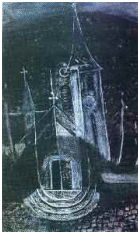
Zilahy György: Tokaj, 1965 (pasztell) KDM

(Zilahy György festőművész emlékkiállítás, Tokaj, 2009., Paulay Ede Színház)