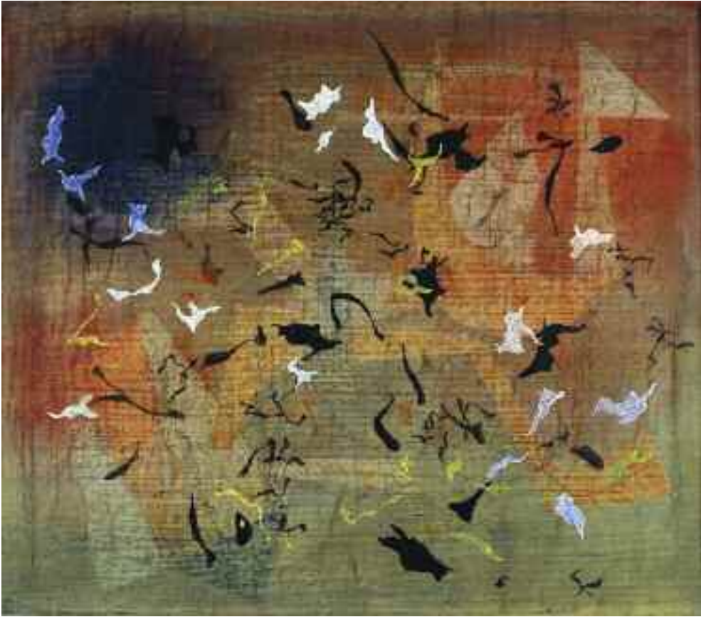
Martyn Ferenc: Festménytev (olaj) Tata Város tulajdona