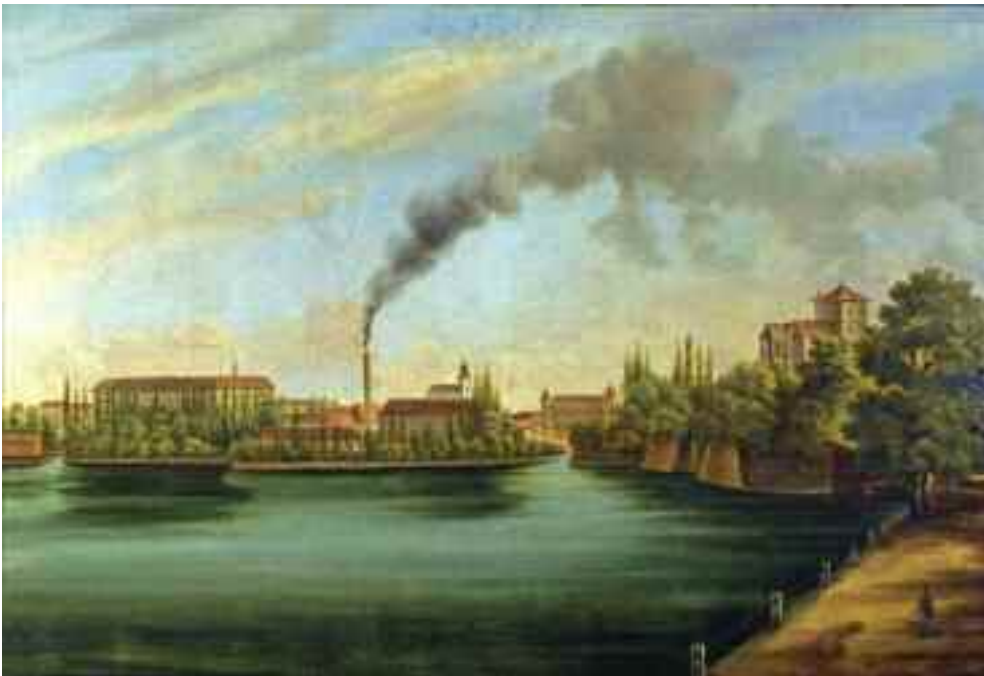
Stech Alajos: Tata látképe, 1867 (olaj) KDM