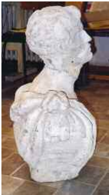
Schwaiger Antal: Római férfit ábrázoló büszt, szoborpár egyik darabja, Tata (Kuny Domokos Múzeum, Tata, Képzőművészeti Gyűjtemény)