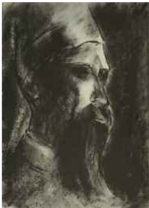
Schadl János: Szakállas férfi , 1942 (szén) Tata Város tulajdona