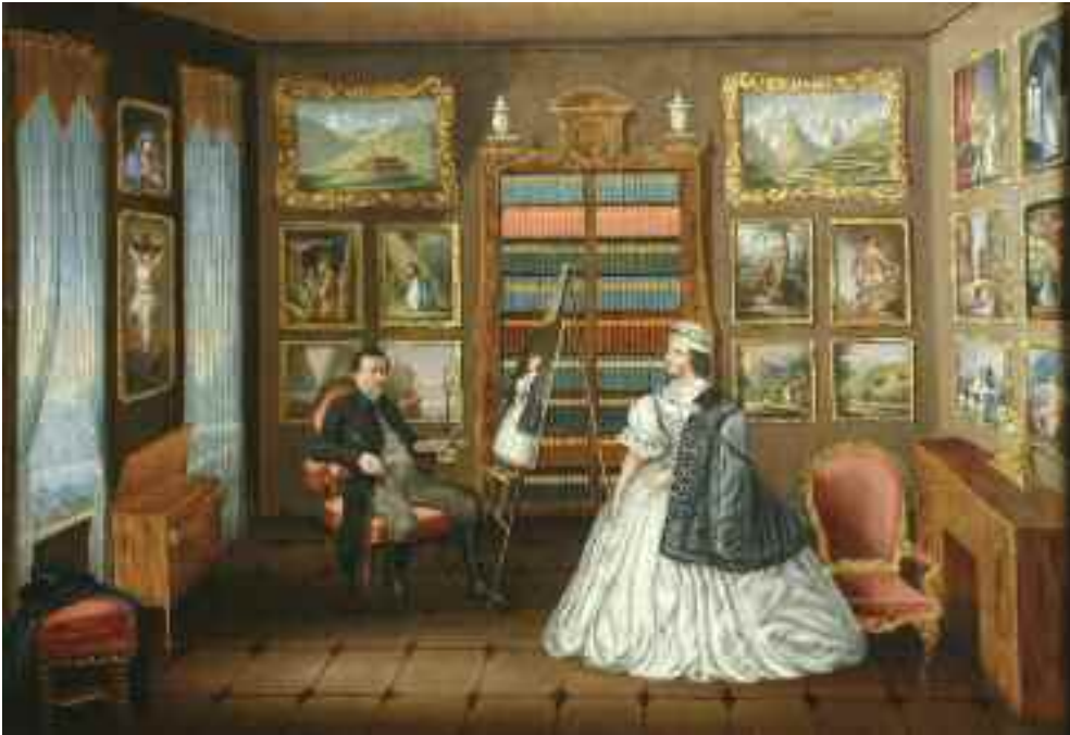
Stech Alajos: A művész műterme, 1840-es évek (olaj) KDM