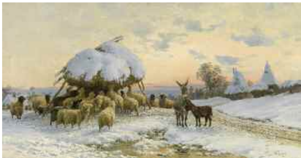
Pállik Béla: Télien , 1901 (olaj)