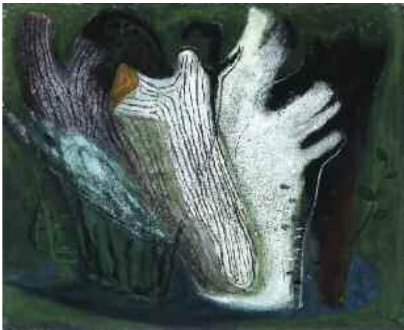
Zilahy György: Lidércfény , 1960-as évek (pasztell) KDM