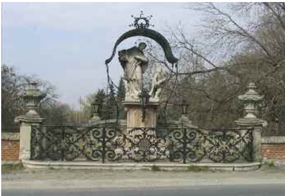
Schwaiger Antal: Nepomuki Szent János szoborcsoport, Tata