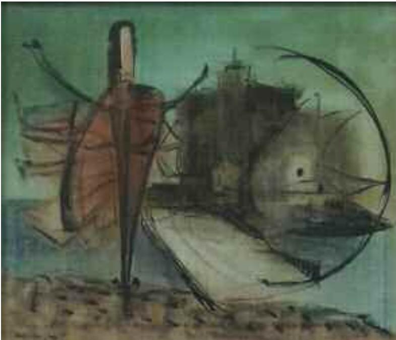
Martyn Ferenc: Ulysses , 1955. Tata Város tulajdona