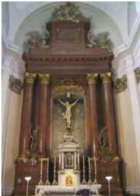
Schwaiger Antal: A Szent Kereszt plébániatemplom főoltára, (corpus, angyalalak, oszlopfő) Tata