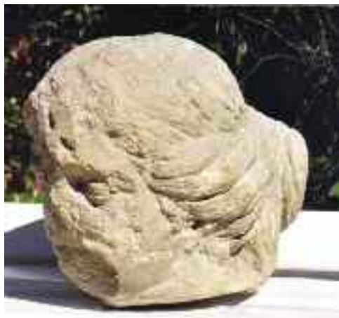
Schwaiger Antal: Nőalakot ábrázoló szobor töredéke, Tata (Kuny Domokos Múzeum, Tata, Képzőművészeti Gyűjtemény)