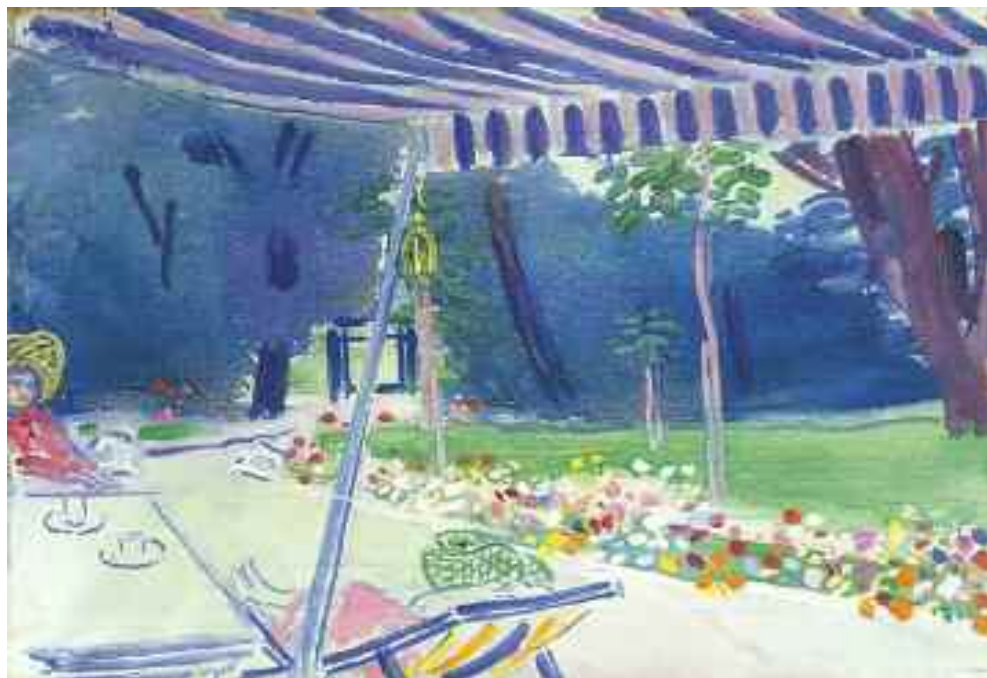
Vaszary János: In the Garden-Late , 1930