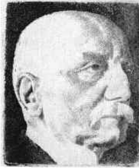
Aba-Novák Vilmos: Pasteiner Gyula , 1926 (rézkar)