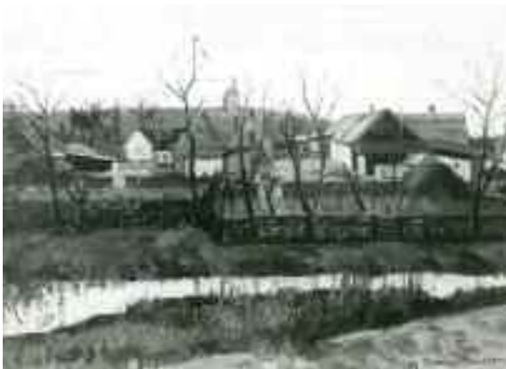
Somogyi Imre: Falurészlet Tatán a Kálvária alatt, 1980