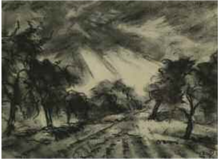
Schadl János: Fény a fák felett, 1942 (szén) Tata Város tulajdona