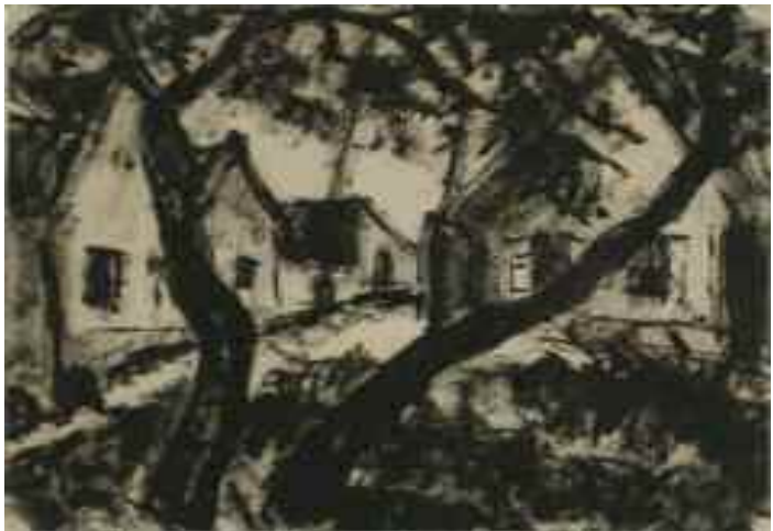
Schadl János: Utcarészlet, 1933 (tinta) Tata Város tulajdona

(A Kuny Domokos Múzeum Közleményei 19. [2013.] 163–172.)