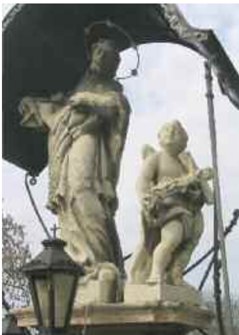
Schwaiger Antal: Nepomuki Szent János szoborcsoport, Tata