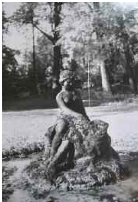
Schwaiger Antal: Szökőkútnimfa, Esterházy-kastély kertje, Tata (Kuny Domokos Múzeum, Tata, Helytörténeti Gyűjtemény, Fotó: Révhelyi Elemér, 1945 előtt)