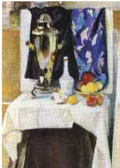
Nagy János: Szamováros csendélet , 1988 (olaj) Nagy János Gyűjtemény, Tápiószele