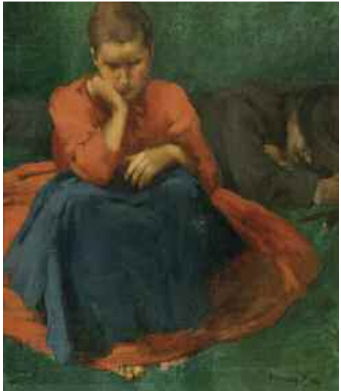
Vaszary János: Pihenés , (Ülő parasztlány, Beszélgetők, Délutáni pihenő), 1904 (olaj) KDM