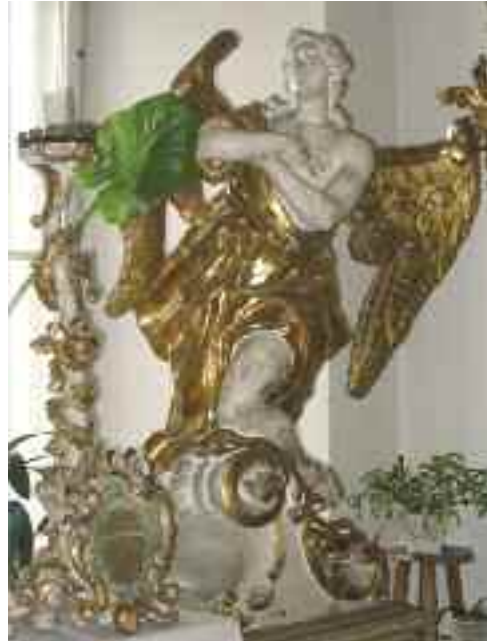
Schwaiger Antal: Szobordísz az egykori tatabi piarista rendház kápolnájának oltáráról. Piarista rendház emeleti kápolnája, Kecskemét.