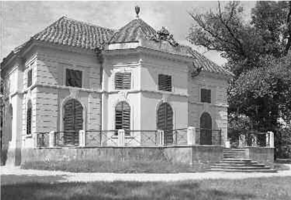
Schwaiger Antal: Kertilak (ornozati szobordísz), Angolkert, Tata