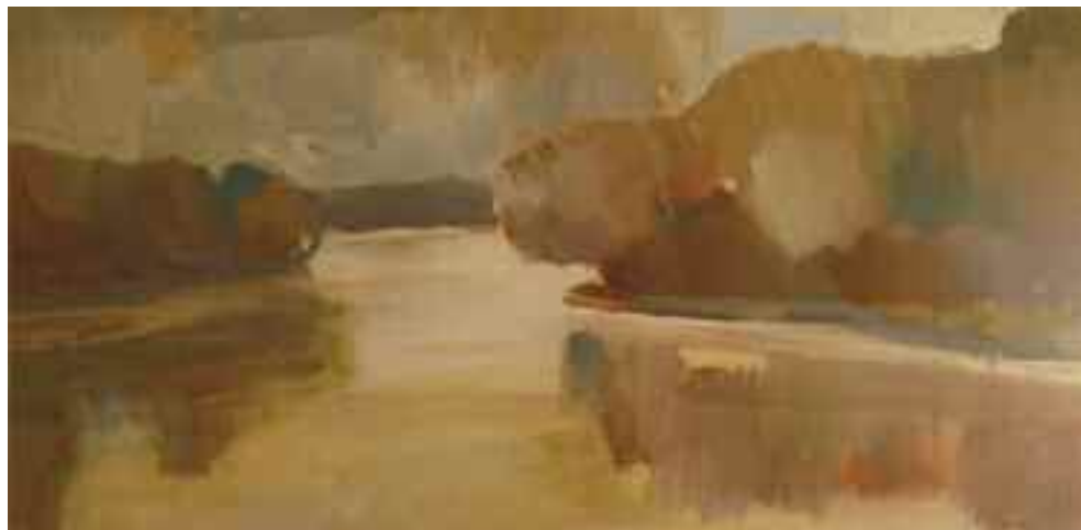
Neuberger Róbert: Mártélyi Tisza-part , 1970-es évek (akvarell)

nagyszabású tanulmányai a művészi igazság fogalmával és mibenlétével, a realizmusnak a magyar képzőművészetben betöltött szerepével, problémakörével foglalkoznak. Betegen, az akadozó szívbetegséggel dacolva is dolgozott: az abszurd irodalomról írt értékezése azonban már kényszerűen csonka maradt. Szeretett élni, de az életet csak úgy érezte teljesnek, ha cselekvései, gondolatai a művészet körül forogtak, ha valami új és szép produktum értékeit ismerhette fel és ismertetette el. Művészek és barátok nagy közössége gyászolja Neuberger Róbertet. Még nehezen hihetjük el, hogy nem toppan majd be a kiállítások megnyitóünnepségeire, nem vitatkozik a klubokban, műtermekben és szerkesztőségi szobákban, nem olvashatjuk az írásait a lapokban és folyóiratokban, nem tűnik fel alakja a tatai Őreg-tó partján, az esztergomi Várhegyen, a tatabányai városközpontban, a mártélyi Tisza-parton, a budapesti egyetem folyosóin. Hiánya hiány marad.