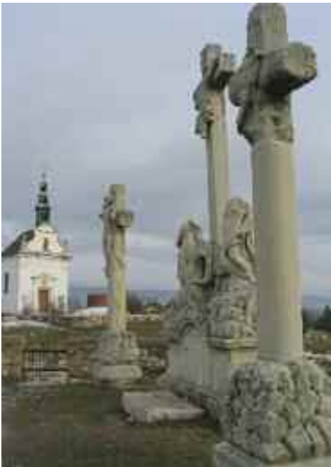
Schwaiger Antal: Kálvária szoborcsoport, Tata