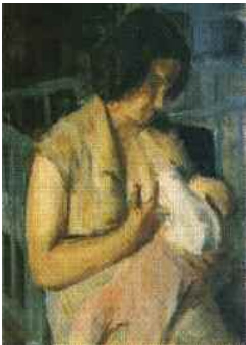
Nagy János: Anya gyermekével , 1952 (olaj) Nagy János Gyűjtemény, Tápiószele