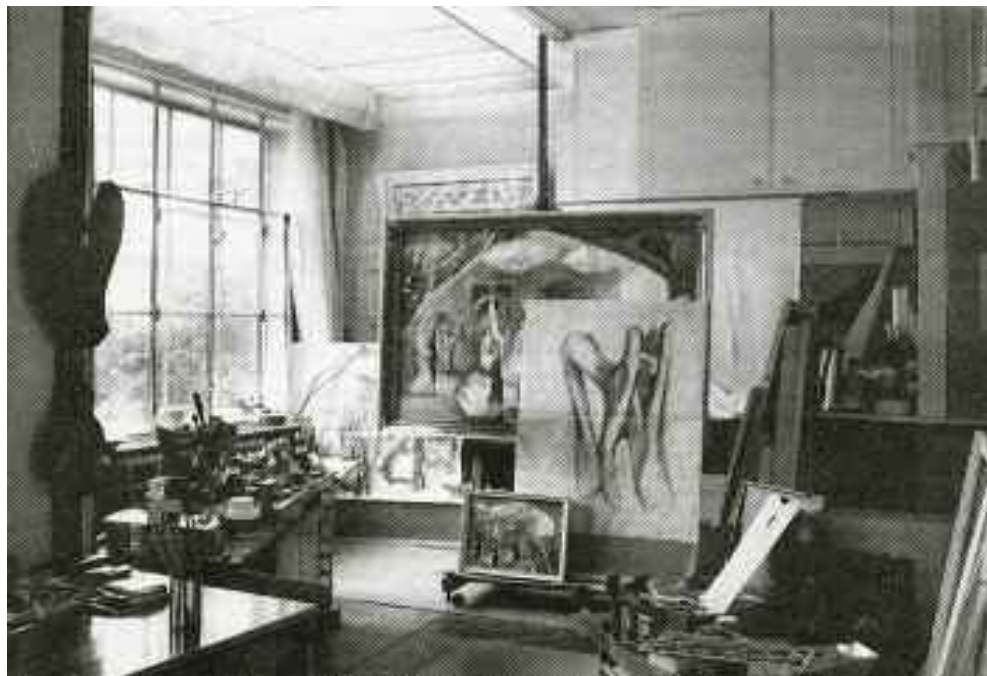
Nagy János budapesti műterme