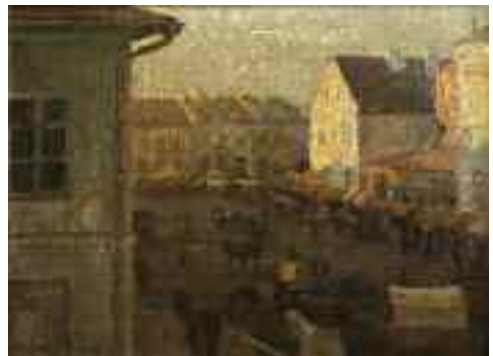
Pap Emil: Brody főtere , 1916 (olaj) KDM