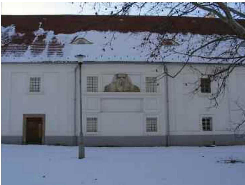
Kietreiber-malom, Tata