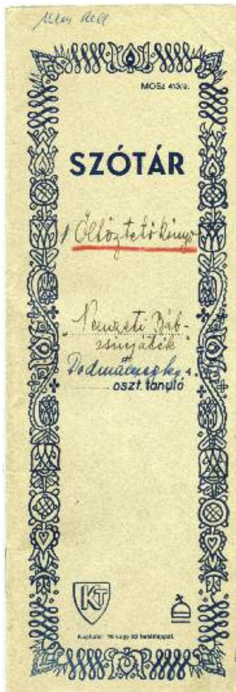
Az Öltöztetős könyv, 1941