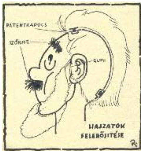
Hajzatok felerősítése, Rév István Árpád rajza, 1948.

kell a milliónek, és csak enyhén komikus bábokkal lehet kezdeni.”