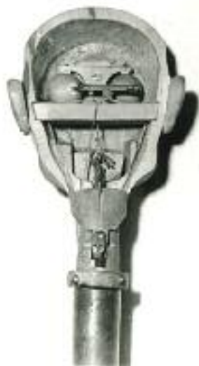
Rév István Árpád mechanizált botbábjának szerkezete, 1948