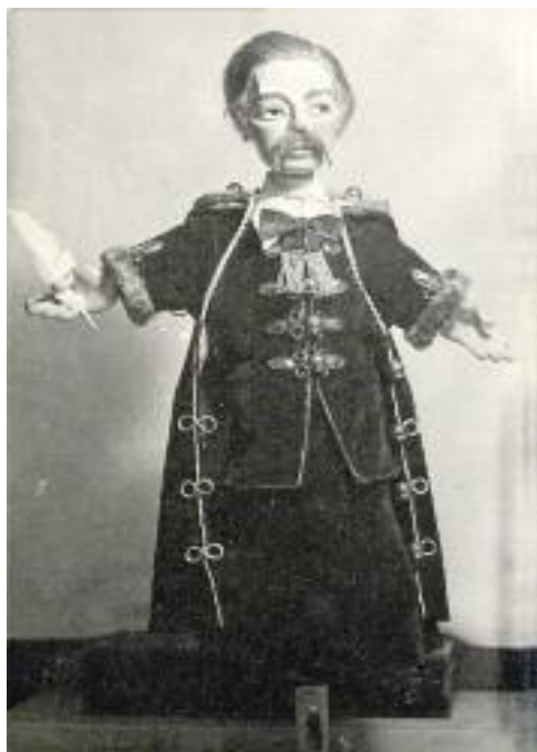
Részlet a Toldi című bábelőadásból